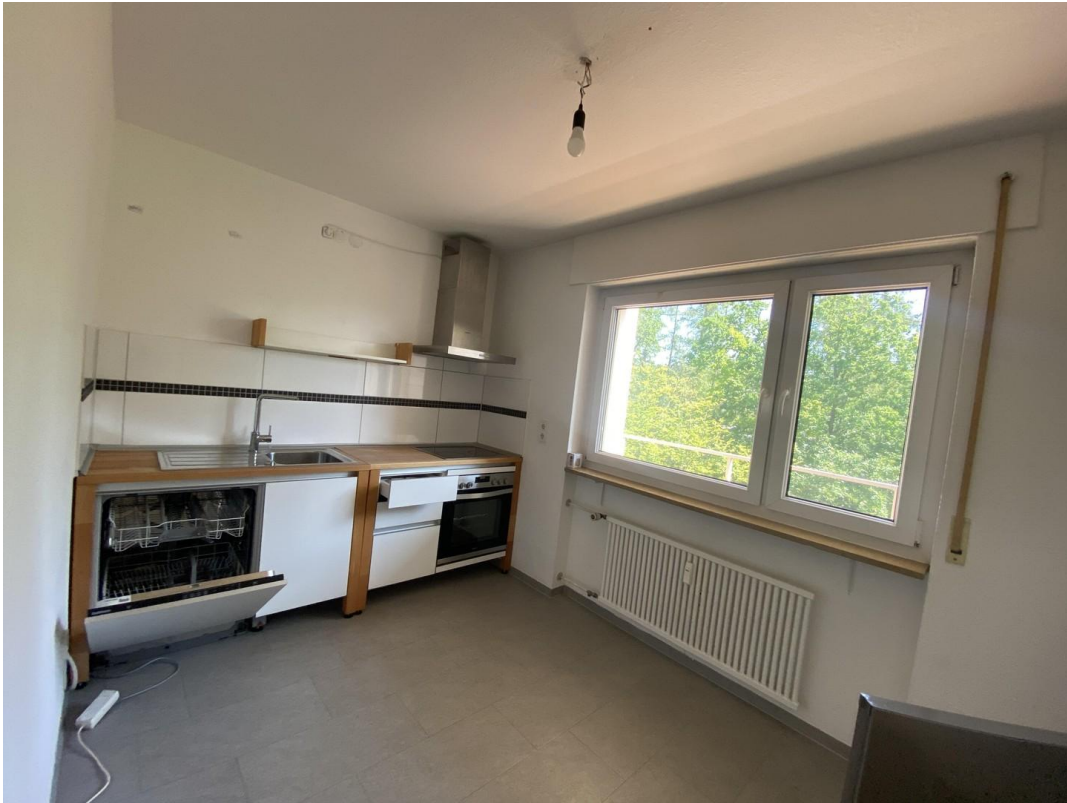
Küche mit Fenster zu Ostbalkon