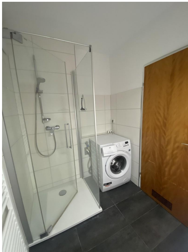
Dusche und Waschmaschine