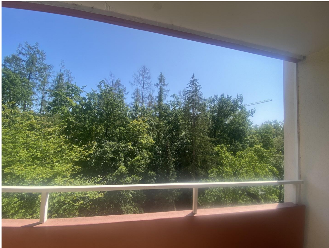
Blick aus der Küche nach Ost