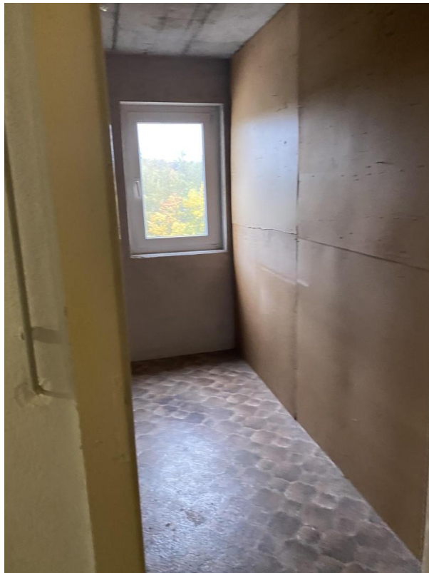
Keller / Tageslicht und Strom