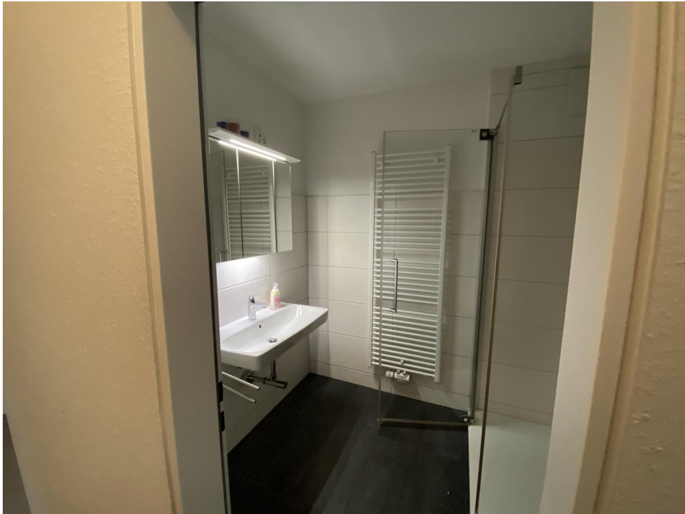
Bad Dusche Waschmaschine