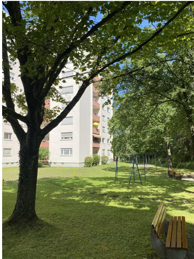
Blick von der Aussenanlage