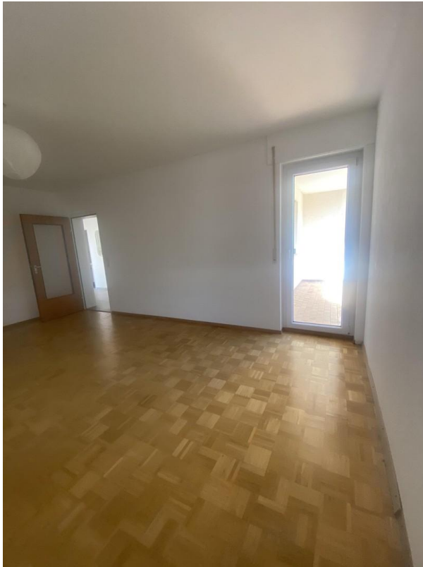
Wohnzimmer mit Zugang Balkon