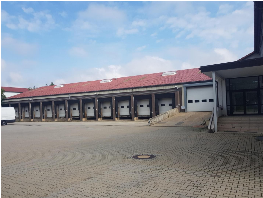
Außenansicht inkl. Freifläche