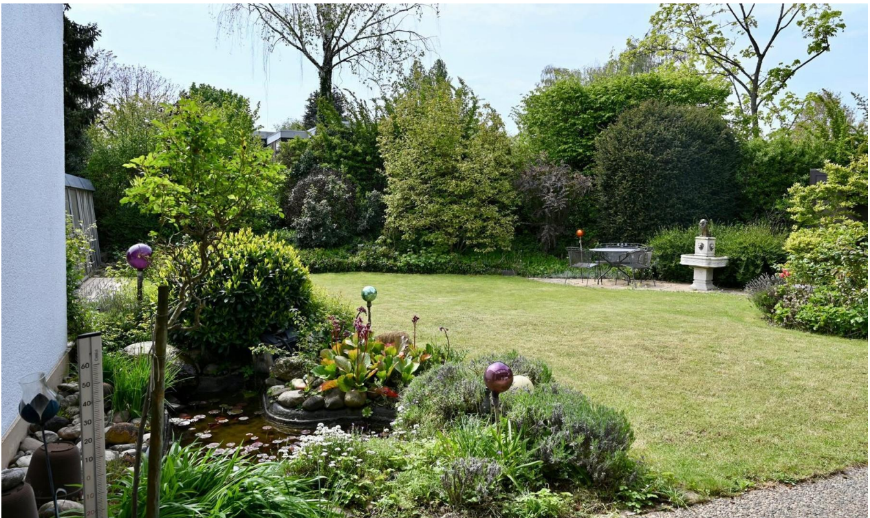
Garten, Sicht von Terrasse