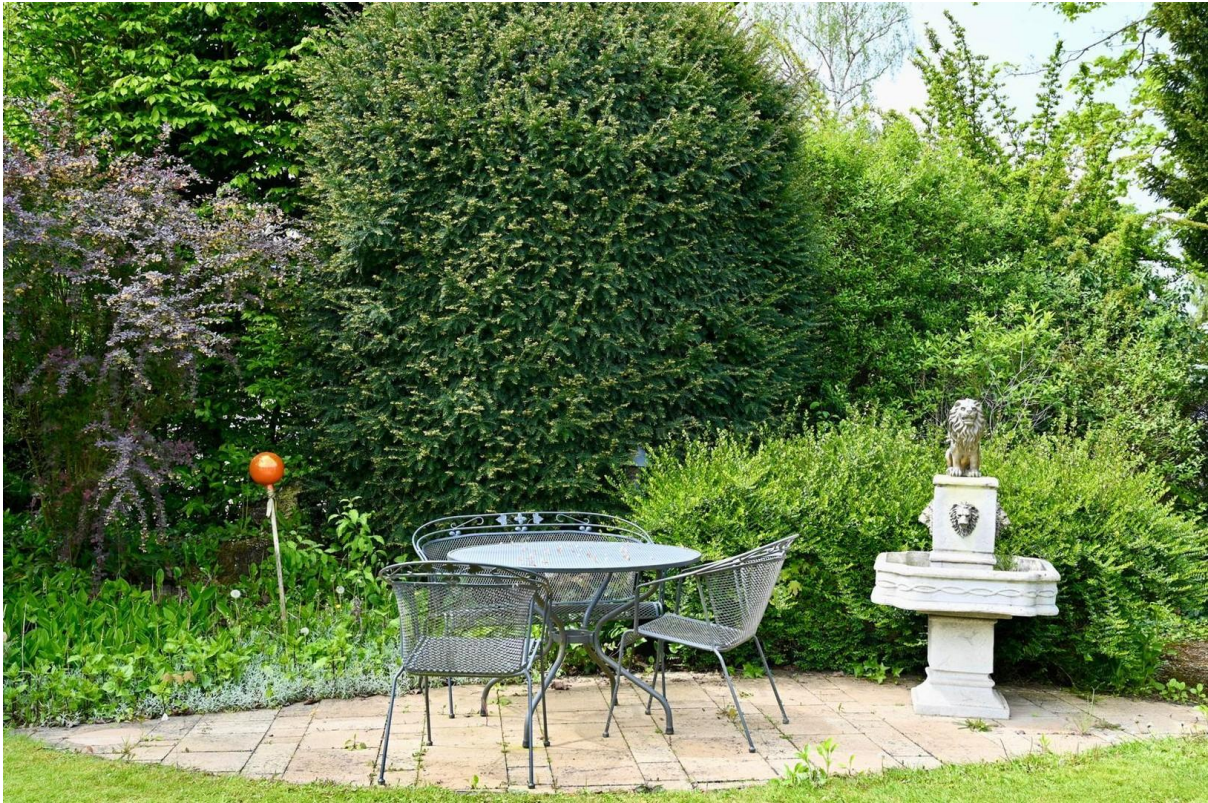
Garten, kleine Terrasse