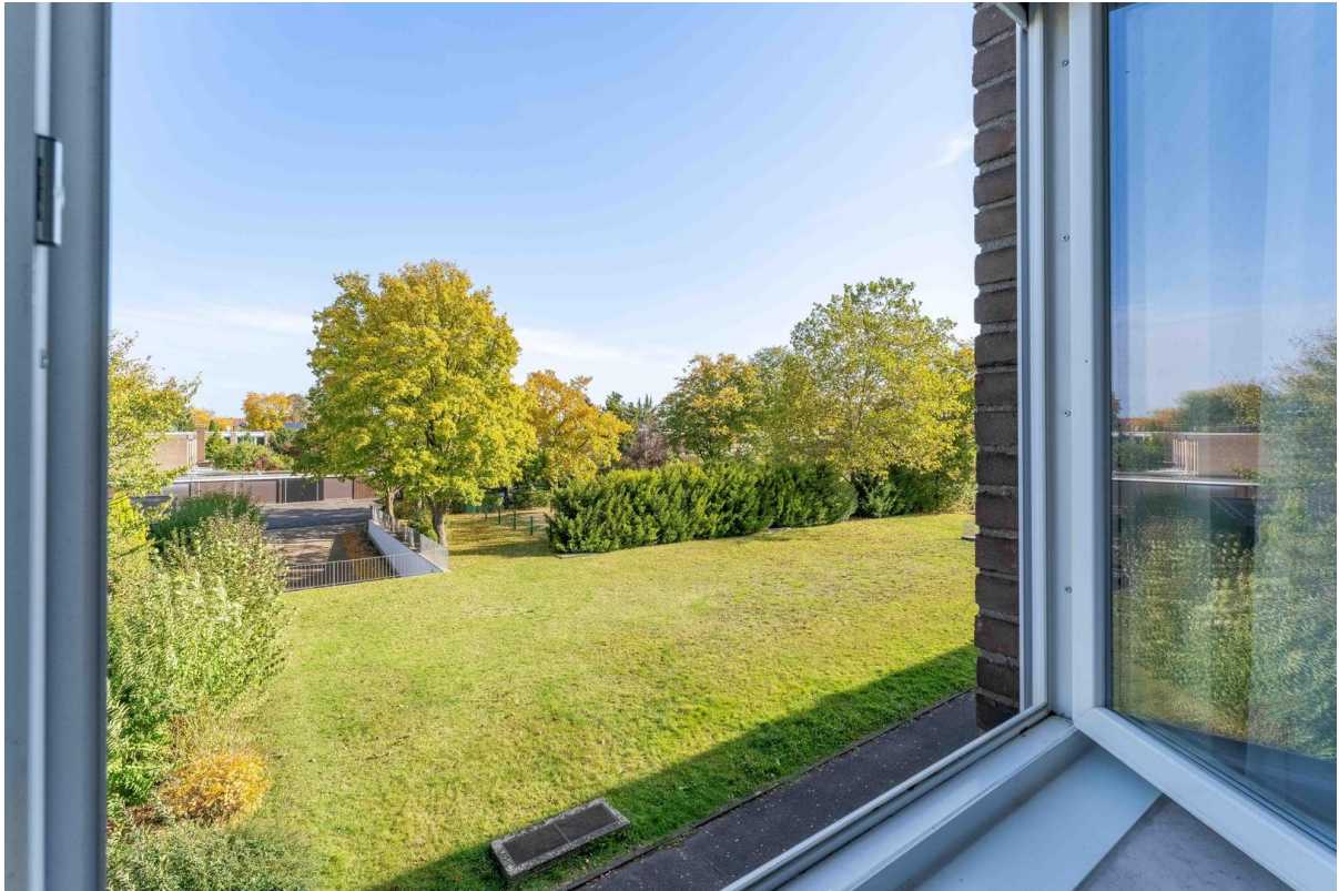
Aussicht der Schlafzimmer