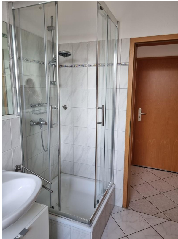
Bad mit Dusche und Badewanne