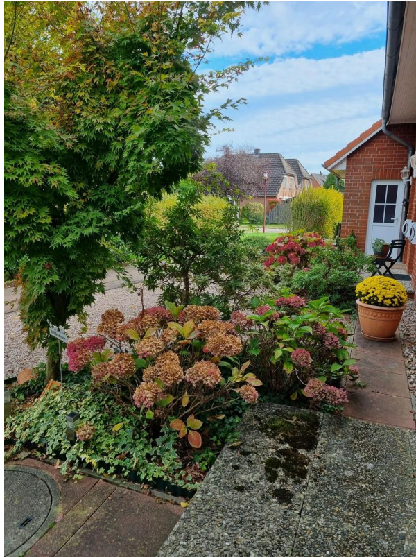
Blick aus dem Eingang