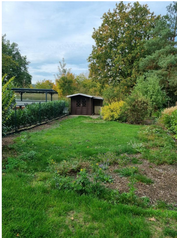
Gartenanteil zur Selbstnutzung