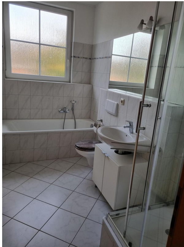
Bad mit Dusche und Badewanne