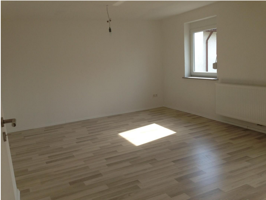
Esszimmer / Wohnzimmer