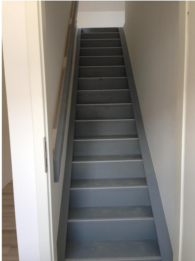
Zugang ins Dachgeschoss