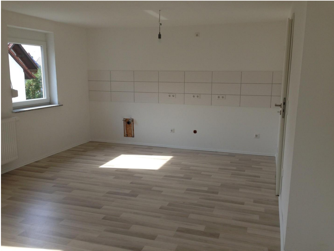
Küche / Esszimmer / Wohnzimmer