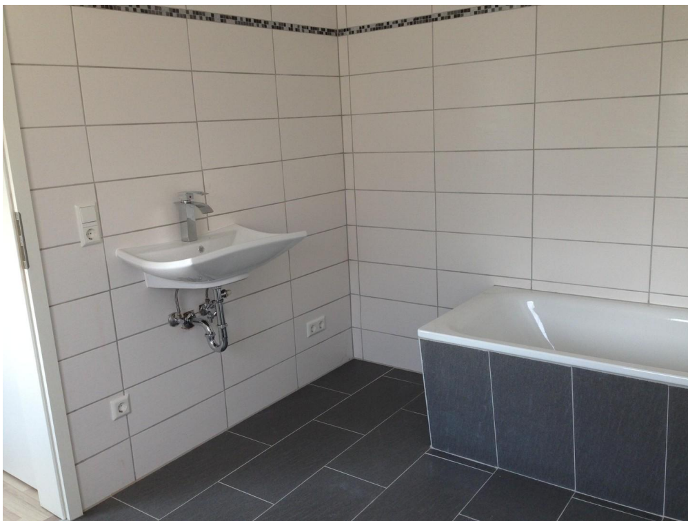
Bad mit Waschmaschinenanschluss