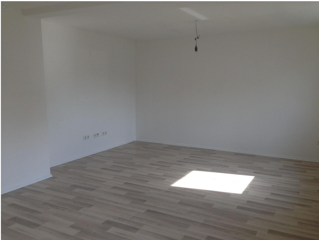
Esszimmer / Wohnzimmer