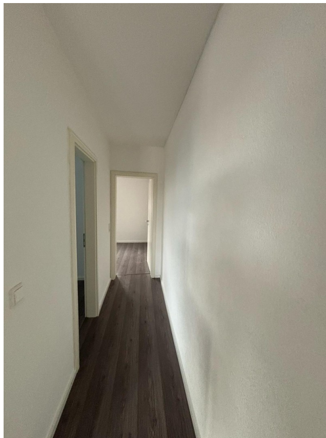
Flur zu Zimmer