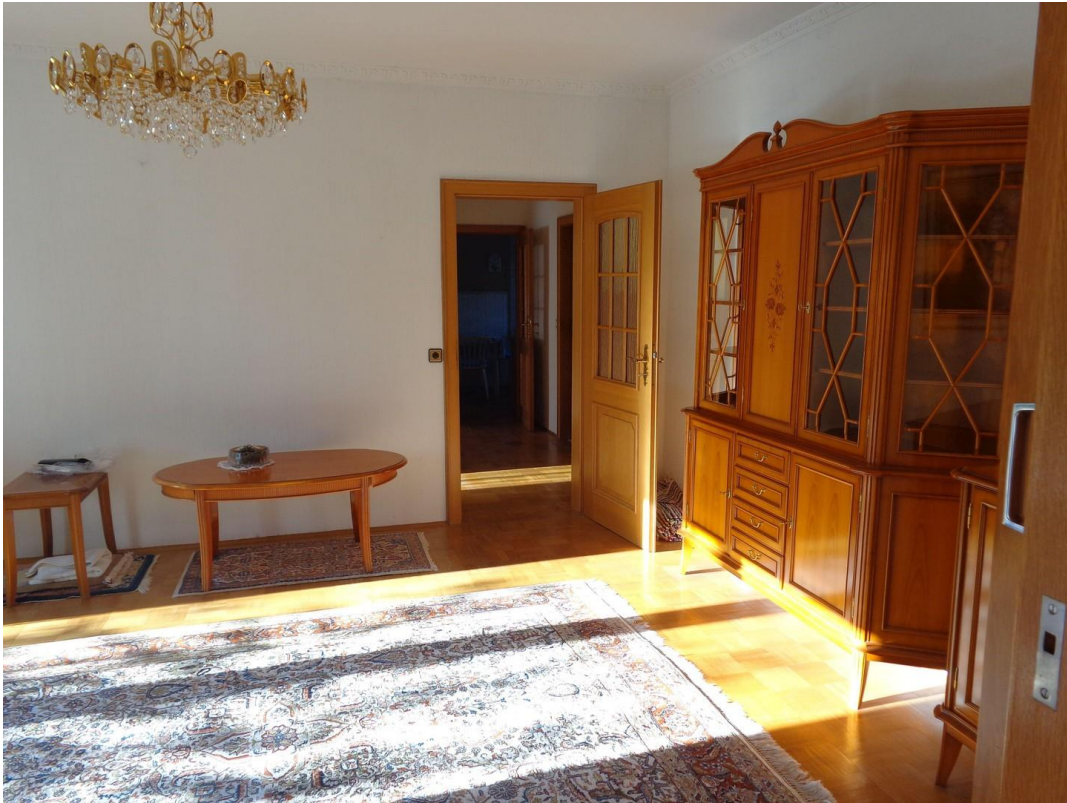
Wohnzimmer Richtung Flur