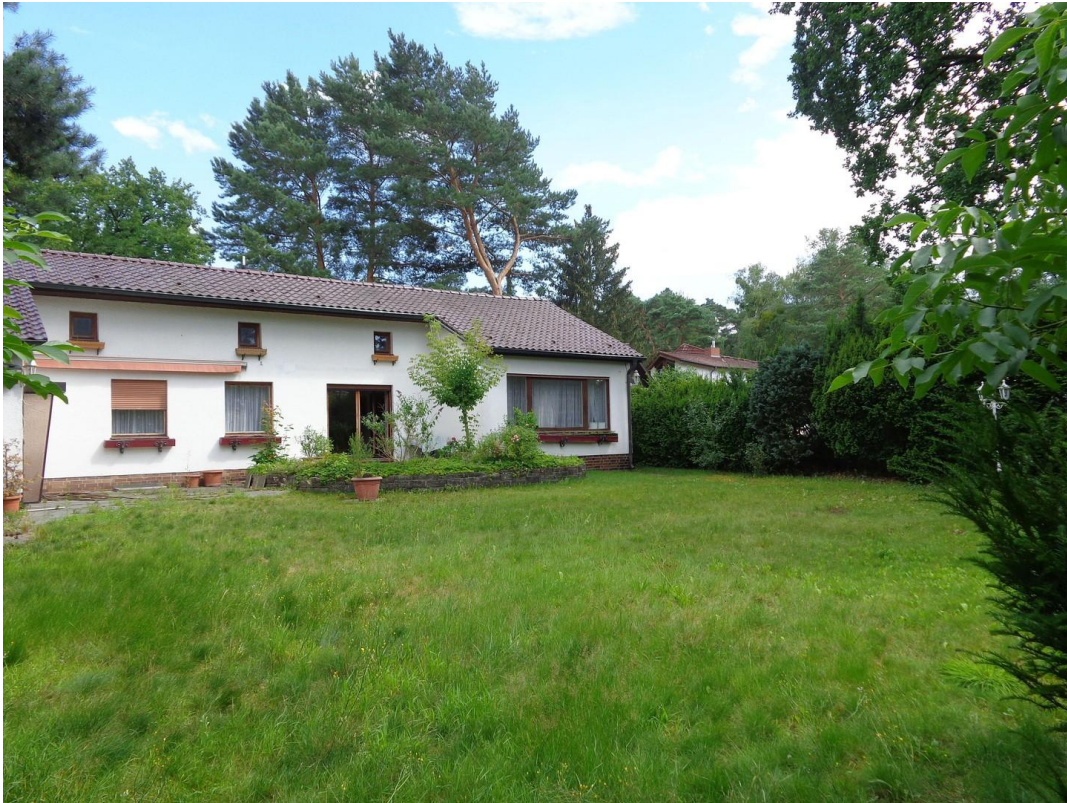
Blick vom Garten Richtung Haus