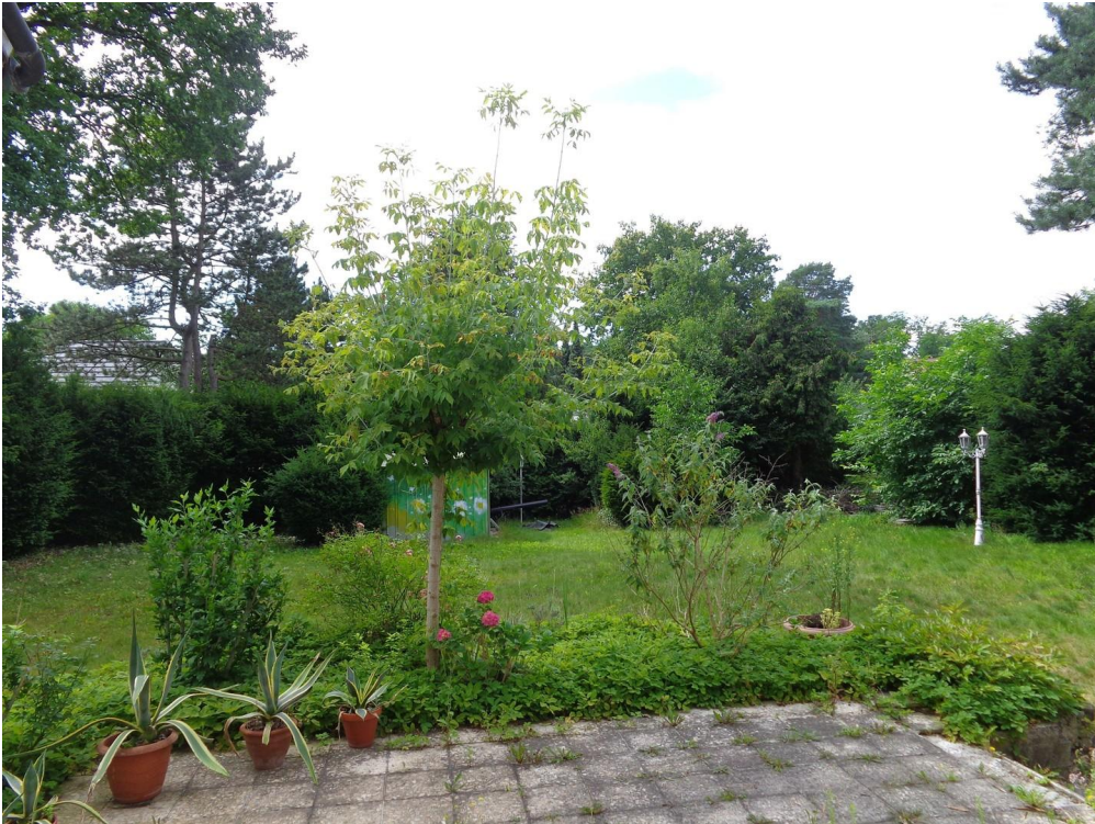
Blick von Terrasse in Garten