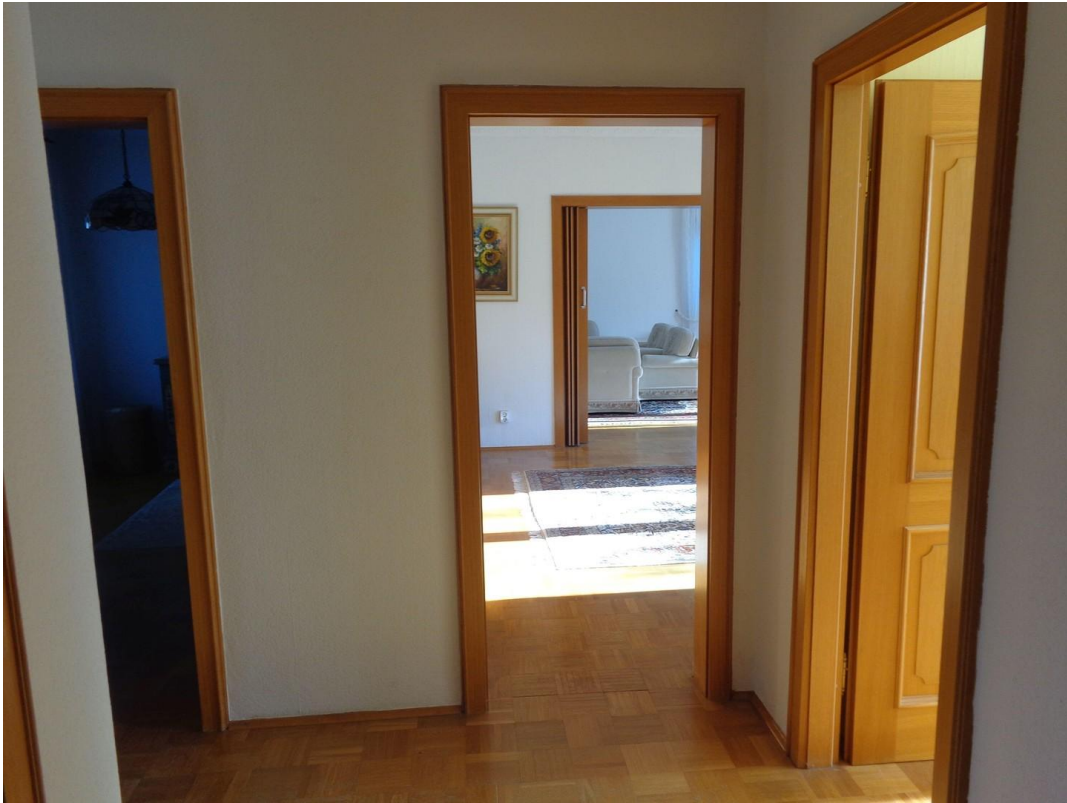
Flur Blickrichtung Wohnzimmer