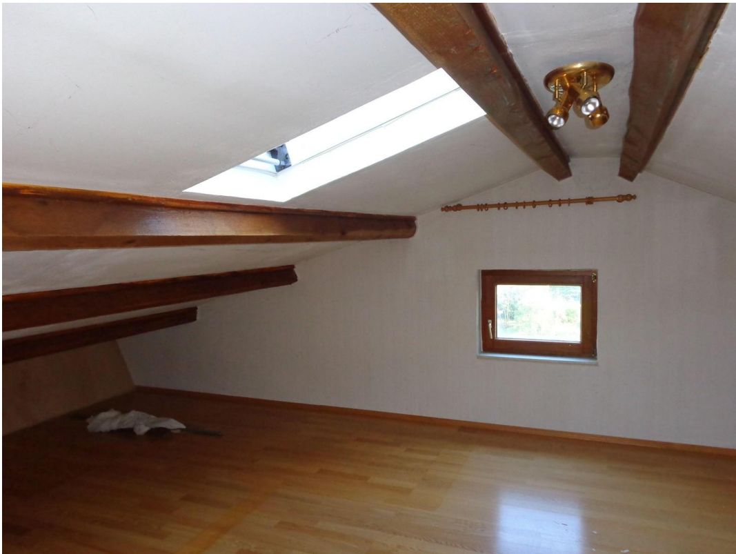
Dachboden über Wohnzimmer