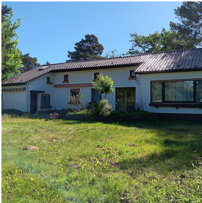
Blick vom Garten Richtung Haus