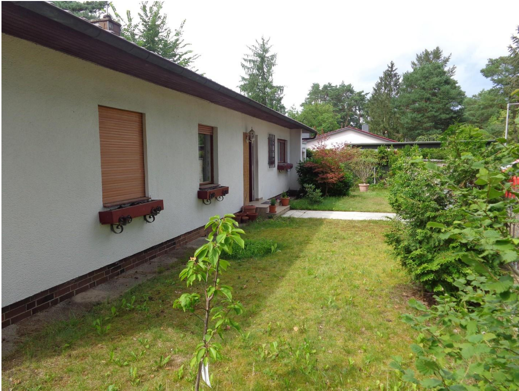
Vorgarten und Vorderseite