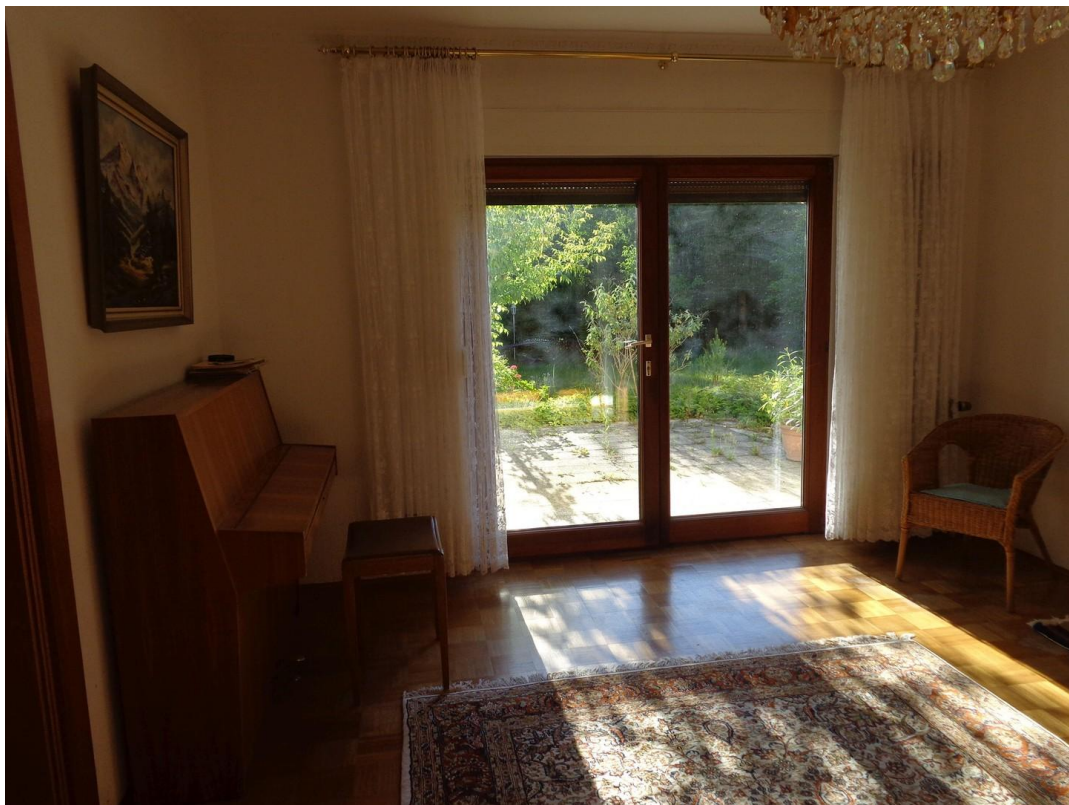
Wohnzimmer, Blick Terrasse