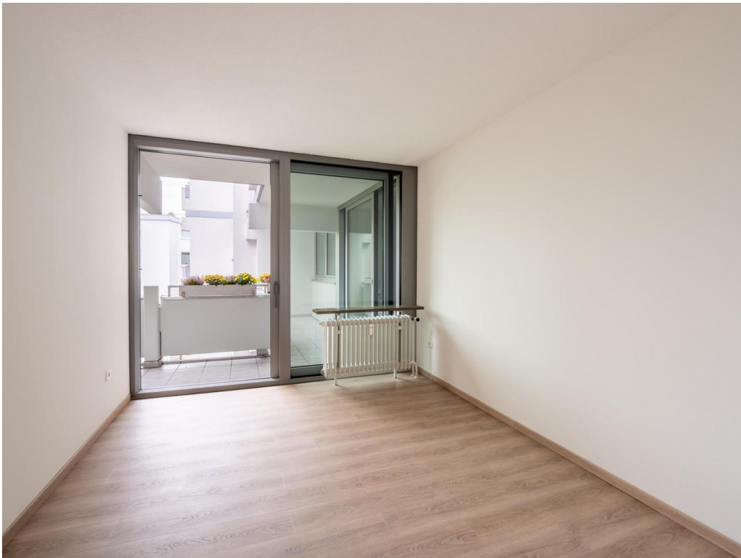
Schlafzimmer 2 / Arbeitszimmer