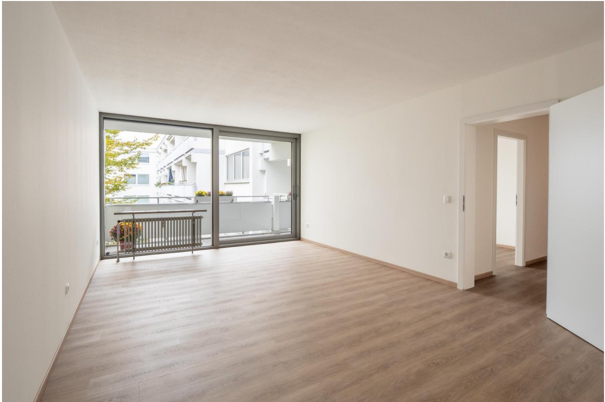
Schlafzimmer 1 leer