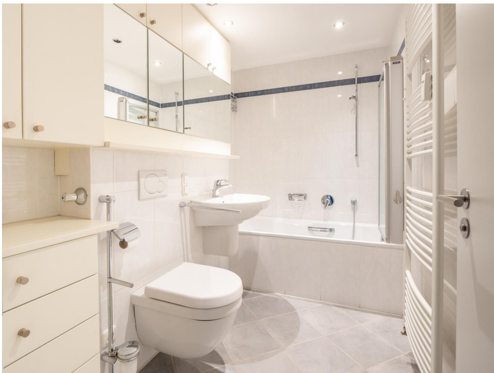
Bad mit Toilette