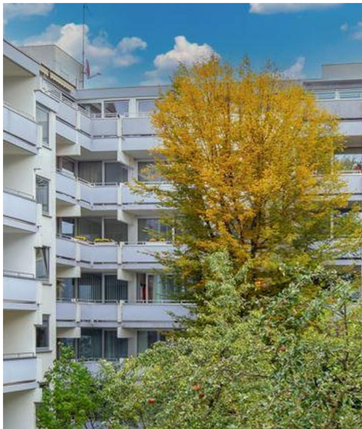
Ansicht von Hinten