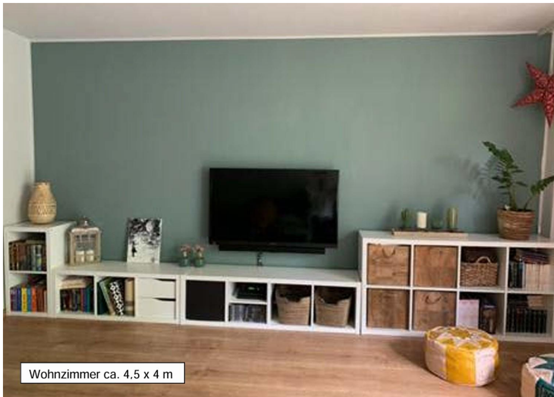
Wohnzimmer ca. 4,5 x 4 m