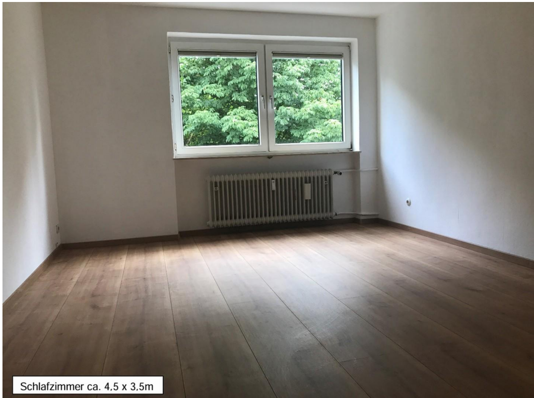
Schlafzimmer ca. 4.5 x 3.5m