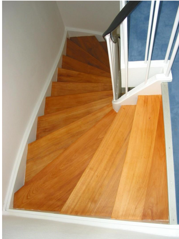
OG Treppe nach unten