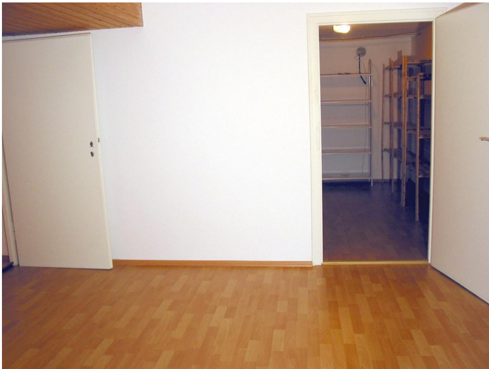
KE grosser Raum/Vorratskeller