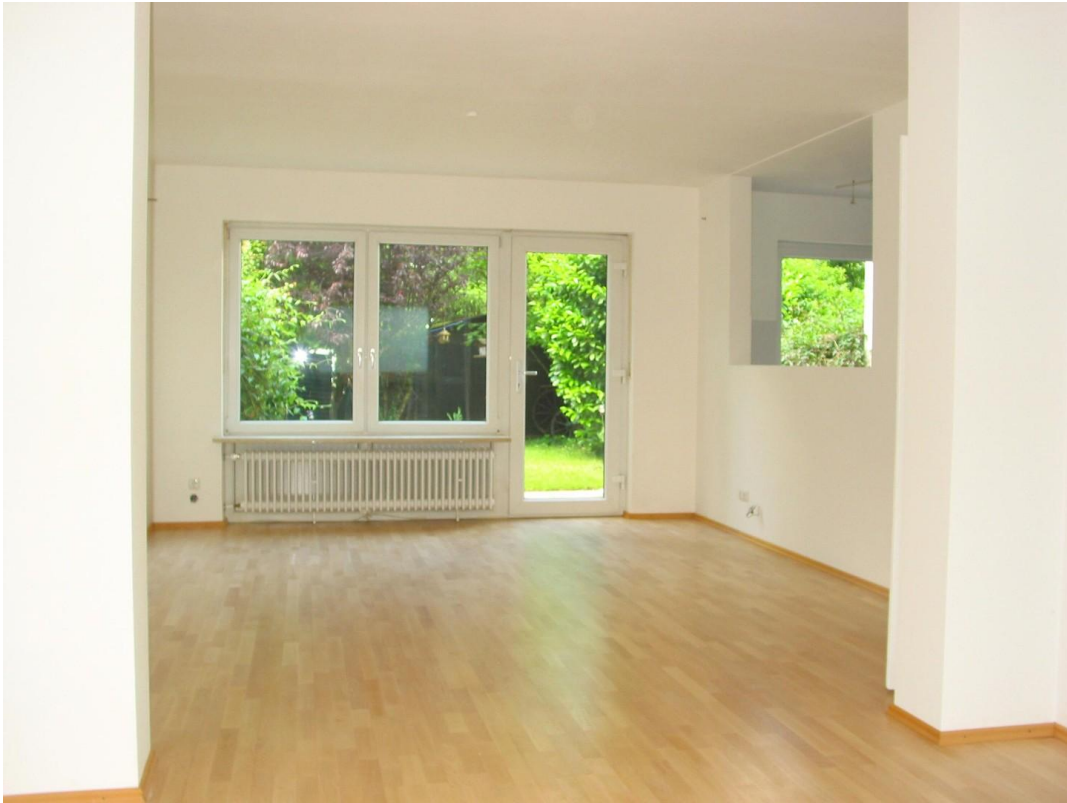
EG Wohnzimmer Gartenseite