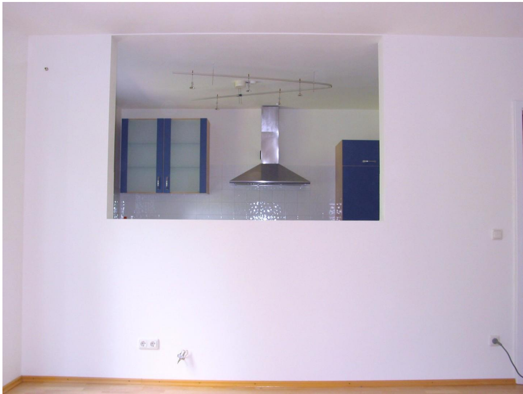
EG Wohnzimmer Blick in Küche