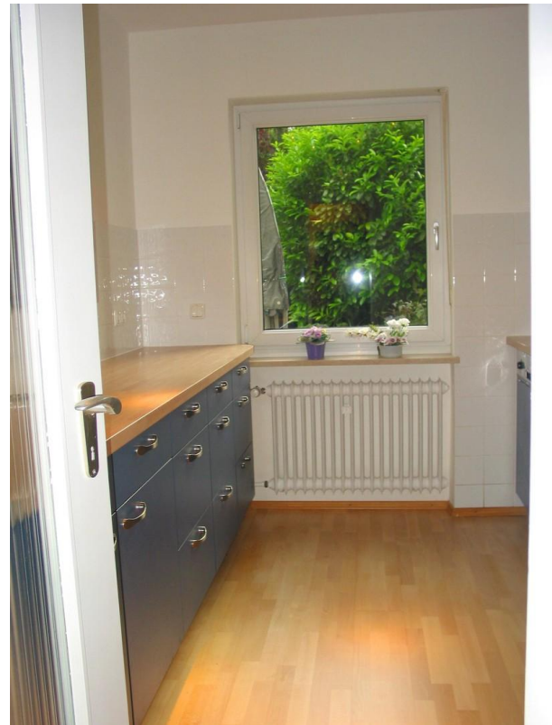
EG Küchenzeile links