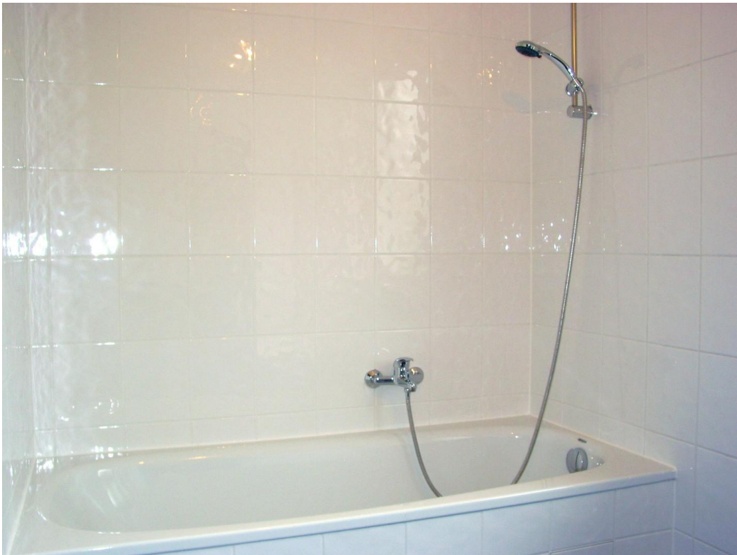
OG Bad 02