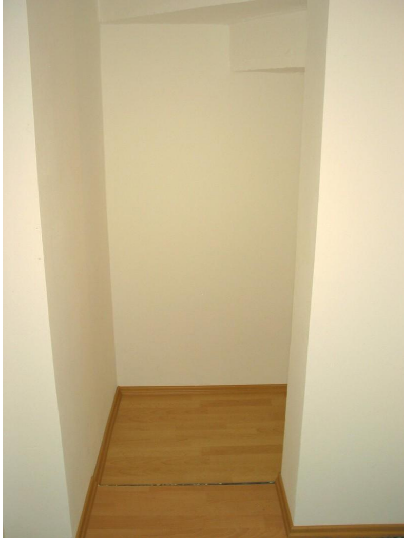
KE Stauraum unter Treppe