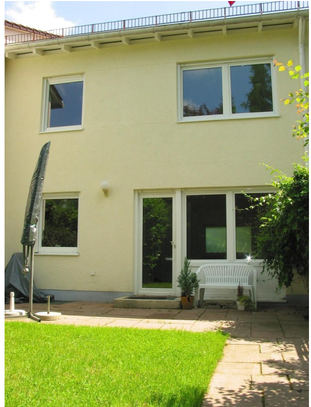
Garten Rasen und Terrasse