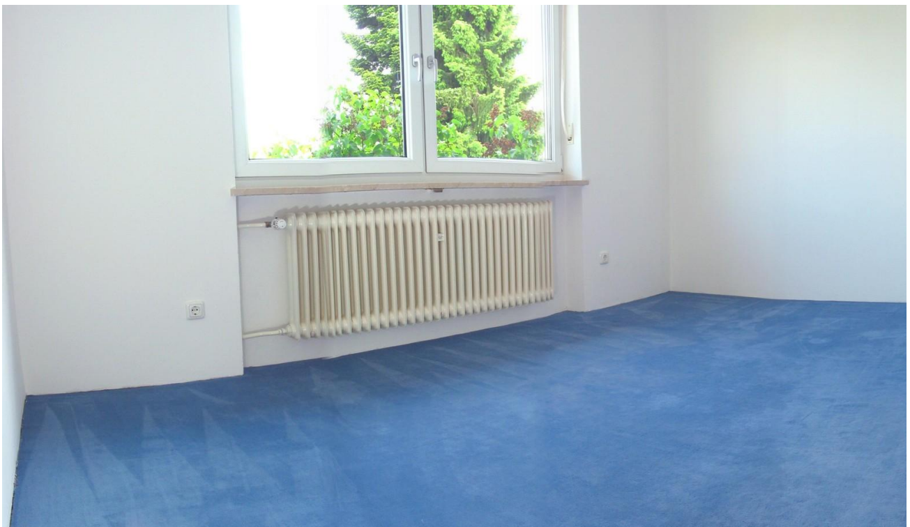
OG Kinderzimmer 01