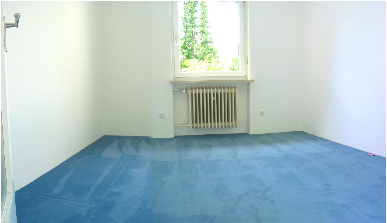
OG Kinderzimmer 02