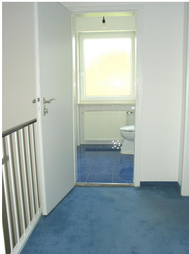
OG Flur und Bad