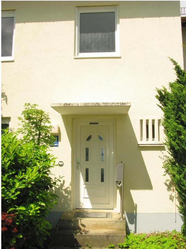
Haustür und Eingangsbereich