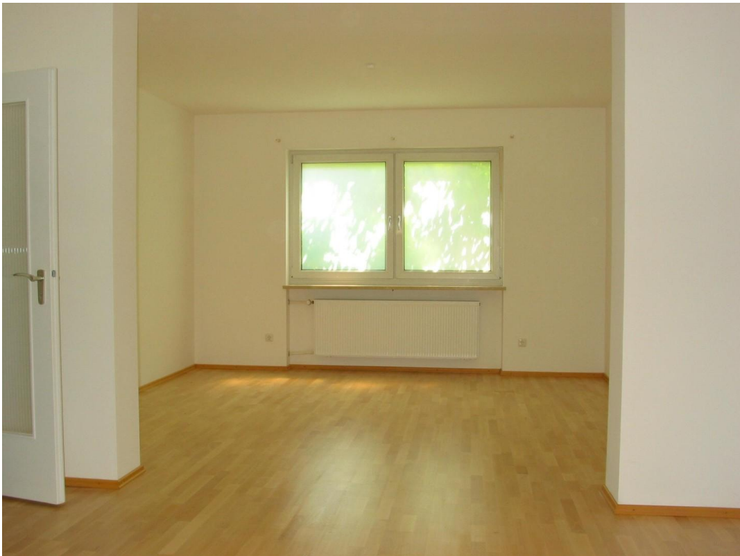
EG Wohnzimmer Haustürseite