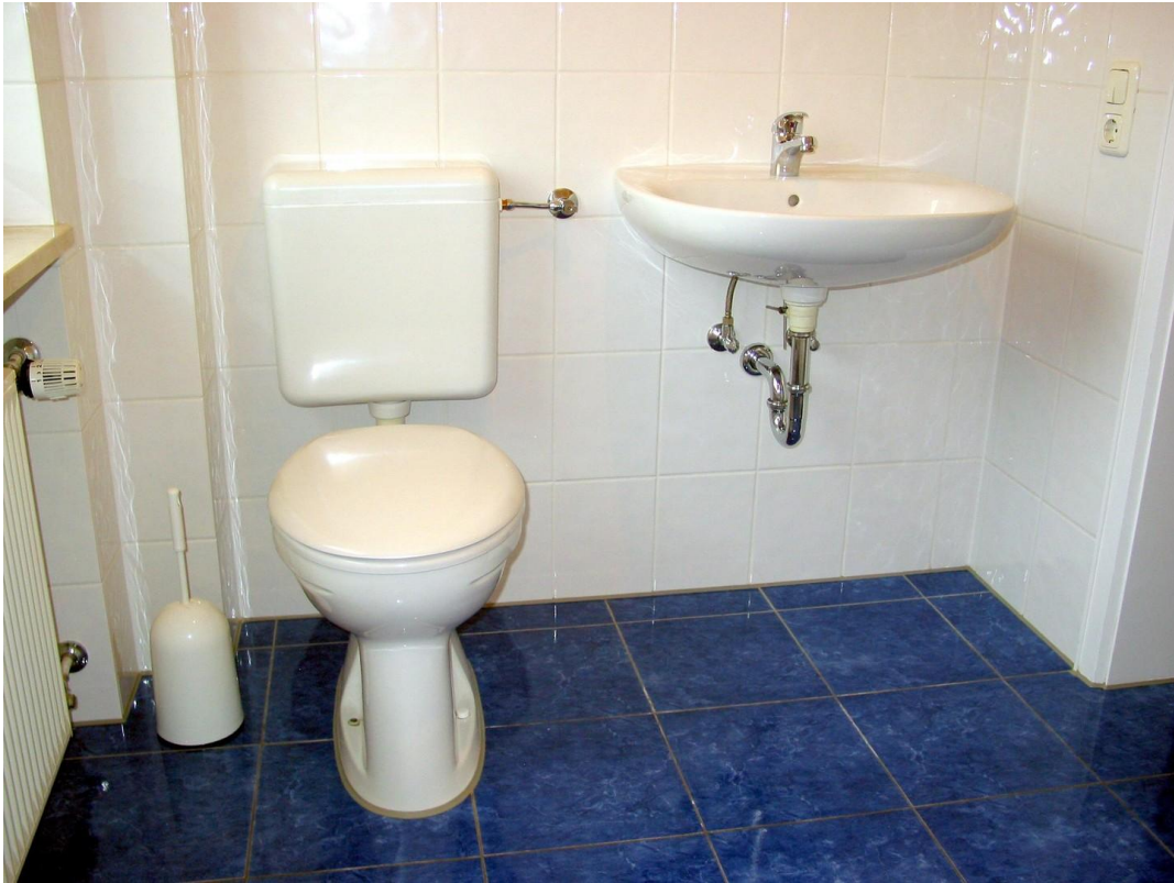
OG Bad 01