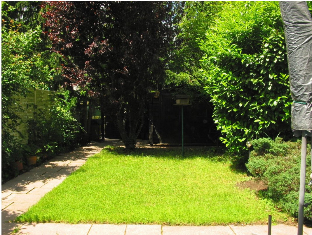
EG Blick in Garten