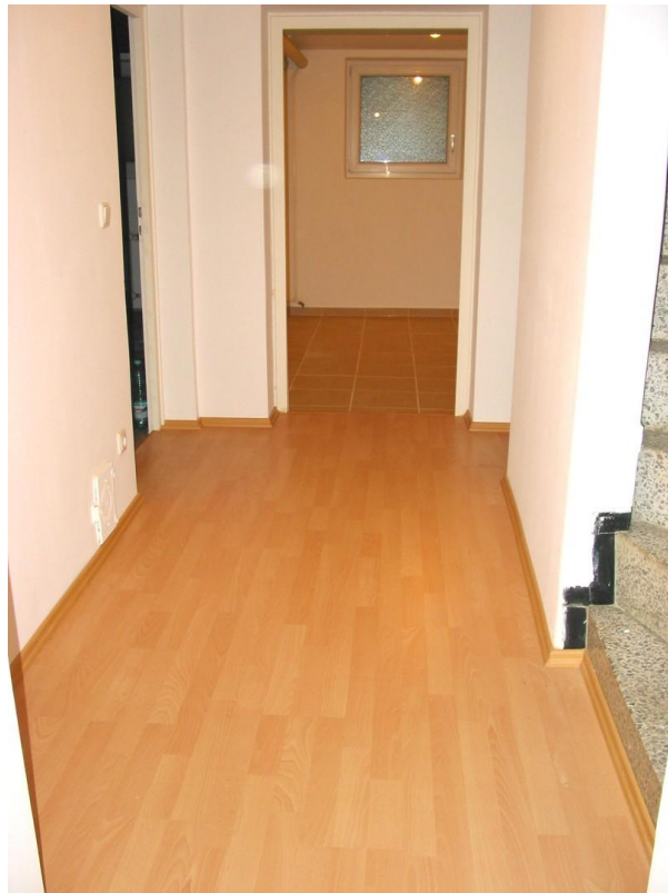
KE Flur und Waschraum