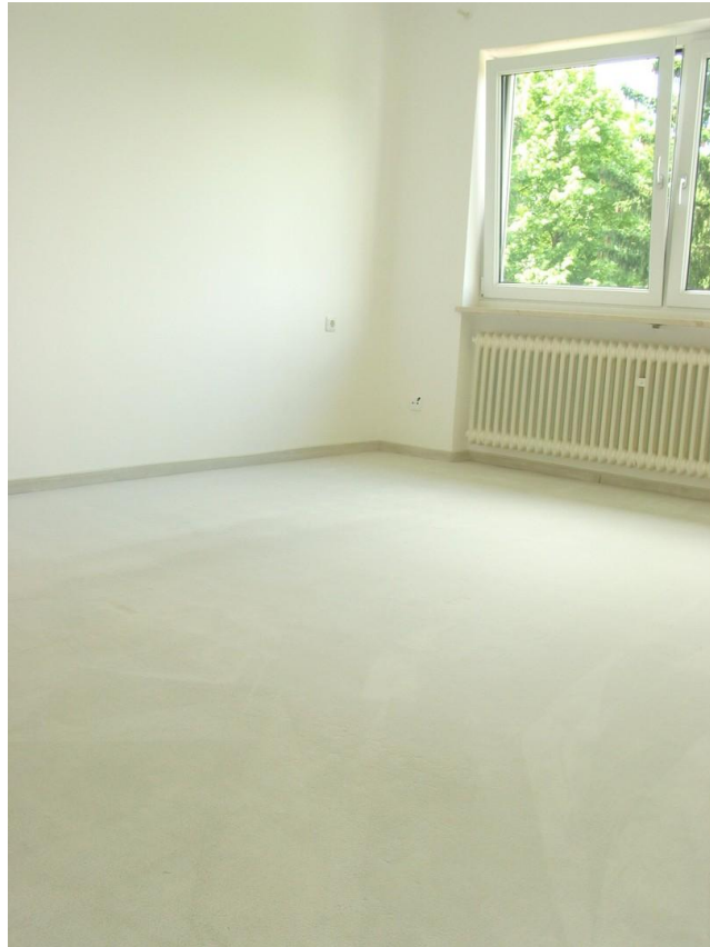
OG Schlafzimmer Eltern