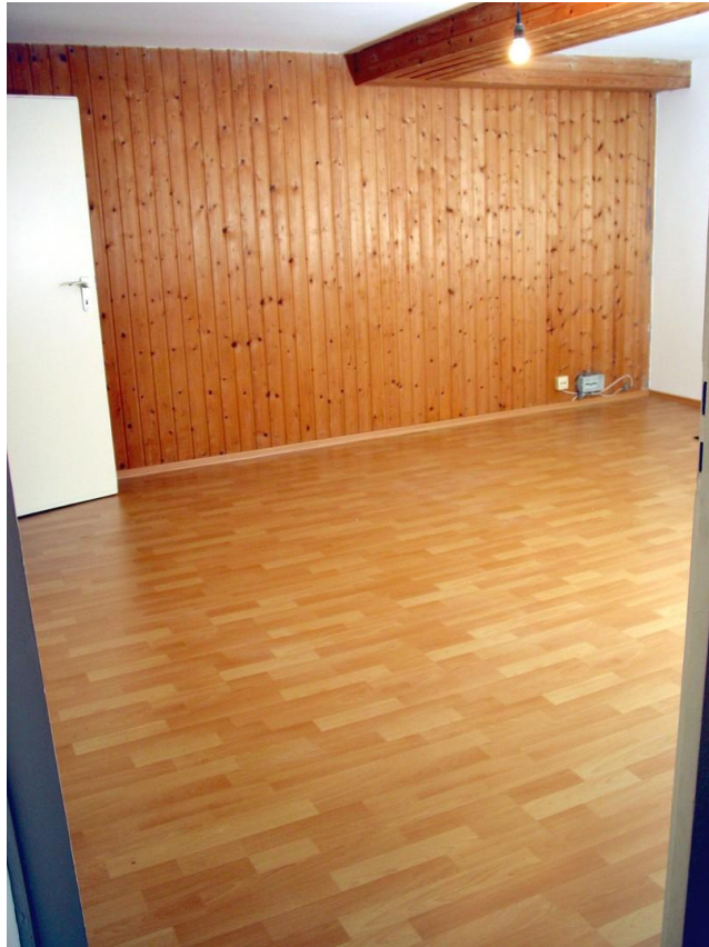
KE grosser Raum