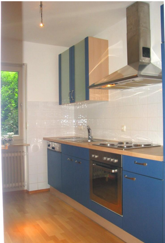
EG Küchenzeile rechts