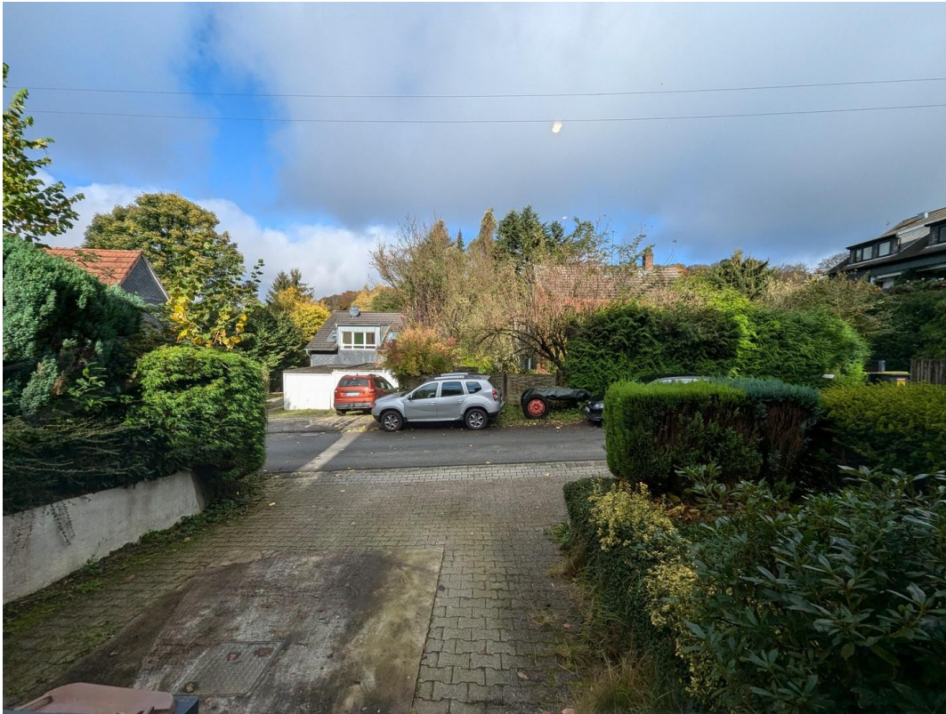
Blick ins Grüne