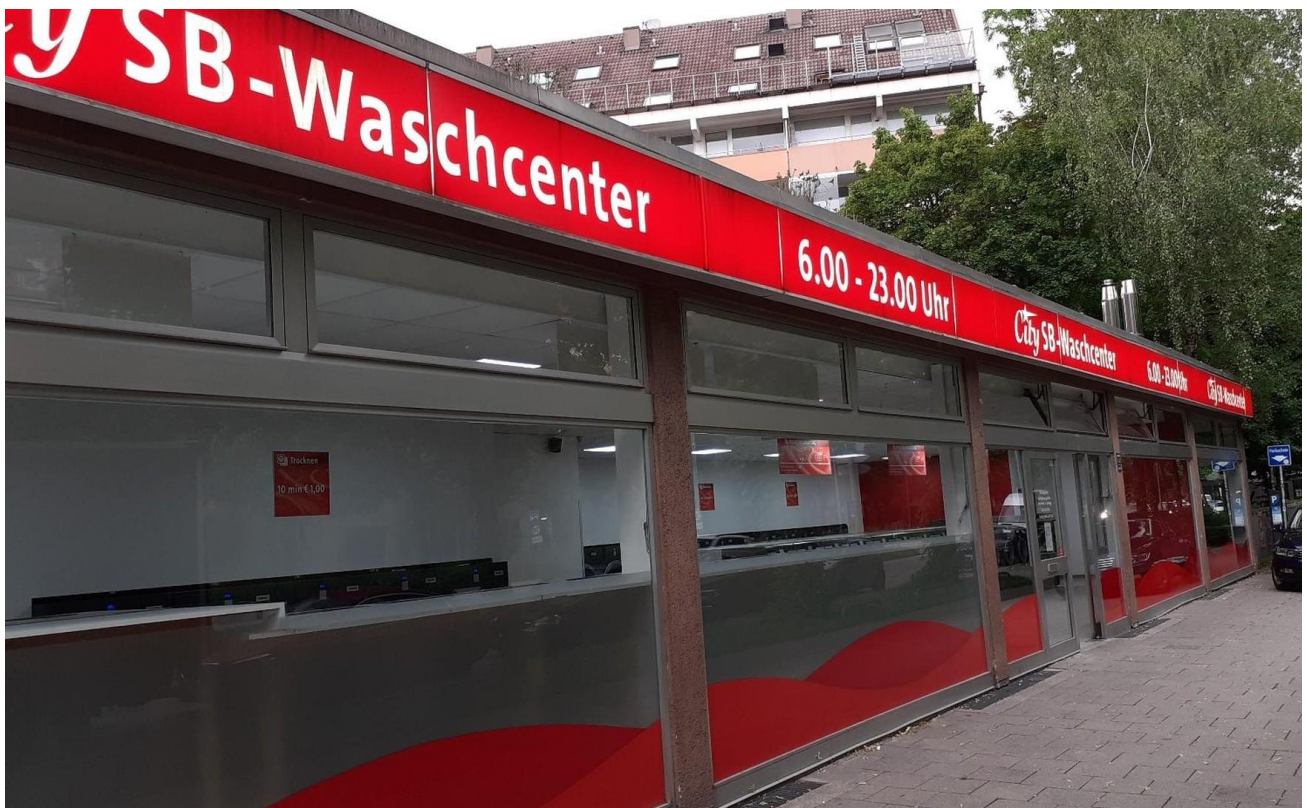
Waschsaloon vor dem Haus