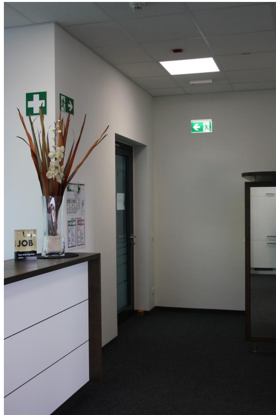
Blick auf Büroeingang