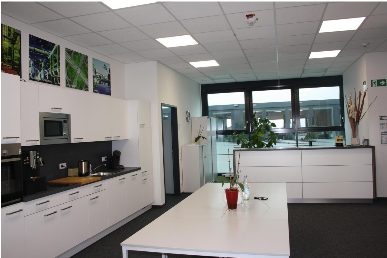
Empfang mit offener Zone zur K