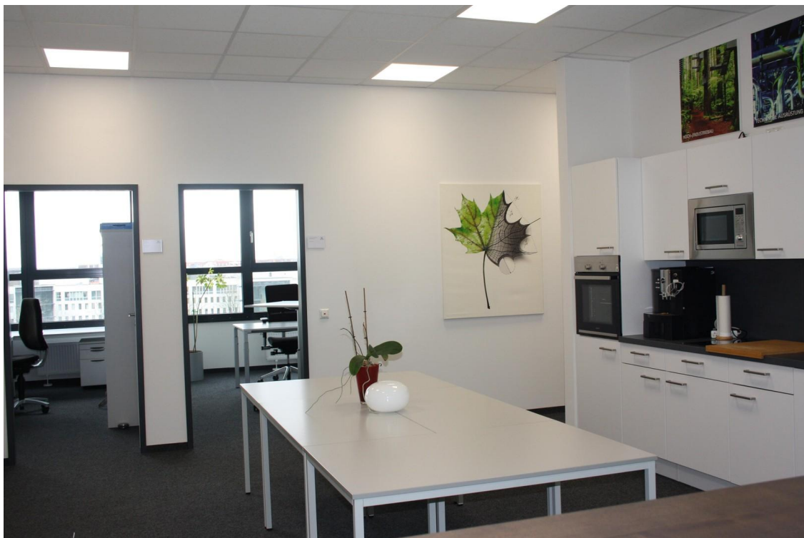
Blick zu den Büros