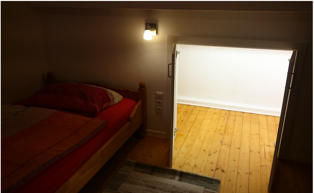
Hauptwohnung OG Zimmer 3e