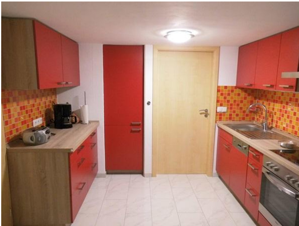
Souterrain Küche 1b