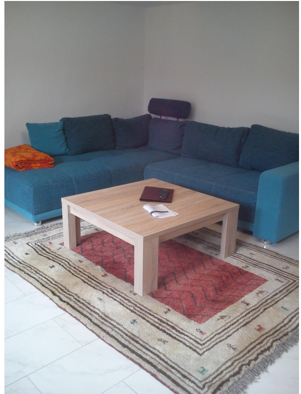
Souterrain Wohnzimmer 1c