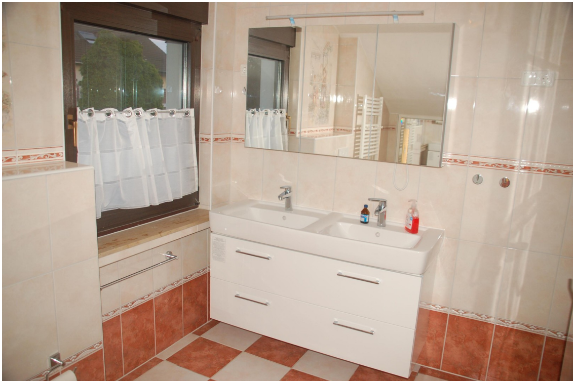
Hauptwohnung Bad 1c