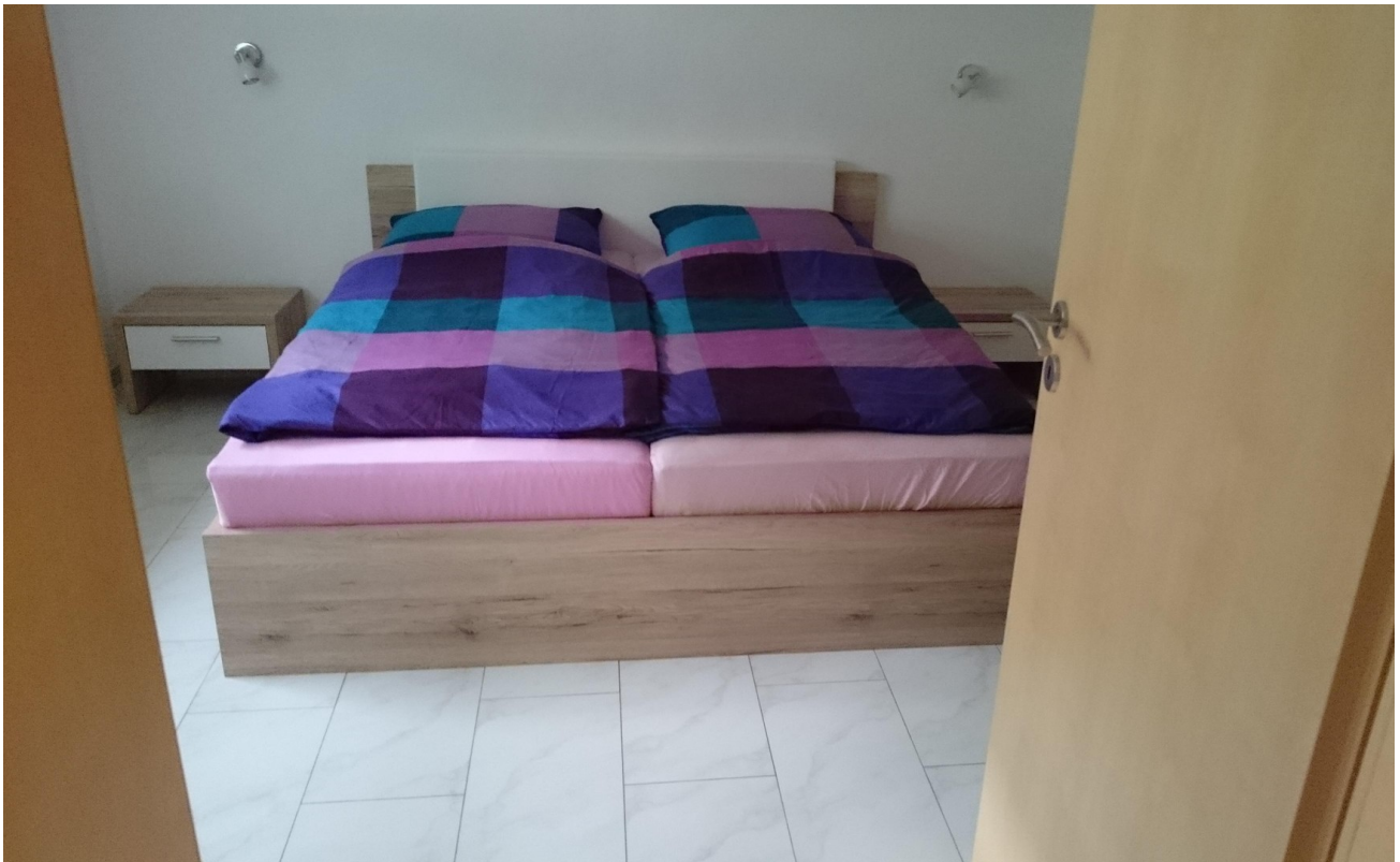
Souterrain Schlafzimmer 2a