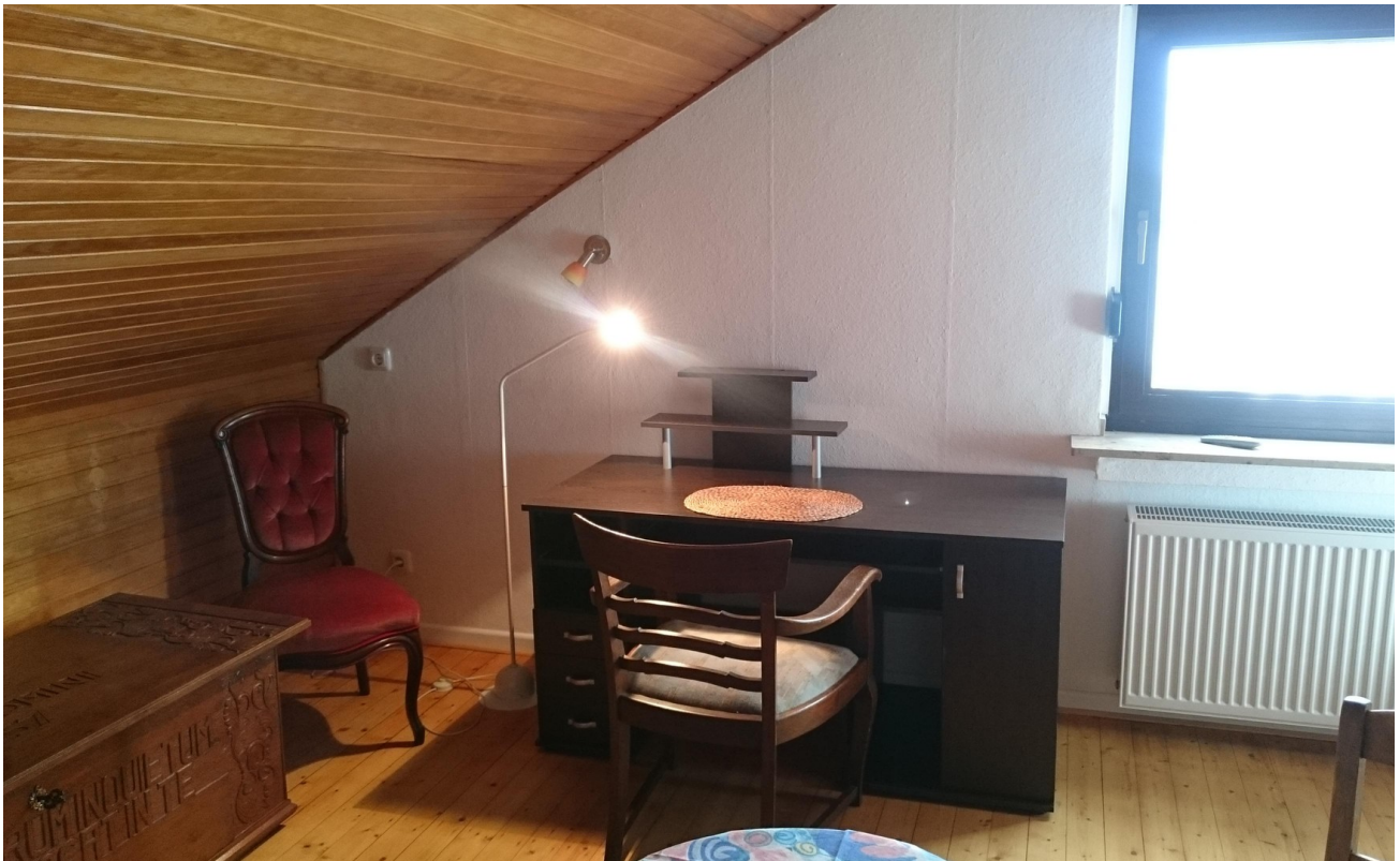
Hauptwohnung OG Zimmer 2c