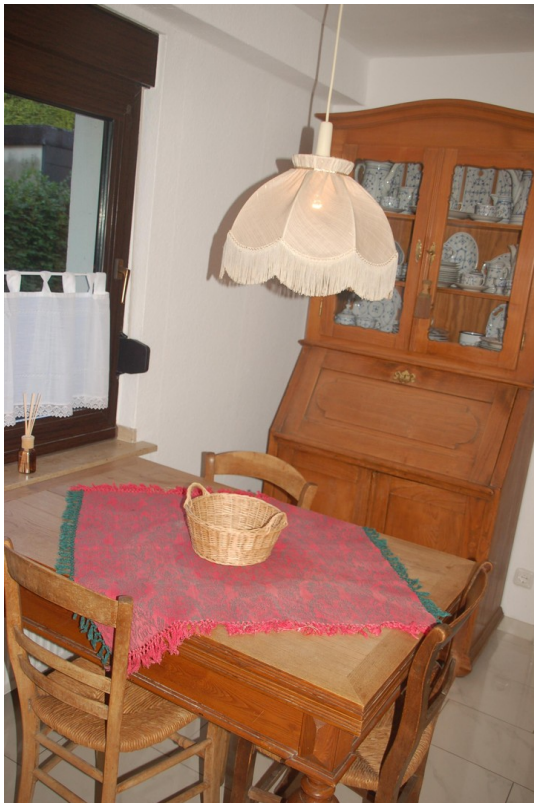
Hauptwohnung Küche 1c