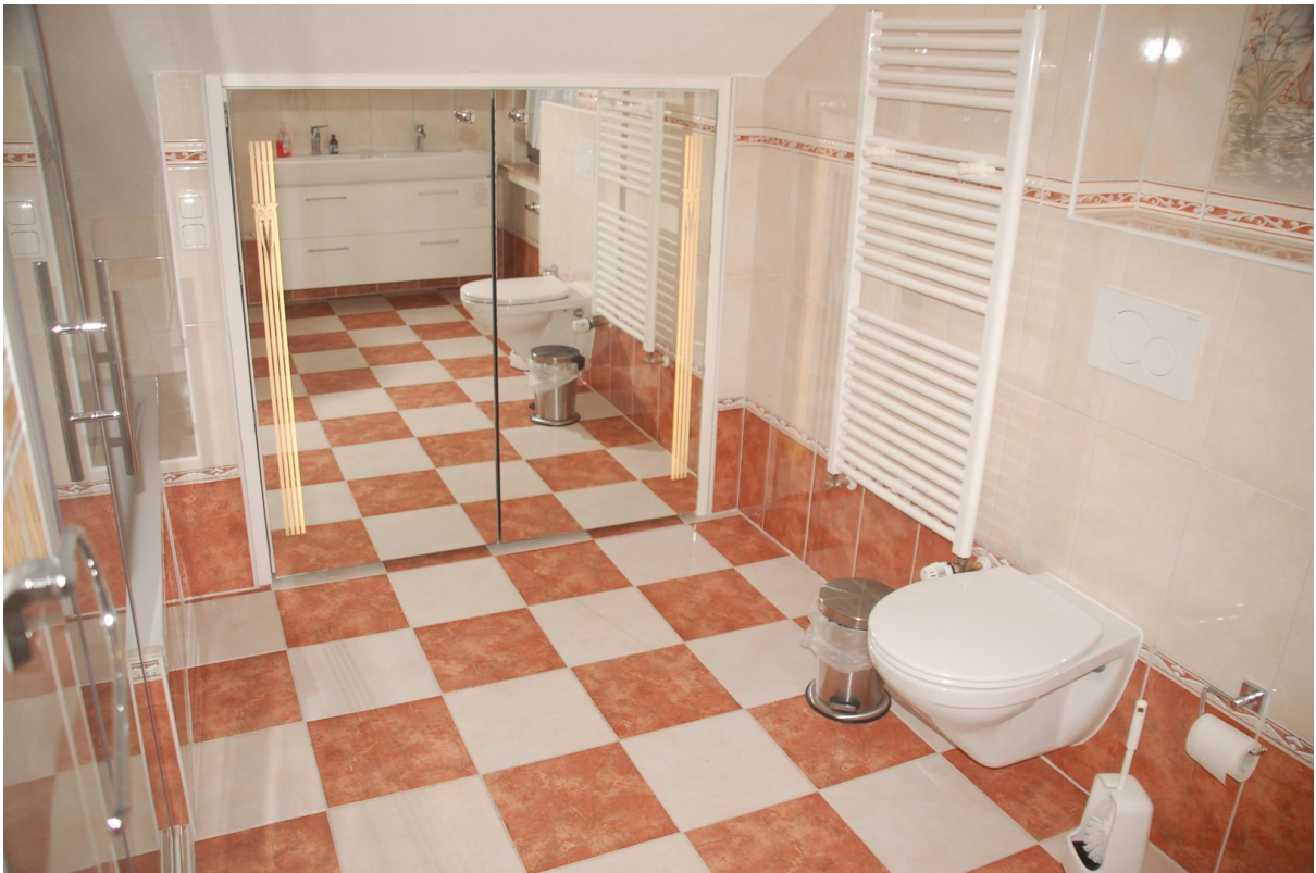
Hauptwohnung Bad 1b