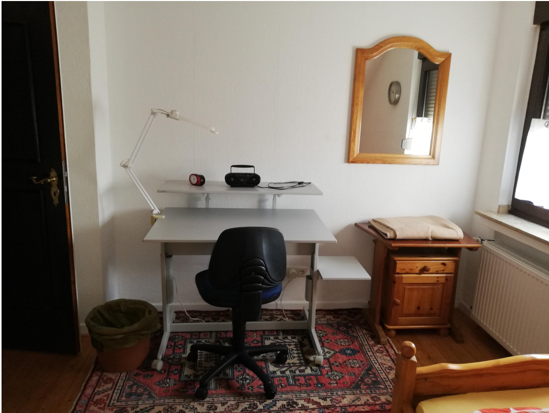
Hauptwohnung OG Zimmer 3d