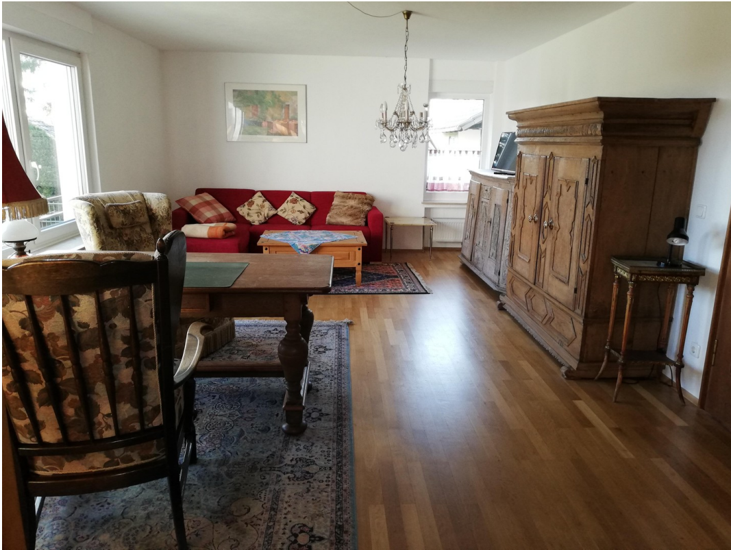
Hauptwohnung Wohnzimmer 1b