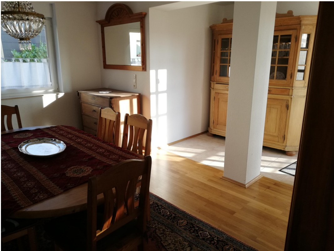
Hauptwohnung Esszimmer 1a