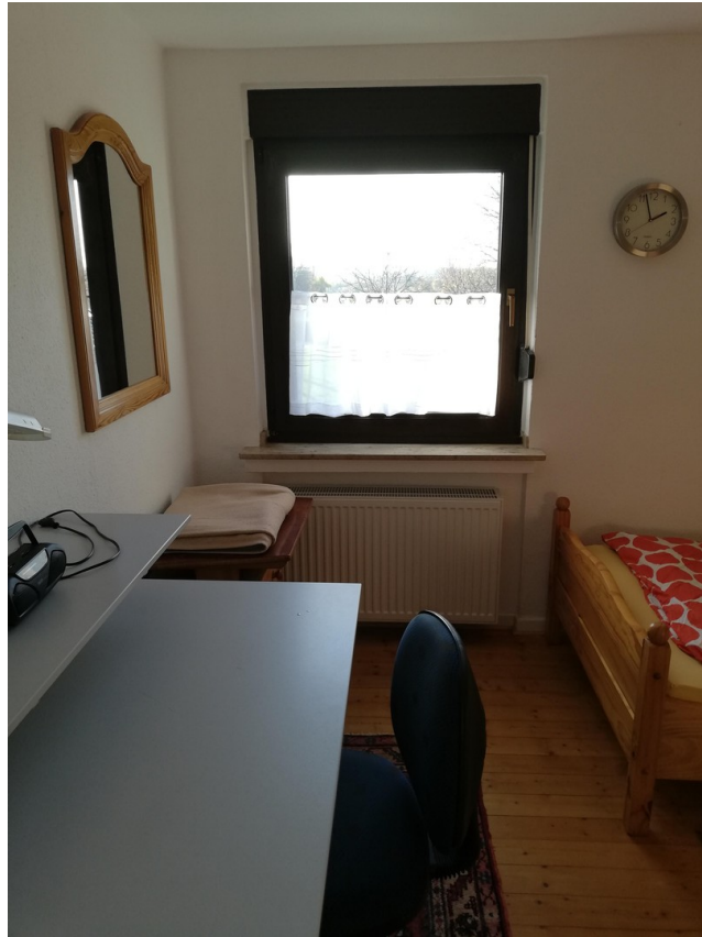
Hauptwohnung OG Zimmer 3b