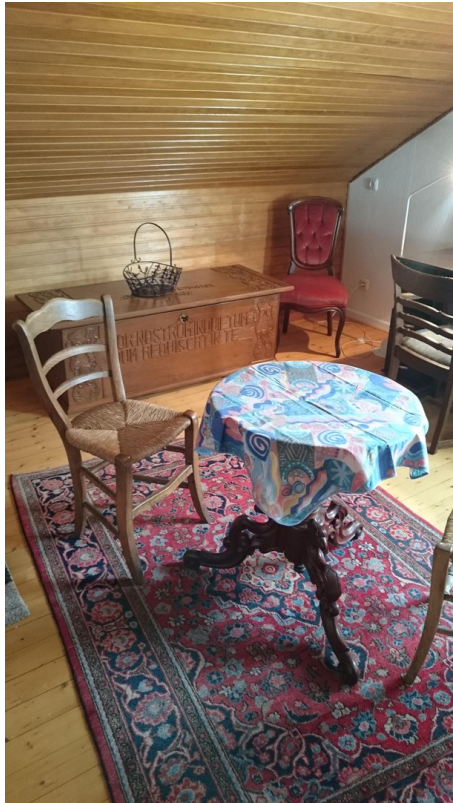
Hauptwohnung OG Zimmer 2a