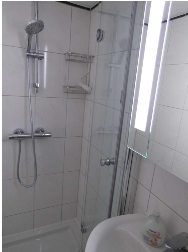
Souterrain 2. Bad