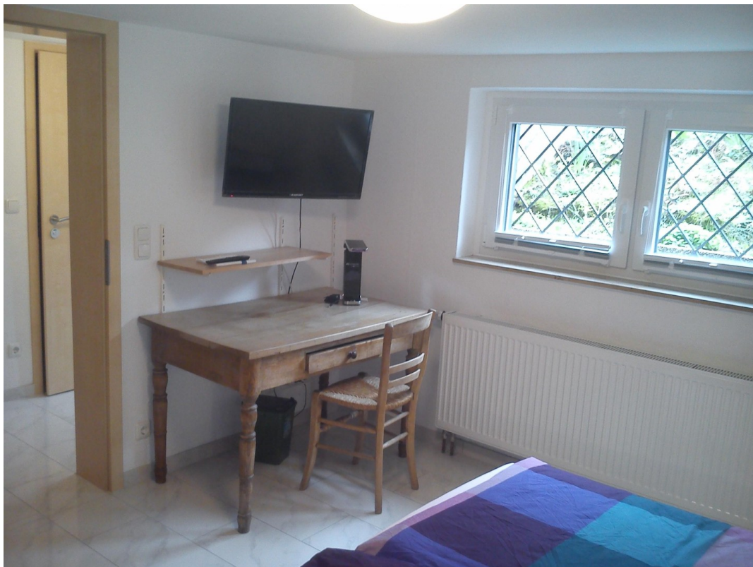
Souterrain Schlafzimmer 2b