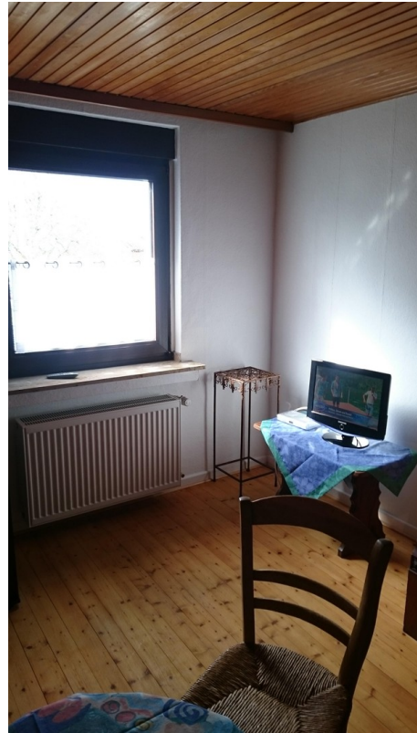
Hauptwohnung OG Zimmer 2b