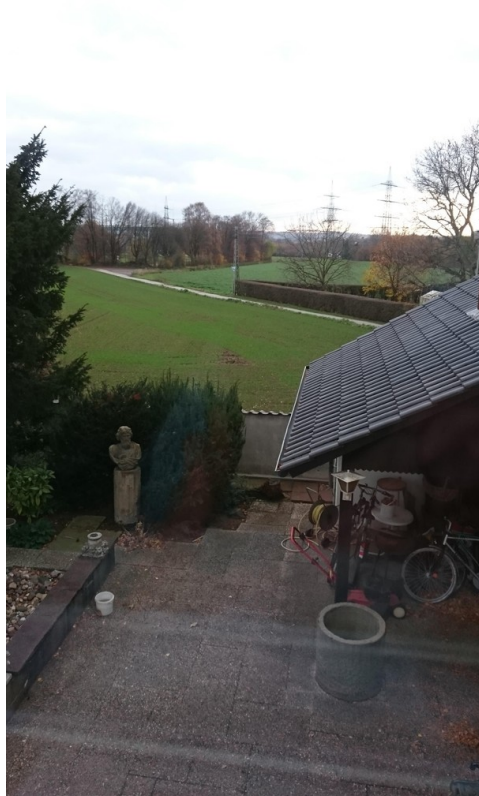
Blick 1. Stock auf das Feld