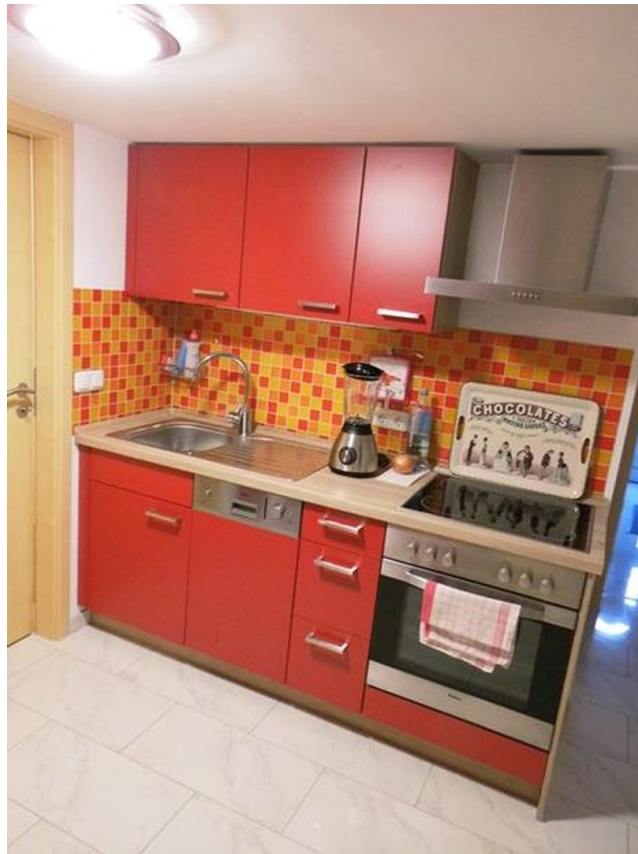
Souterrain Küche 1a