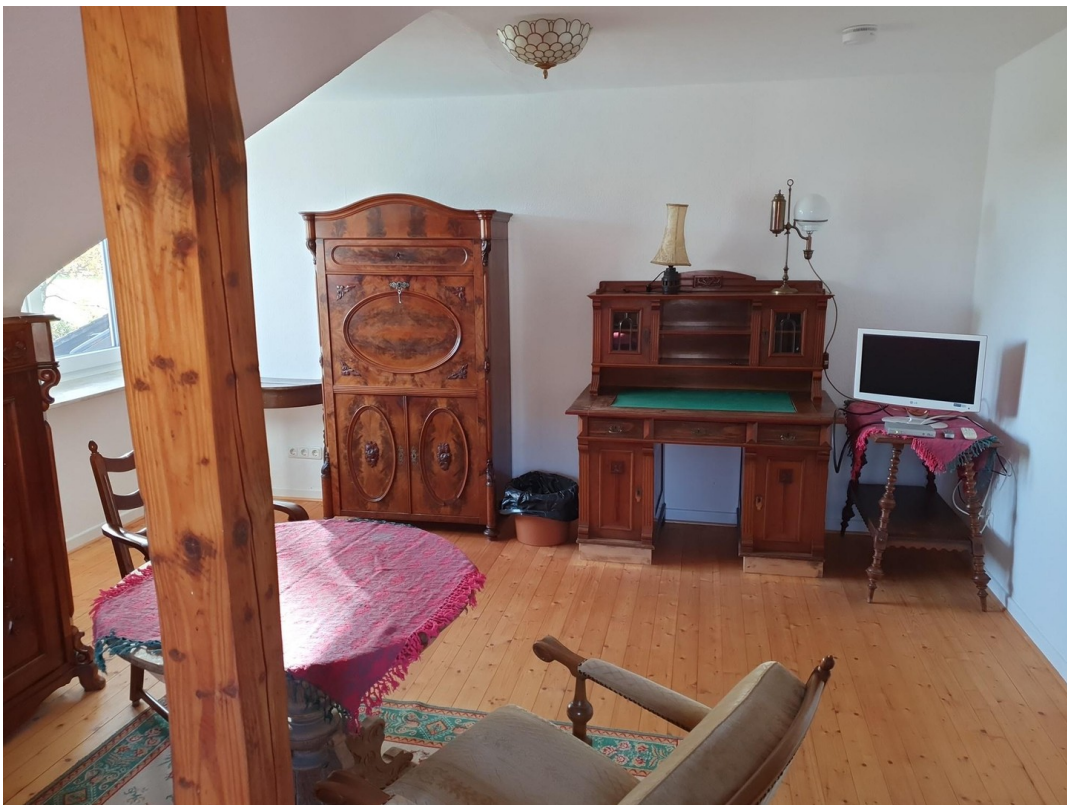
Hauptwohnung OG Zimmer 1a