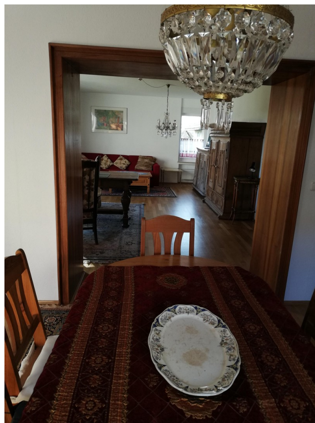
Hauptwohnung Blick Ess-/Wohnz.