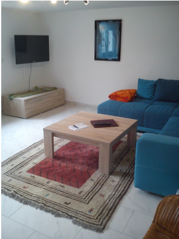
Souterrain Wohnzimmer 1b