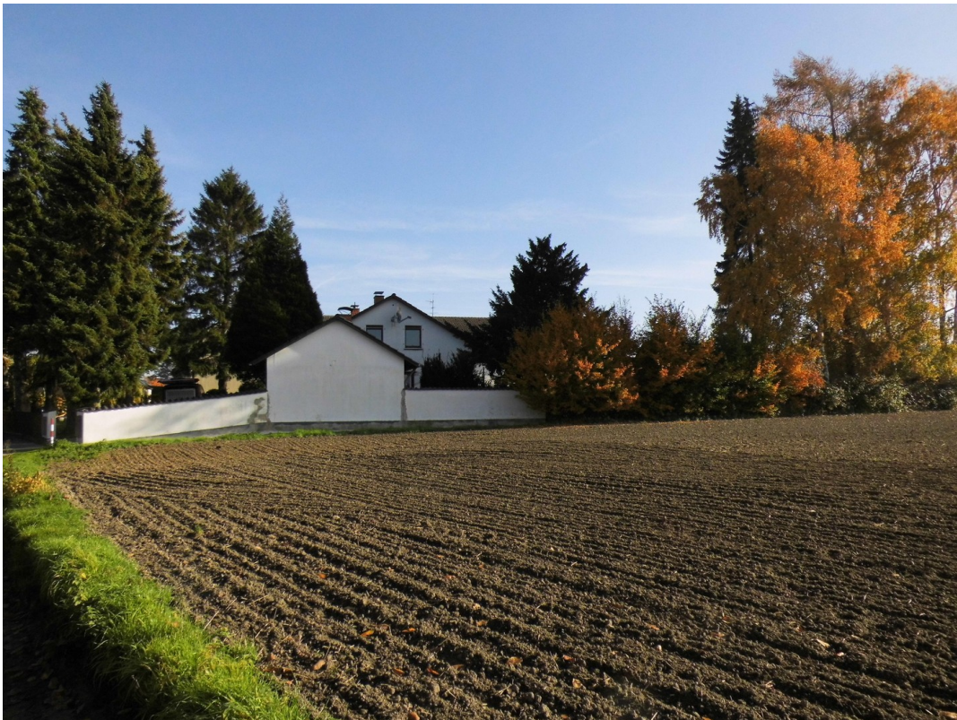
Blick Feldrand auf das Haus