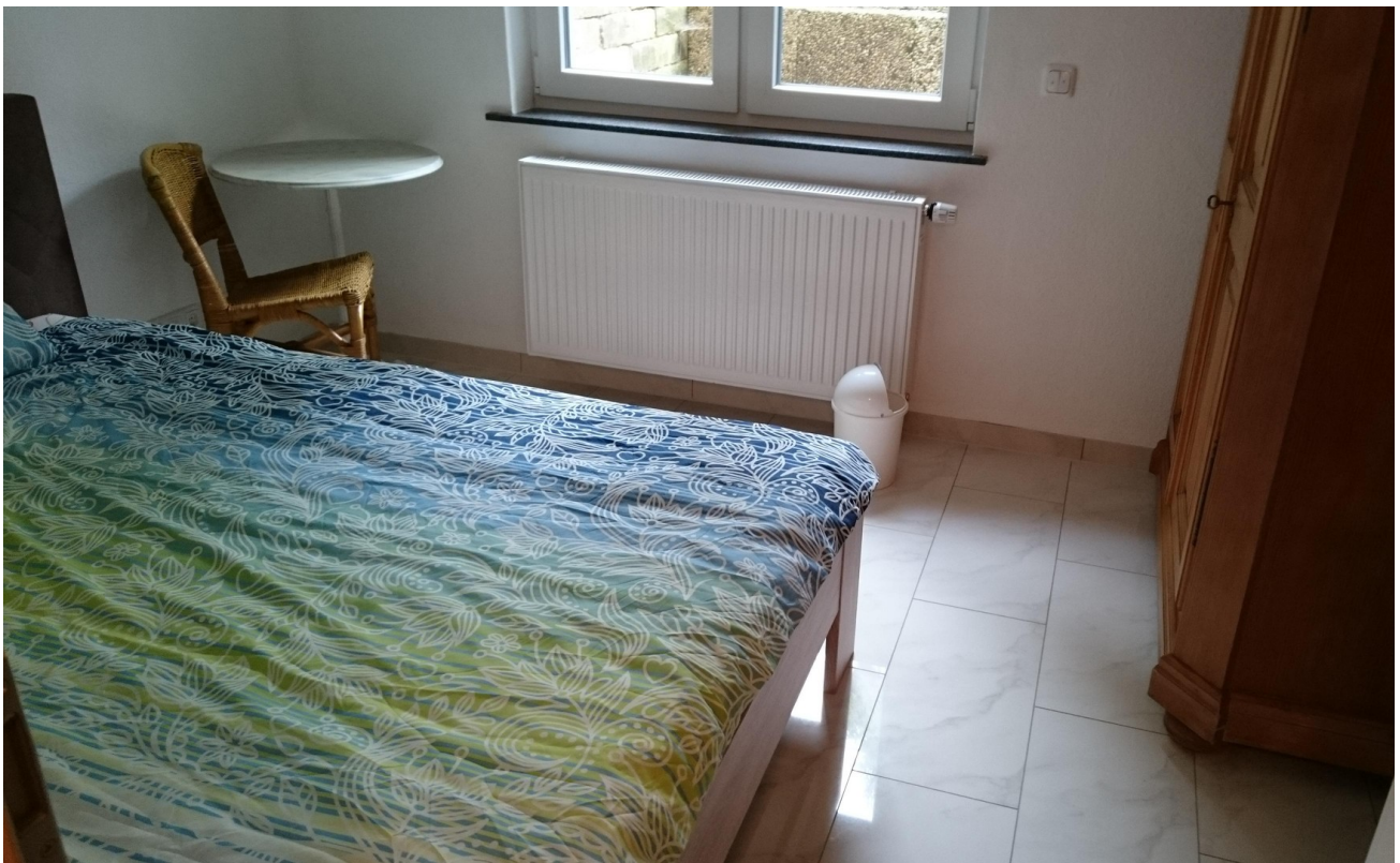
Souterrain Schlafzimmer 1