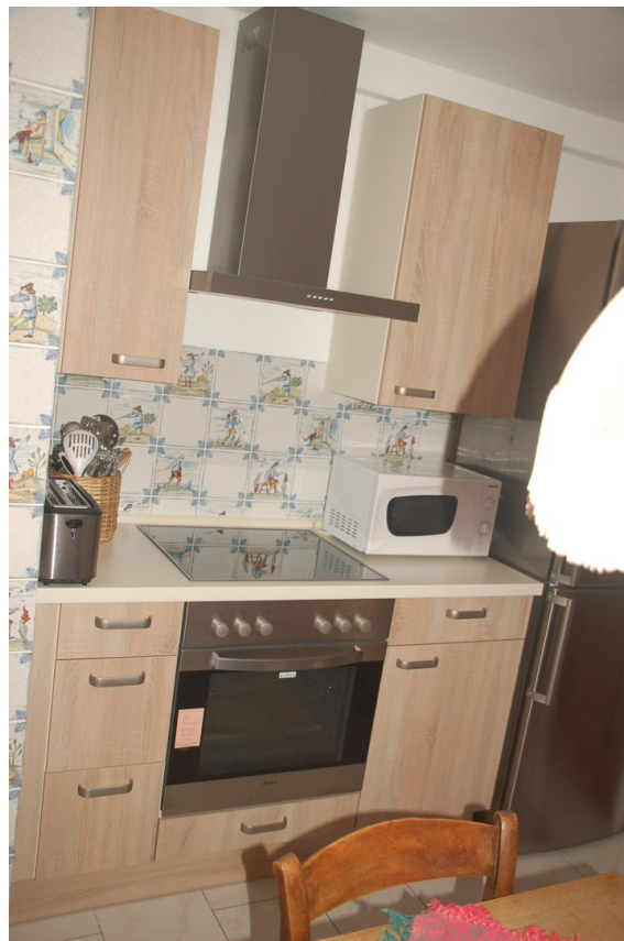
Hauptwohnung Küche 1a