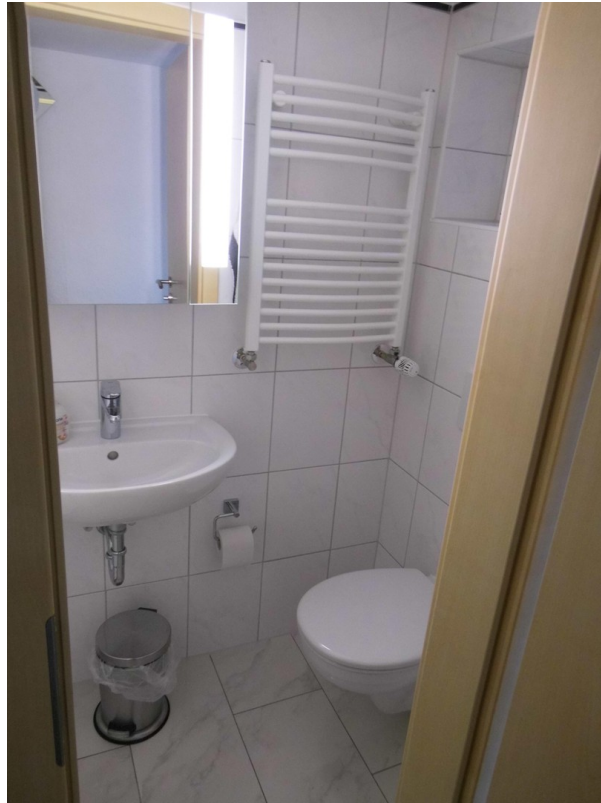
Souterrain 1. Bad