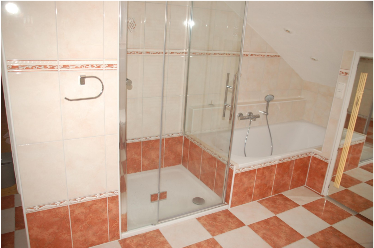
Hauptwohnung Bad 1a