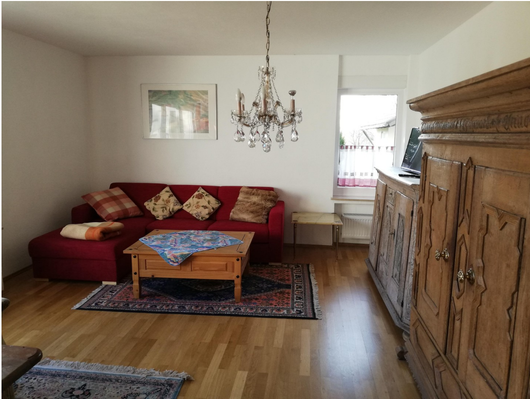
Hauptwohnung Wohnzimmer 1a