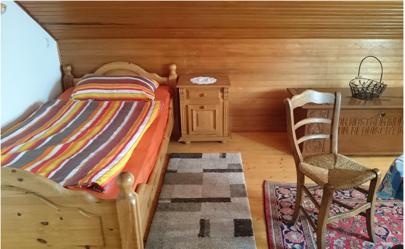
Hauptwohnung OG Zimmer 2d