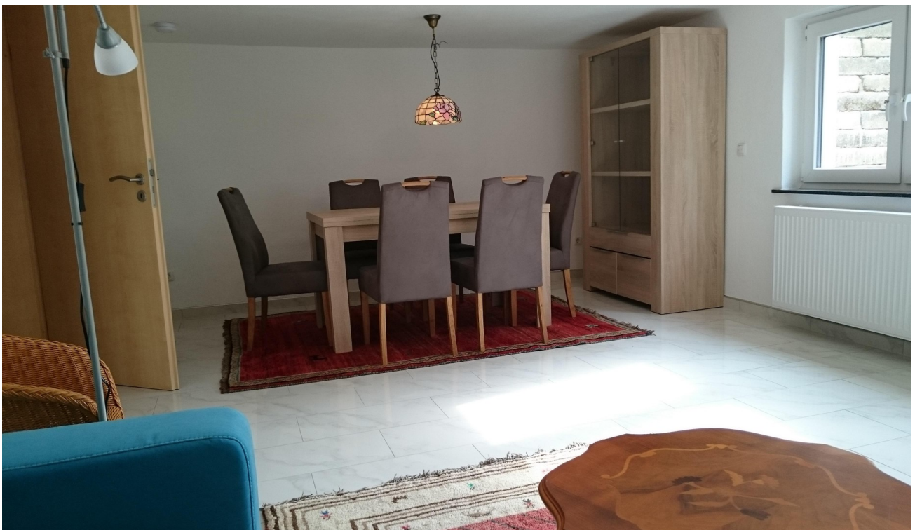
Souterrain Wohnzimmer 1a