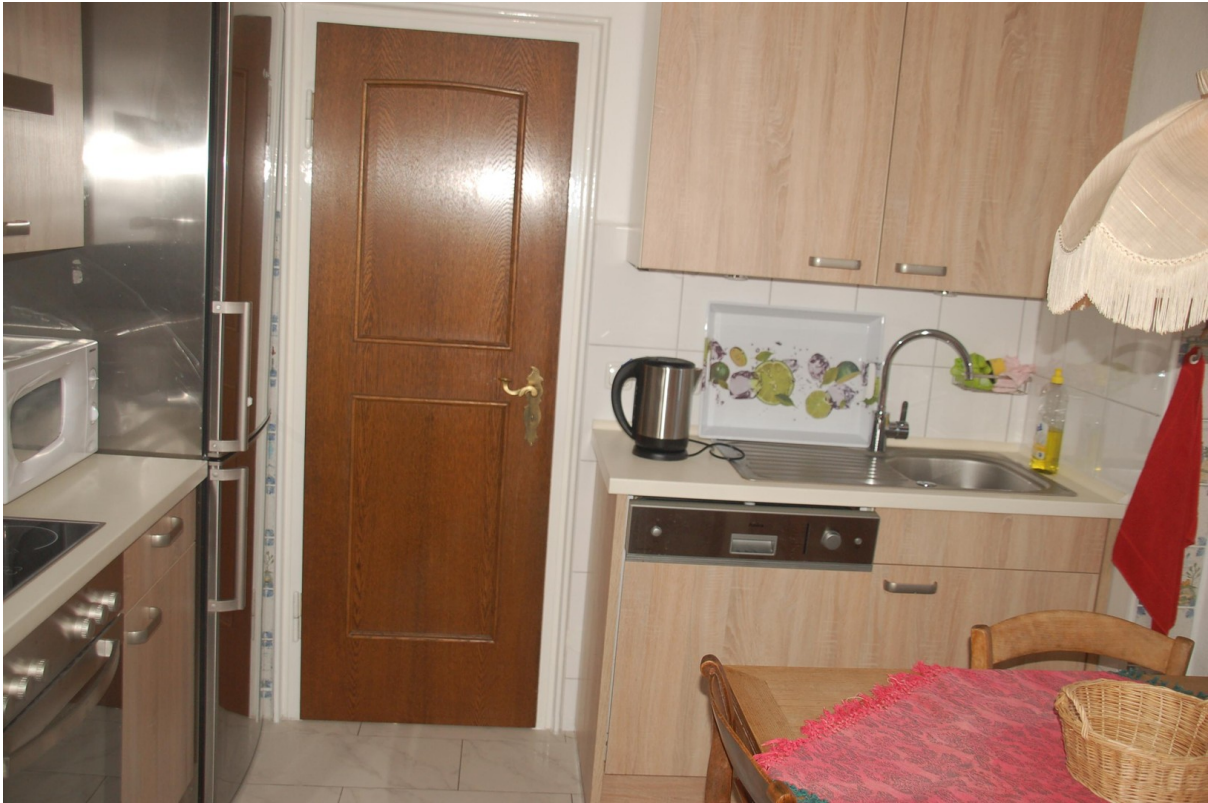
Hauptwohnung Küche 1b