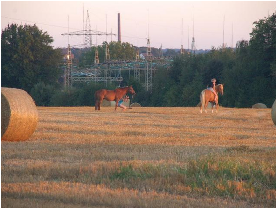
Blick auf das Feld im Sommer