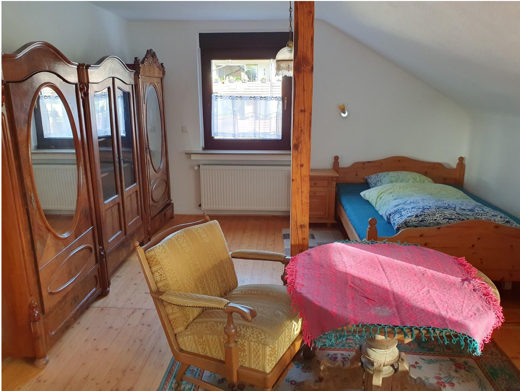
Hauptwohnung OG Zimmer 1b