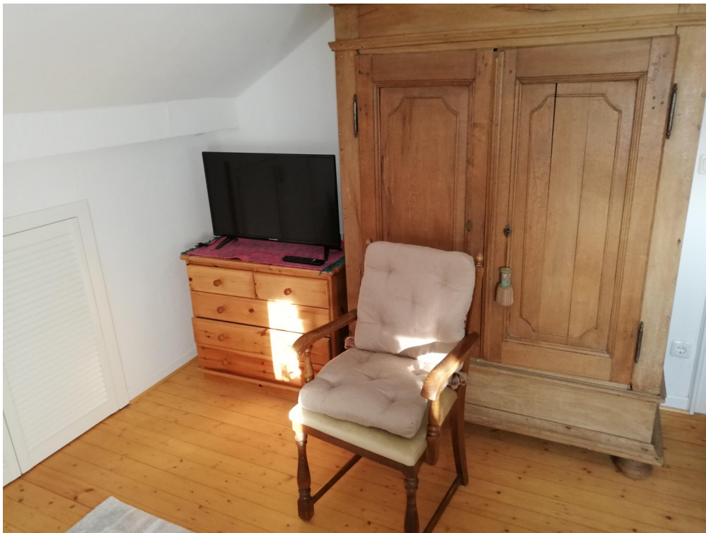
Hauptwohnung OG Zimmer 3c