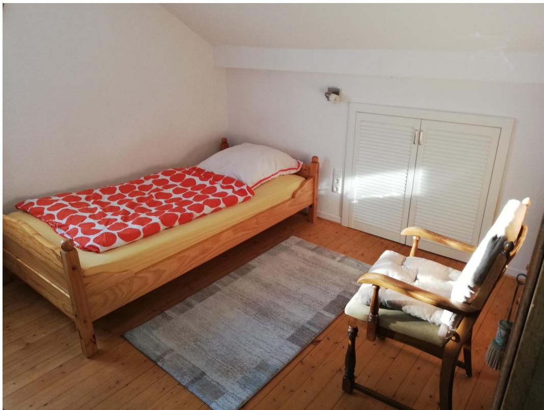
Hauptwohnung OG Zimmer 3a