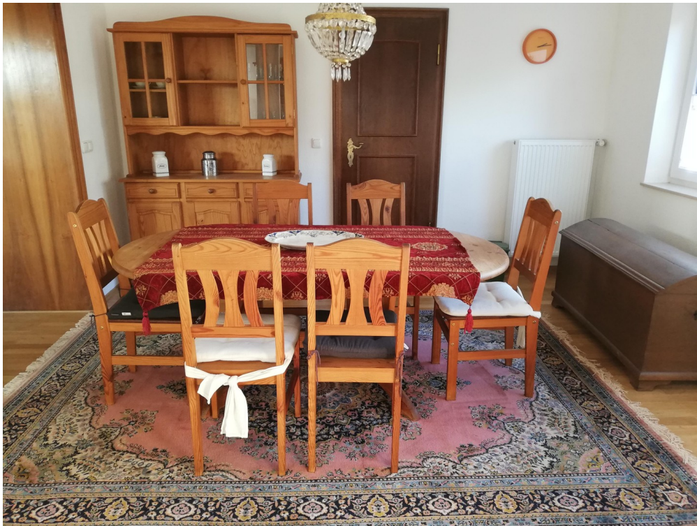
Hauptwohnung Esszimmer 1b