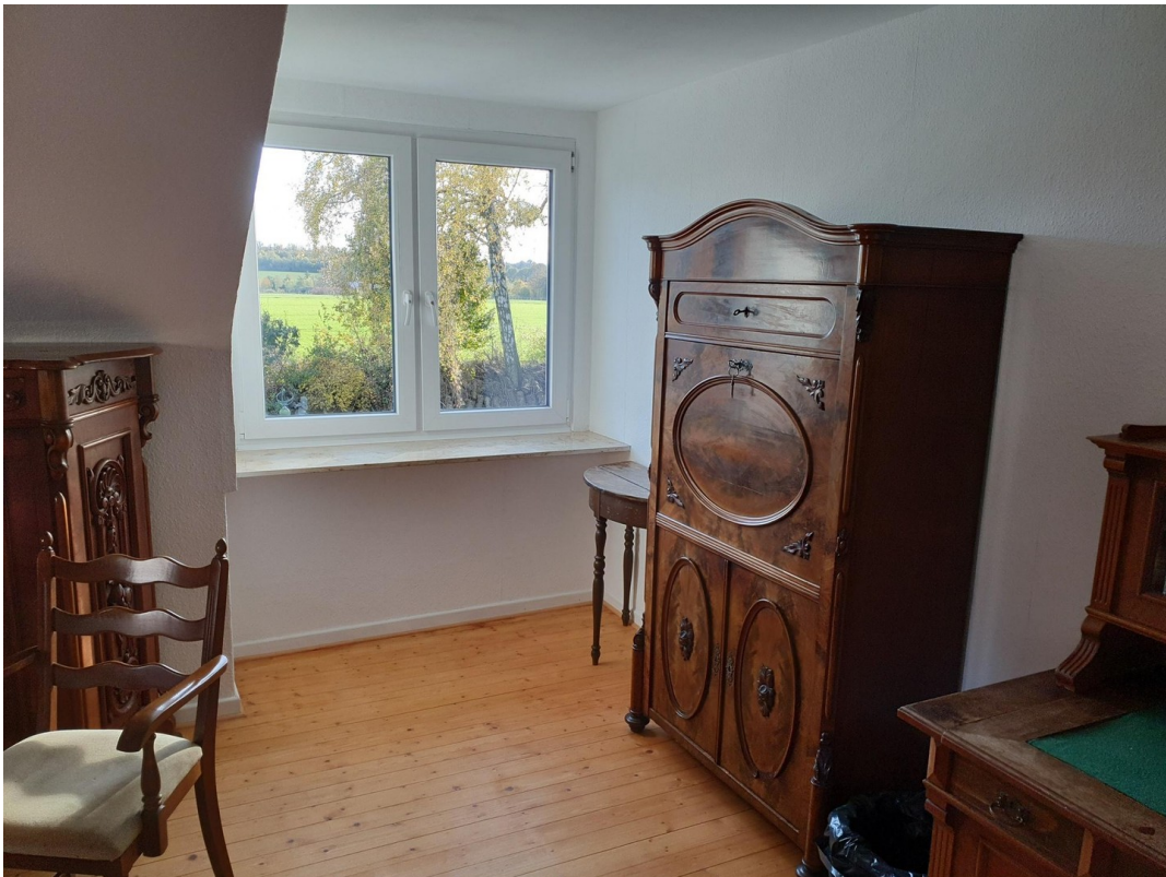
Hauptwohnung OG Zimmer 1c