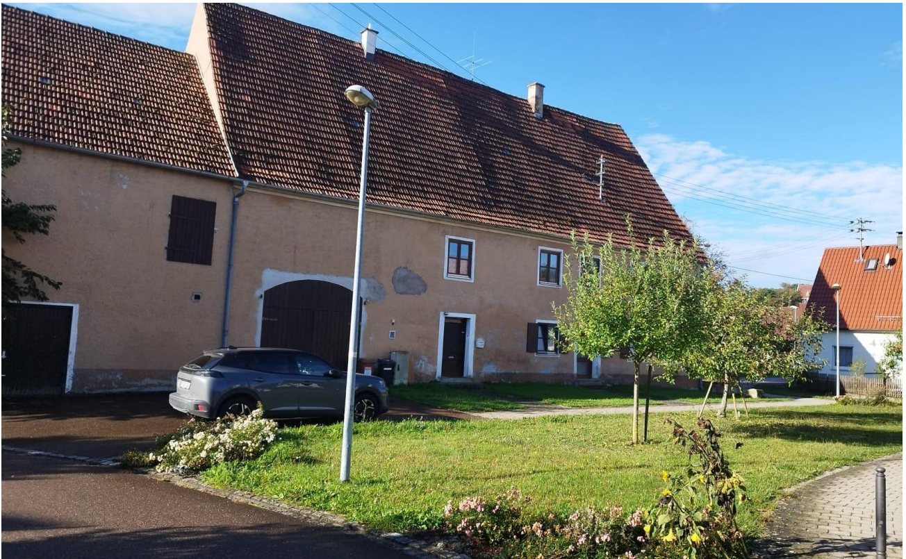
Nord mit Anbau