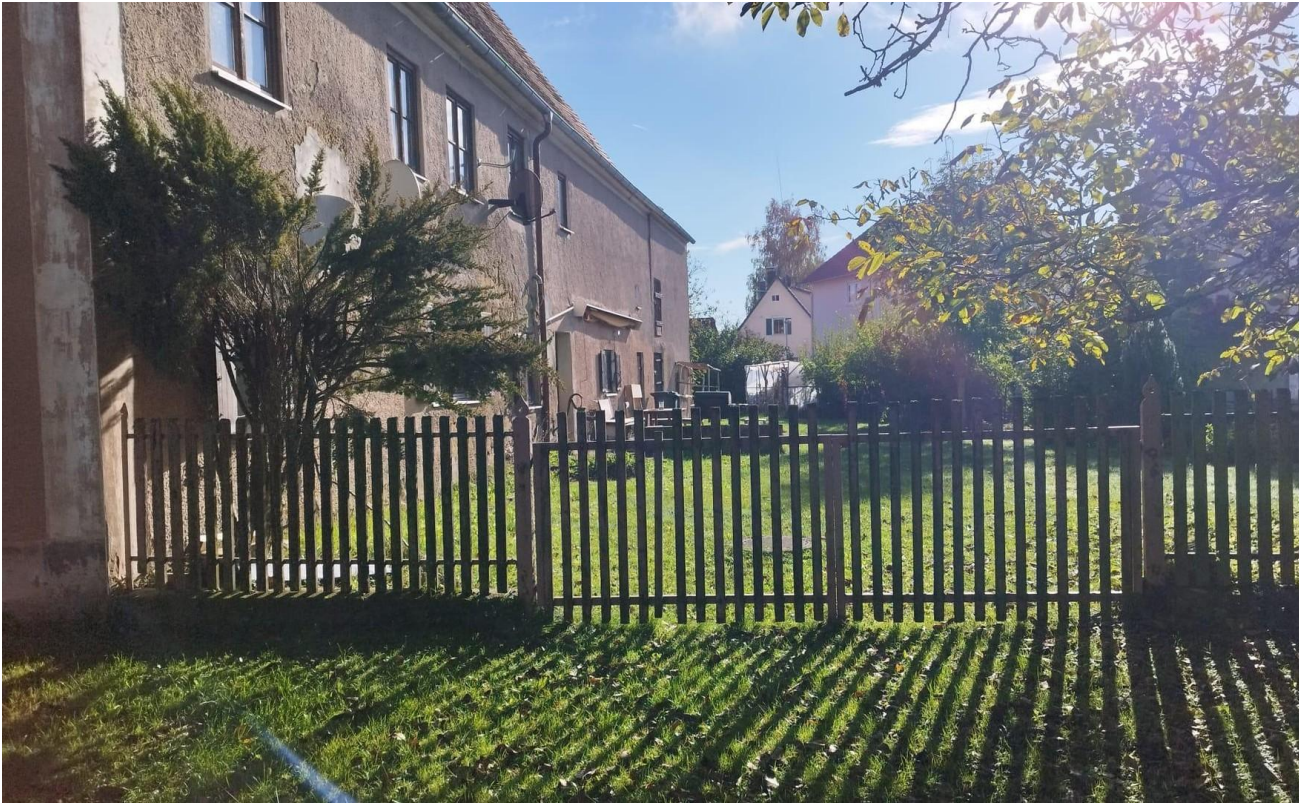
Außereich Süd-West am Bach