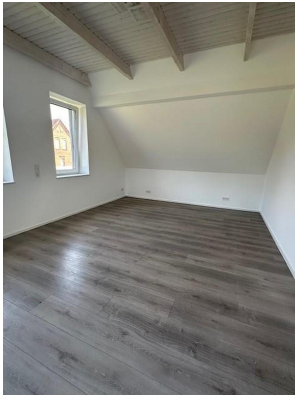
Schlaf 2 OG