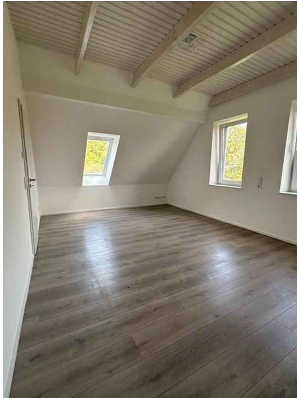
Schlaf 2 OG