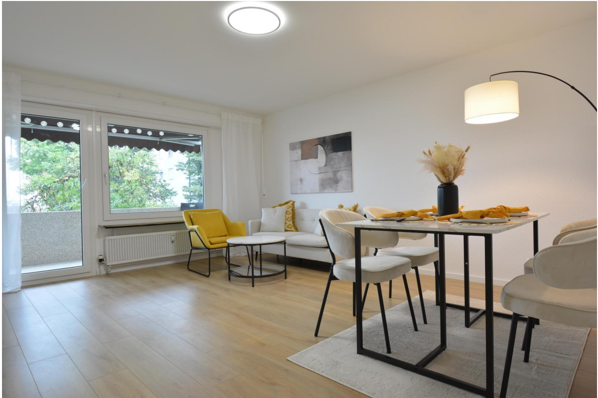
WZ mit Essbereich