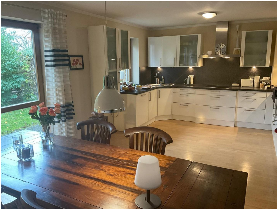
Großzügige Küche mit Esszimmer