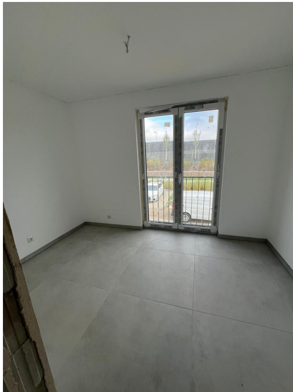
Schlafzimmer 2 / Büro