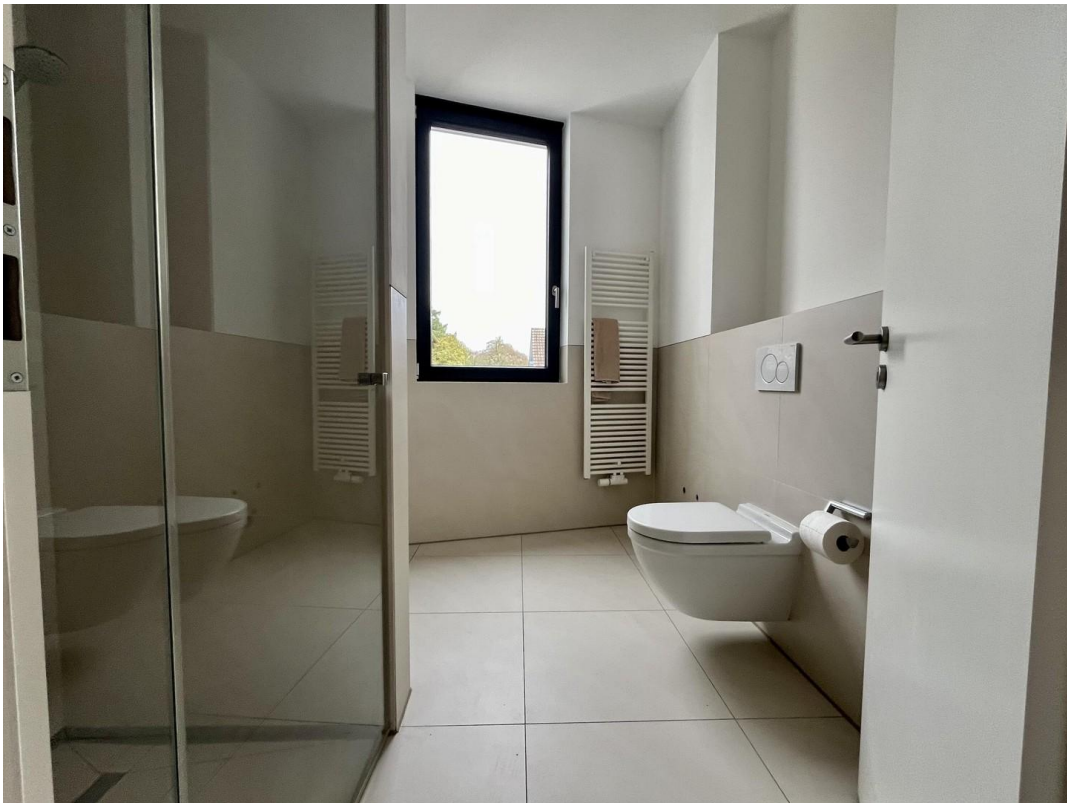
Bad Ansicht 1