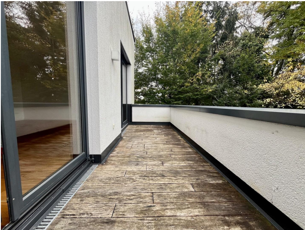
Balkon Ansicht 2