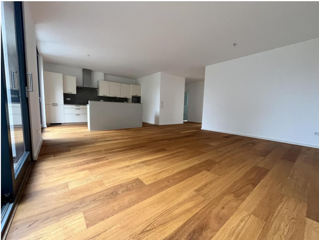
Wohnzimmer Ansicht 1