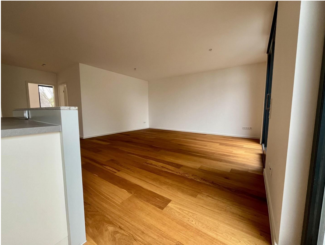
Wohnzimmer Ansicht 2