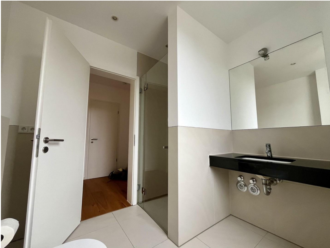
Bad Ansicht 2