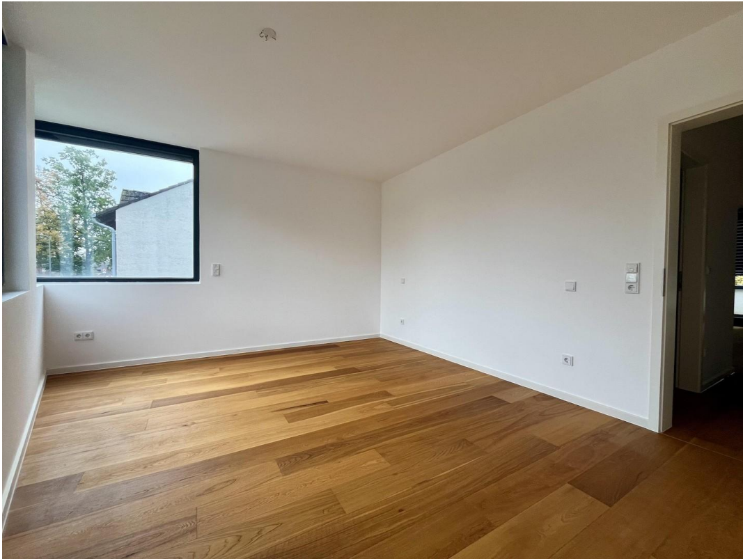
Schlafzimmer Ansicht 1