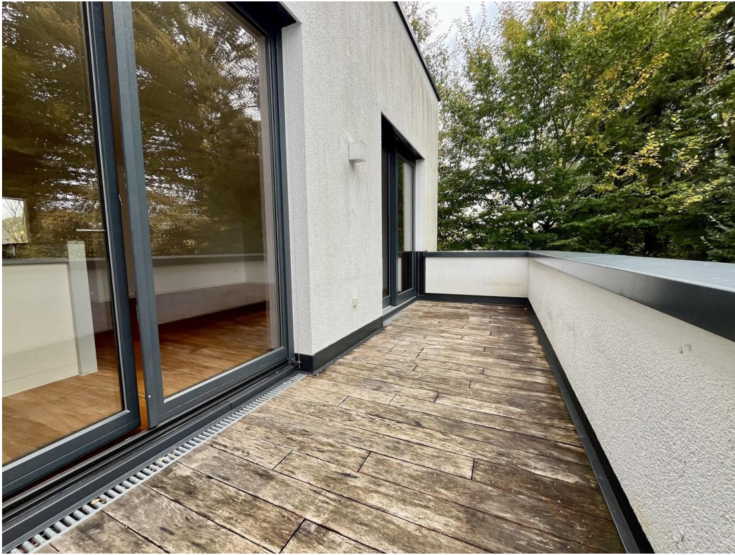
Balkon Ansicht 1