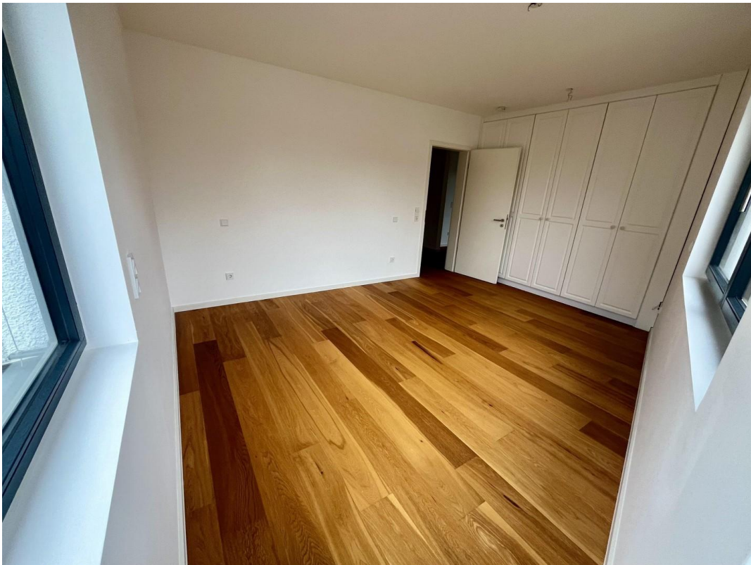
Schlafzimmer Ansicht 2