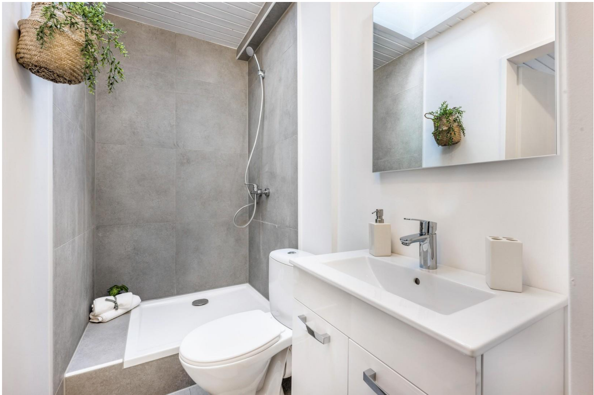
Duschbad im OG