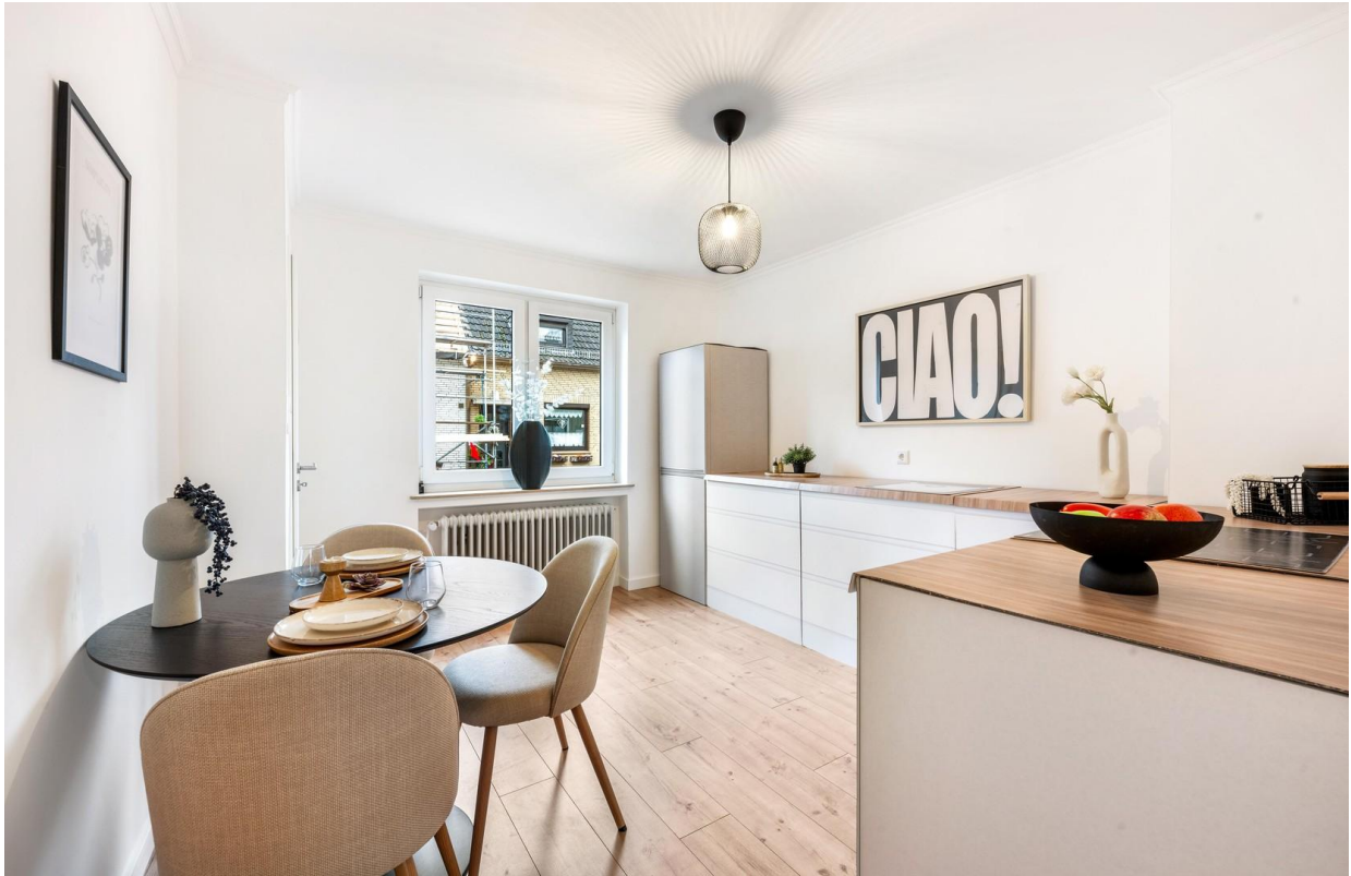
Küche im EG