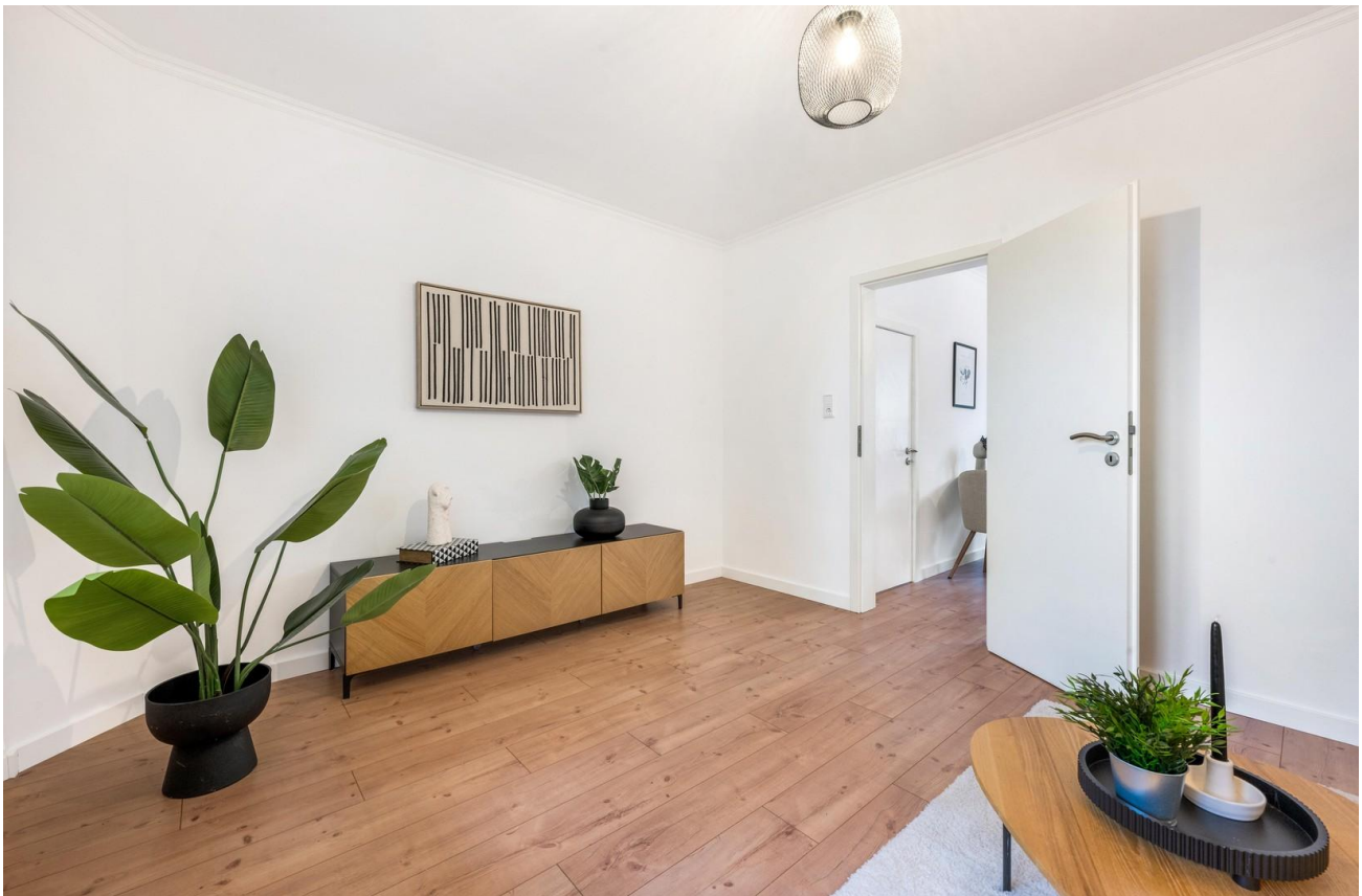
Wohnzimmer im EG