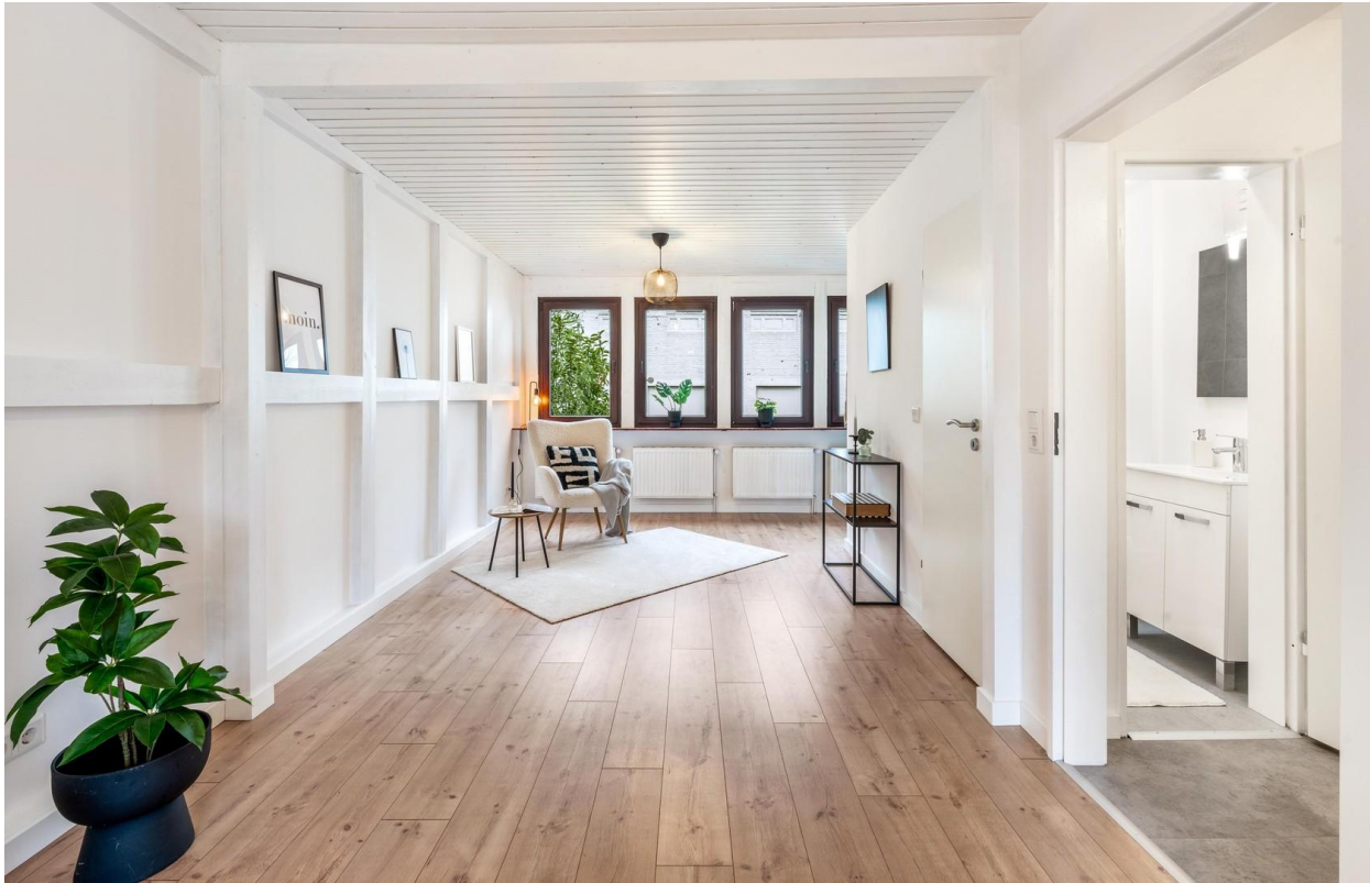
Schlafzimmer im OG