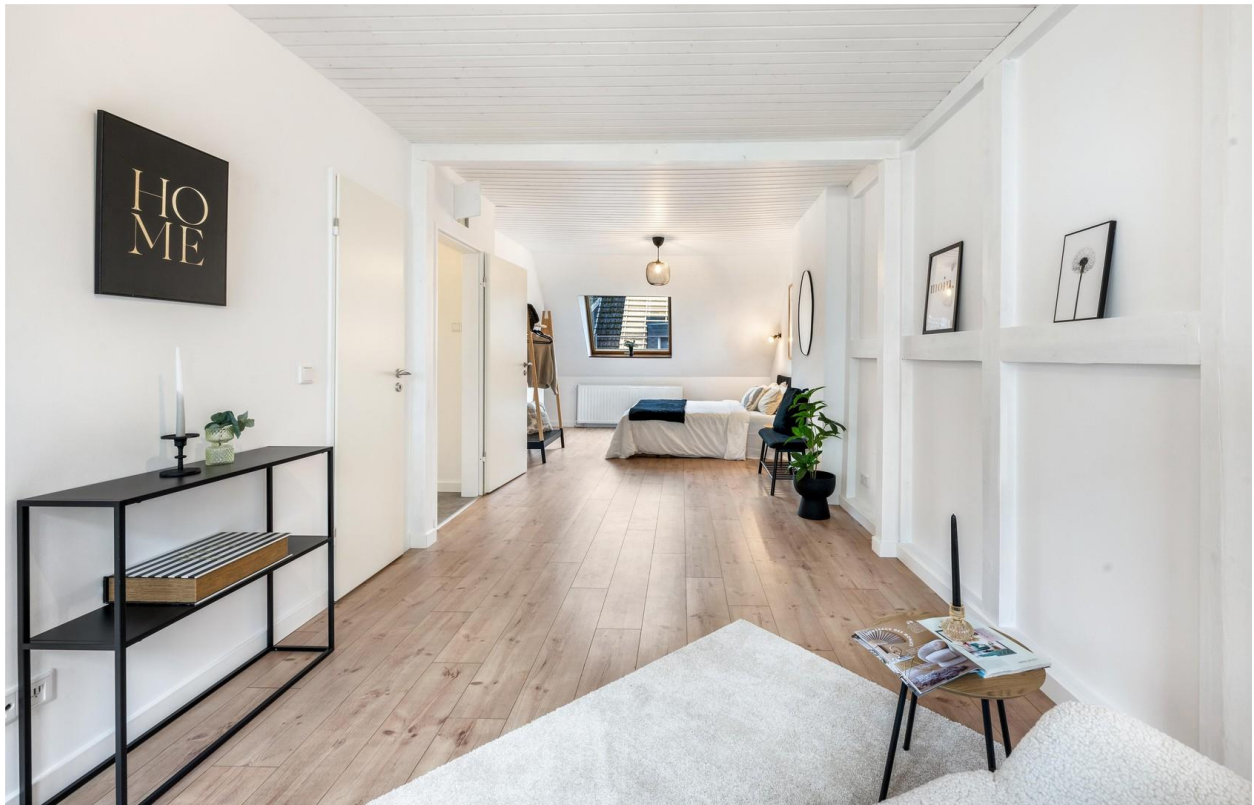
Schlafzimmer im OG