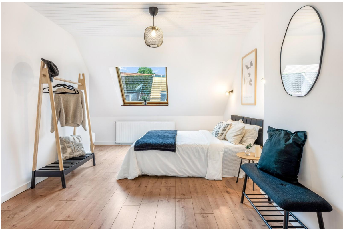
Schlafzimmer im OG