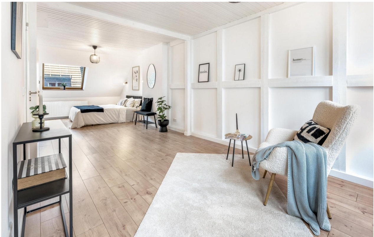
Schlafzimmer im OG