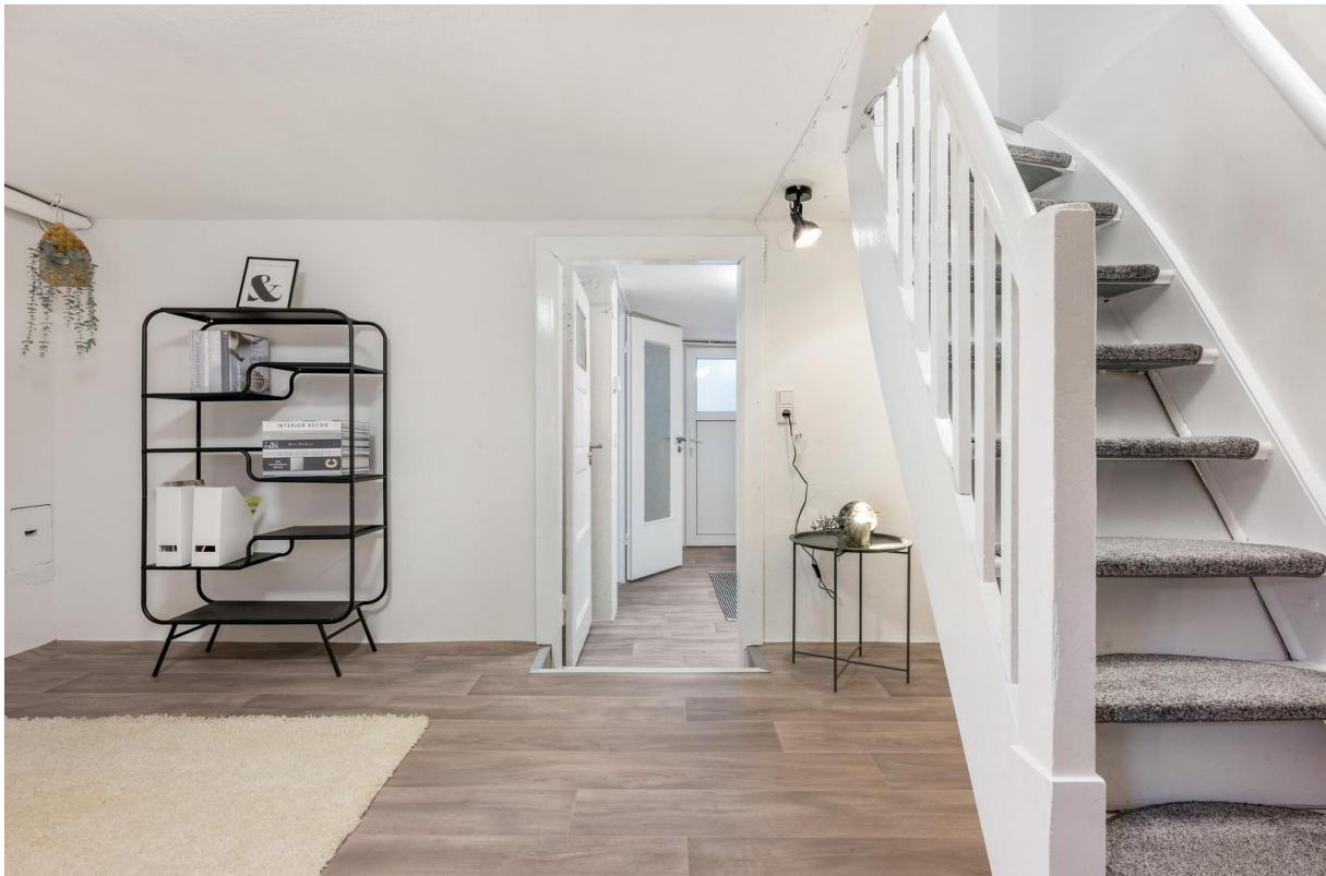
Treppe ins Untergeschoss