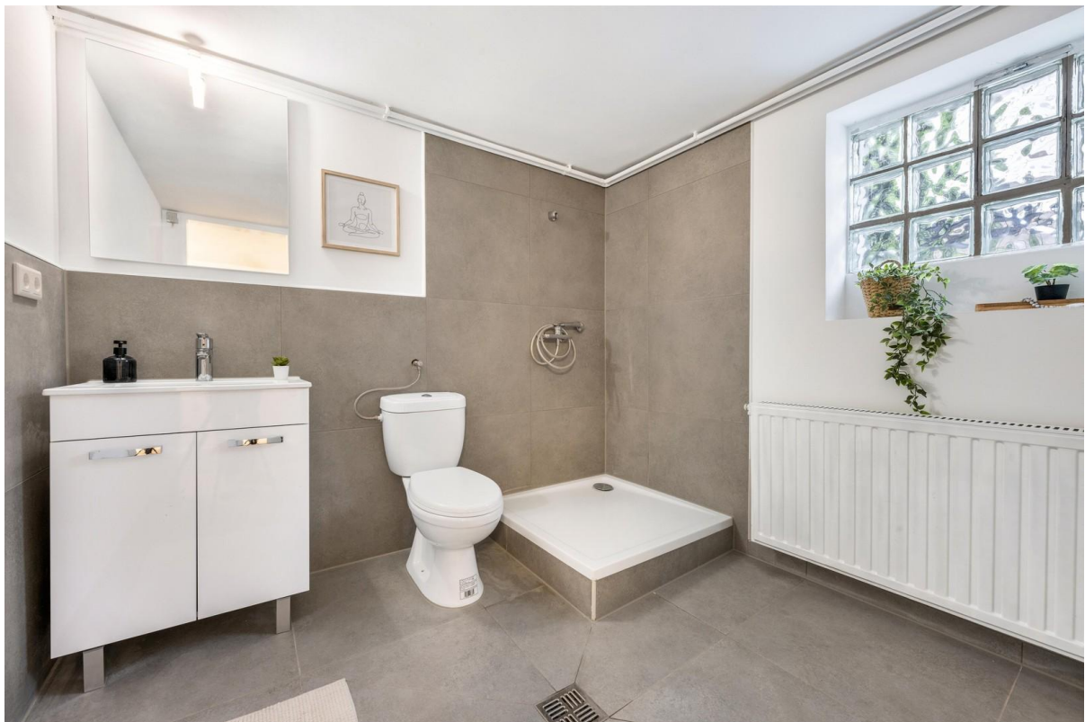
Badezimmer im Untergeschoss