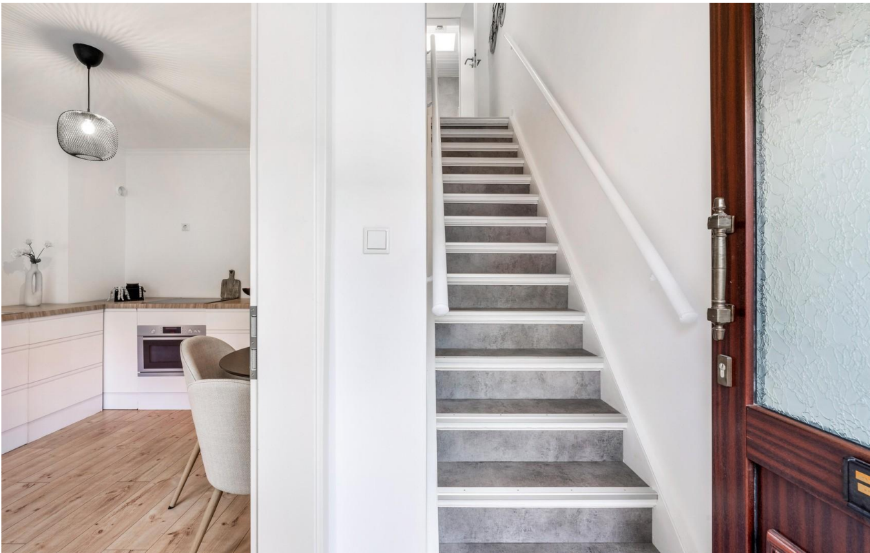
Flur und Treppe ins OG