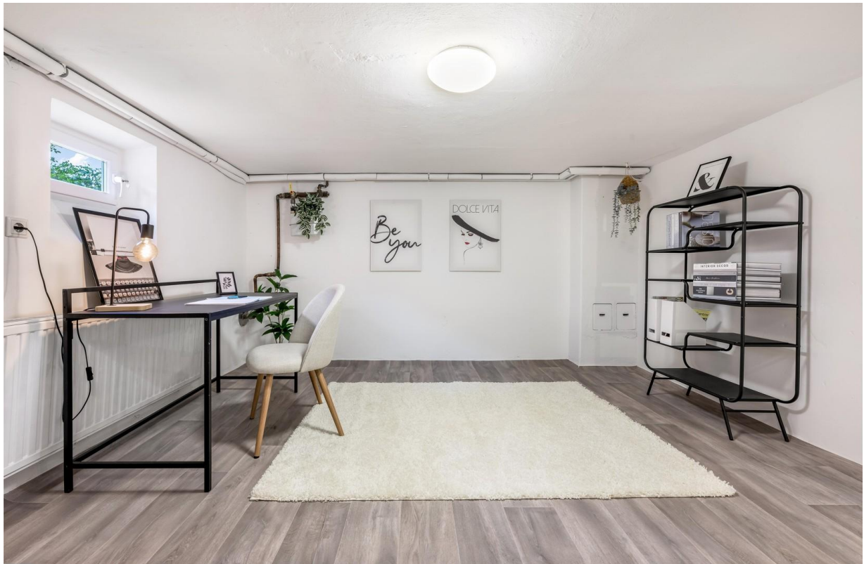
Büro im Untergeschoss