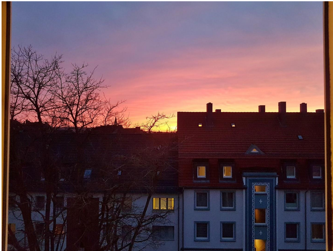
Ausblick Zimmer II