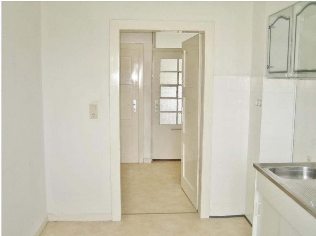
Küche (ohne Einrichtung)