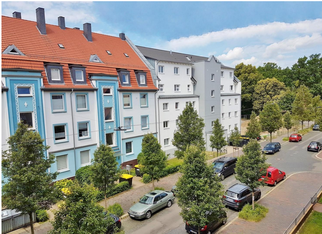
Ausblick Zimmer II