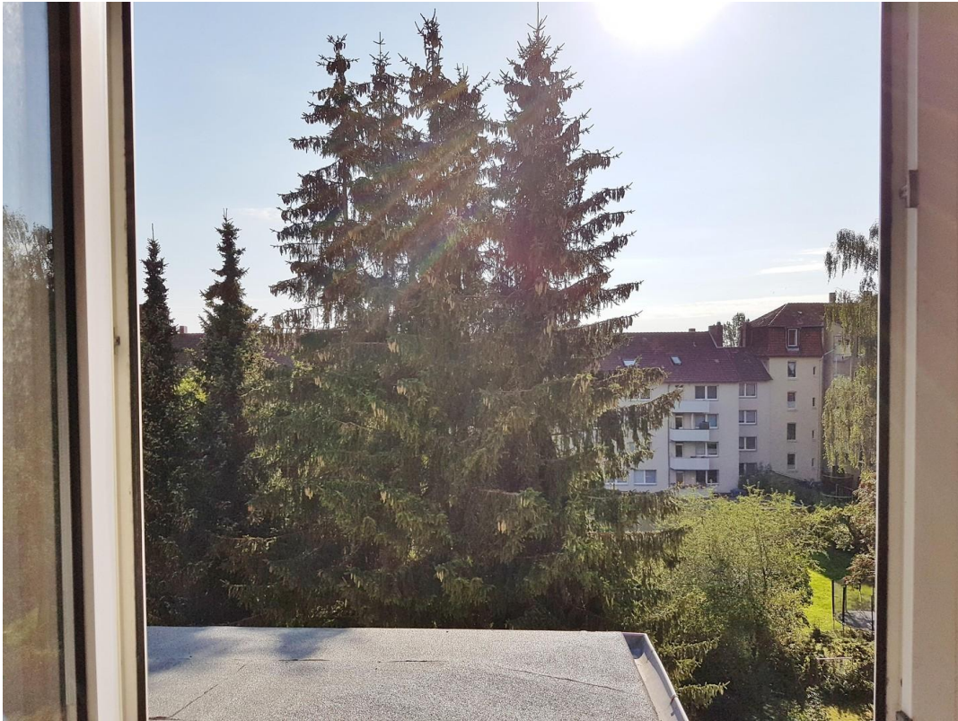
Ausblick Zimmer I