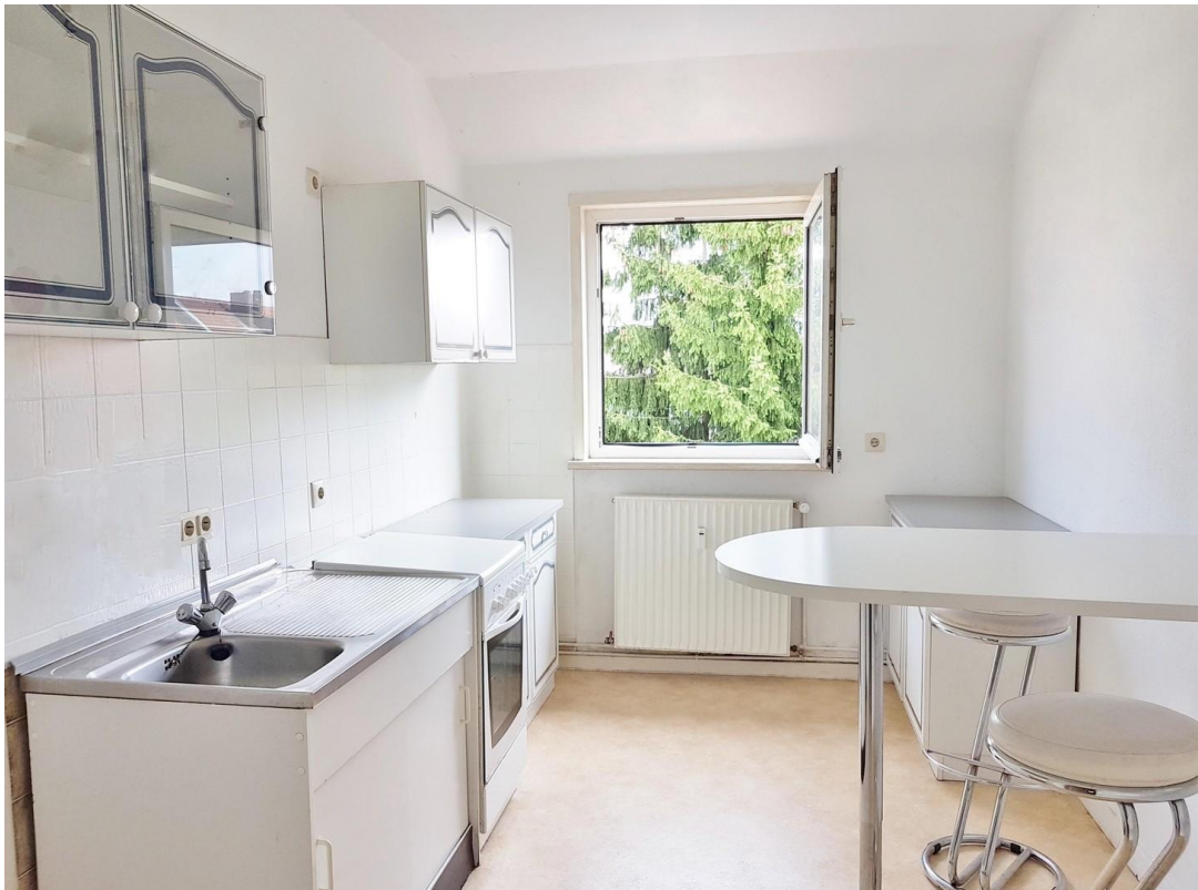
Küche (ohne Einrichtung)