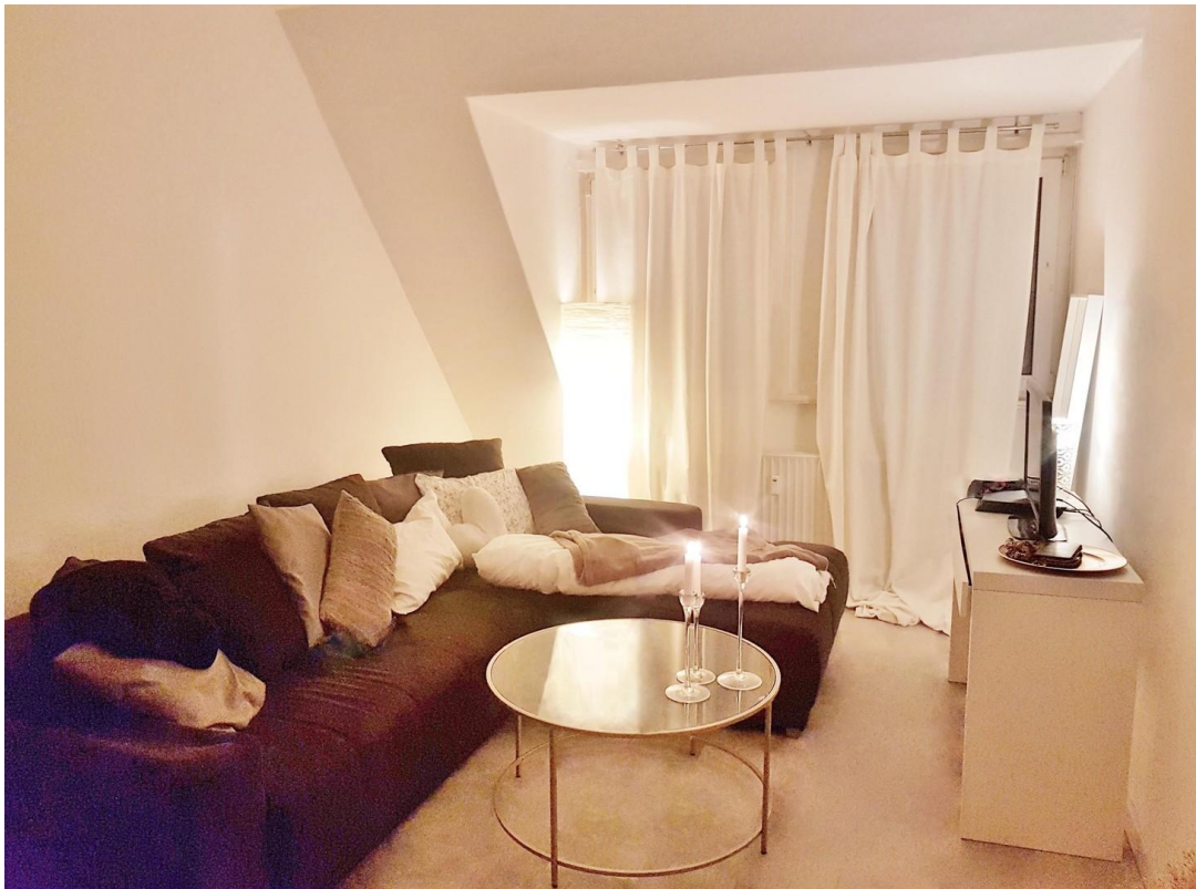
Zimmer II (Einrichtungsbeispiel)