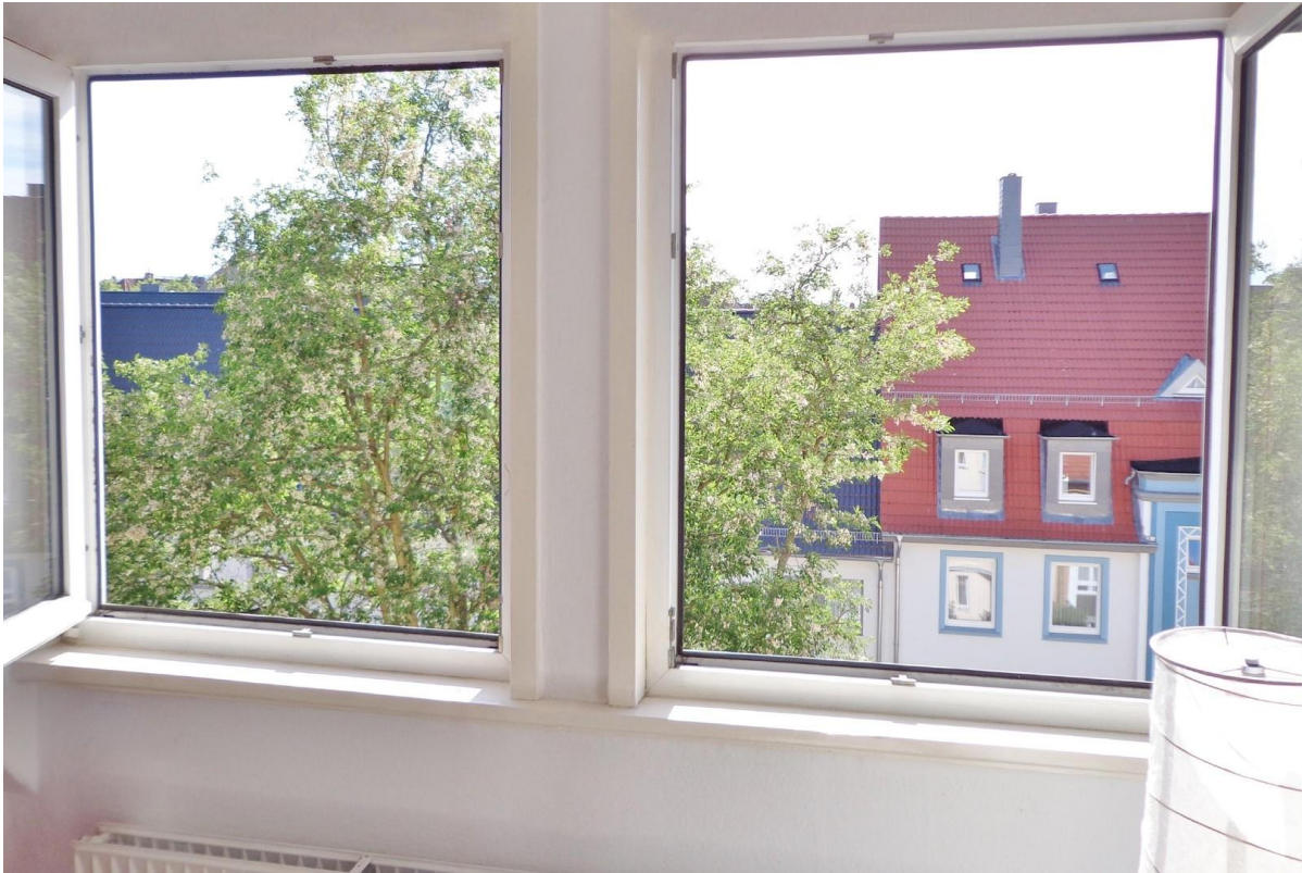
Ausblick Zimmer II