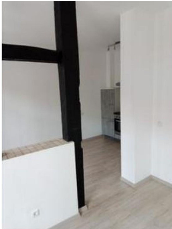
Blick aus Zimmer in Küche