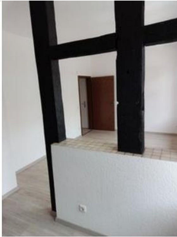
Blick aus Küche in Zimmer