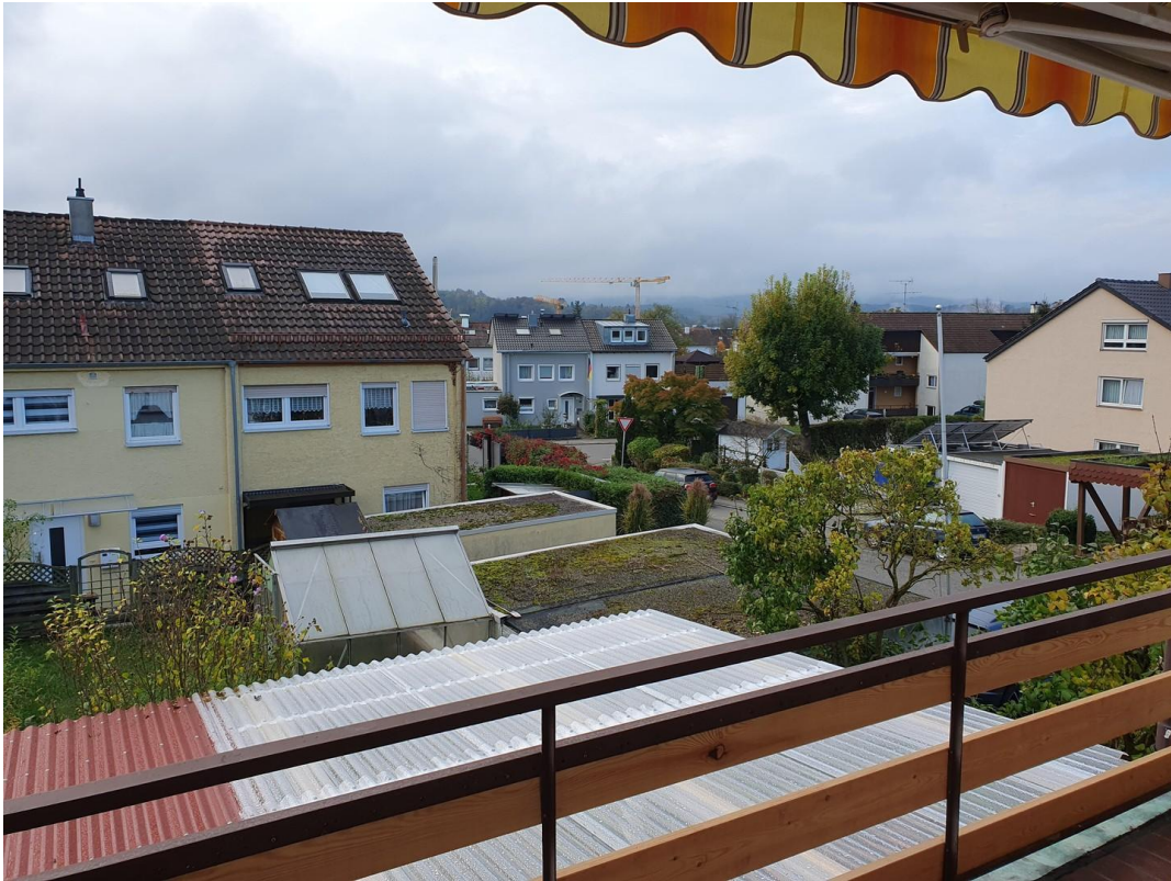
Ausblick Balkon mit Markise