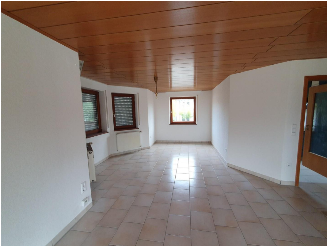
Esszimmer / Büro