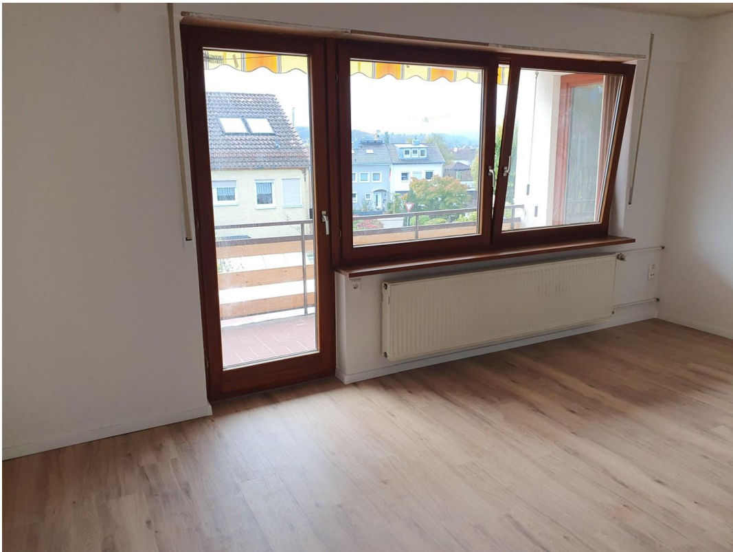
Schlafzimmer mit neuem Vinyl