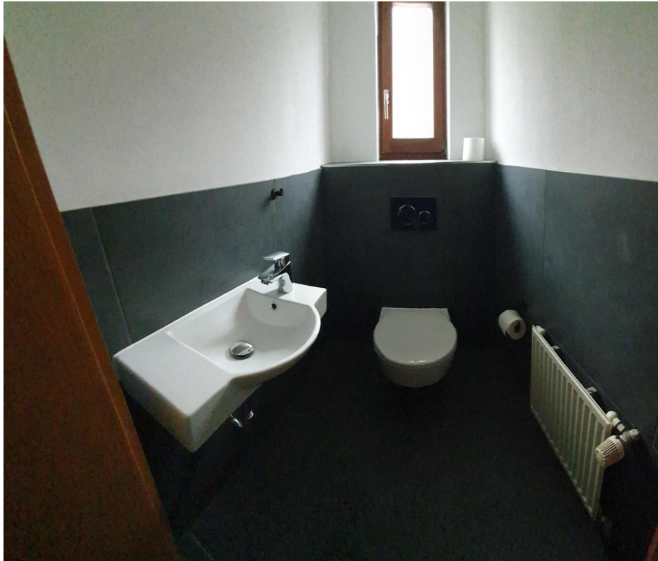
neu saniertes WC