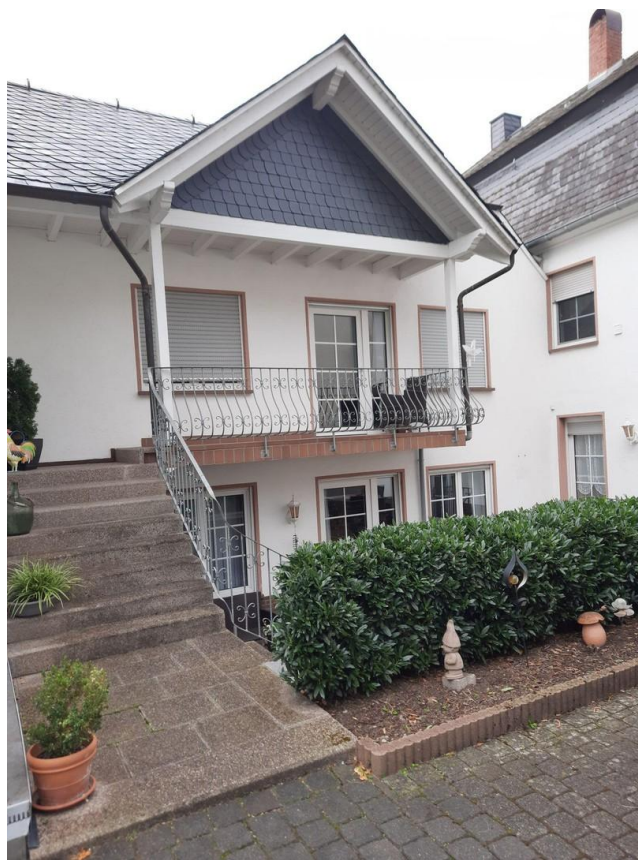
Anbau mit Singlewohnung