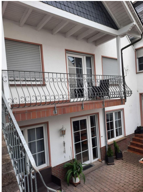
Ausbaureserve oberer Stock