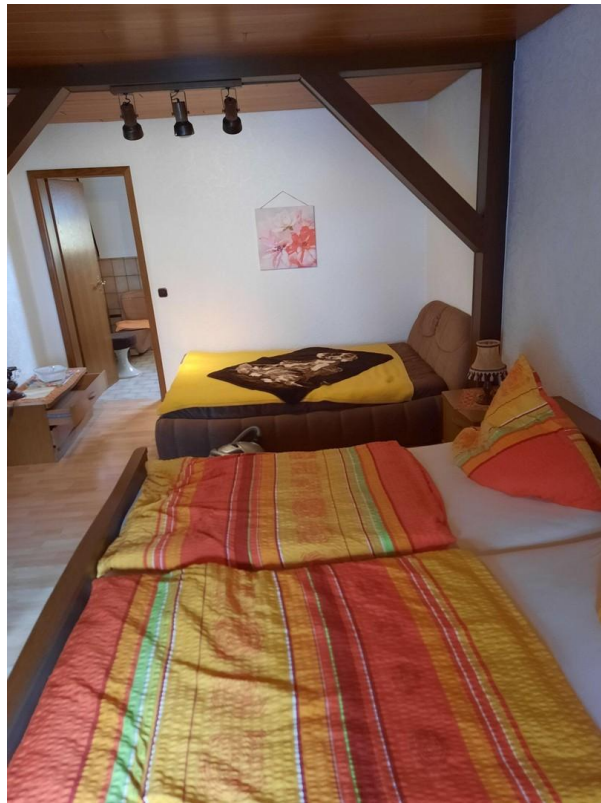
3 Bett Gästezimmer