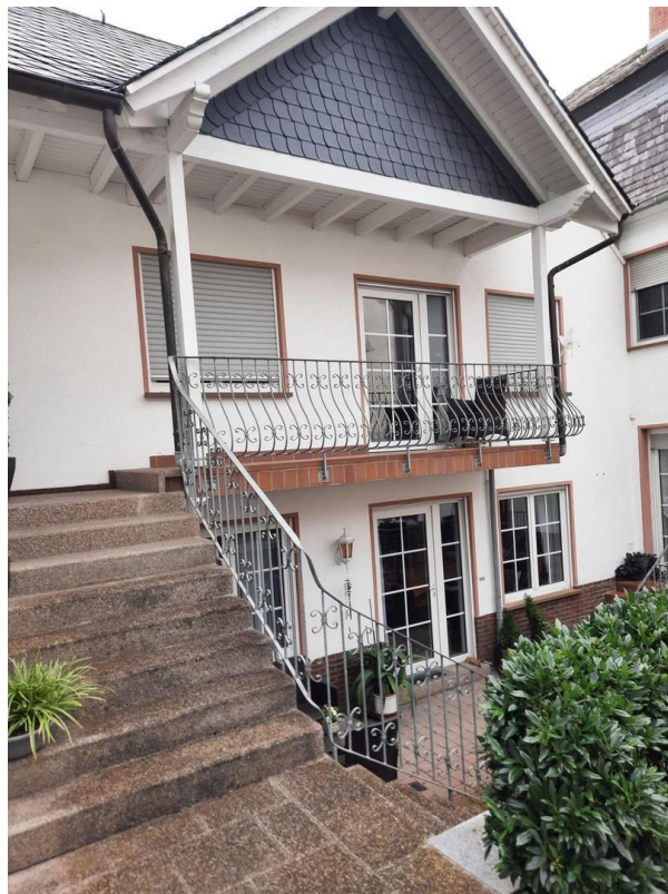
Anbau Bj. 1989-1990