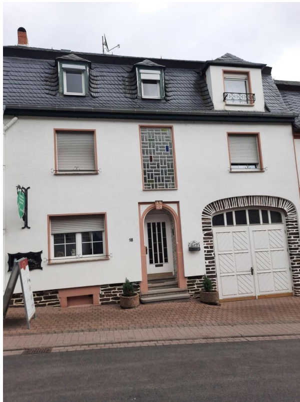
Ansicht von Westen