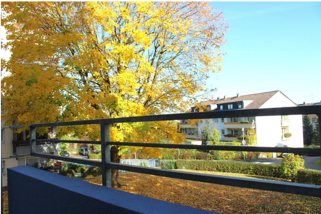
Ausblick Balkon Richtung Osten