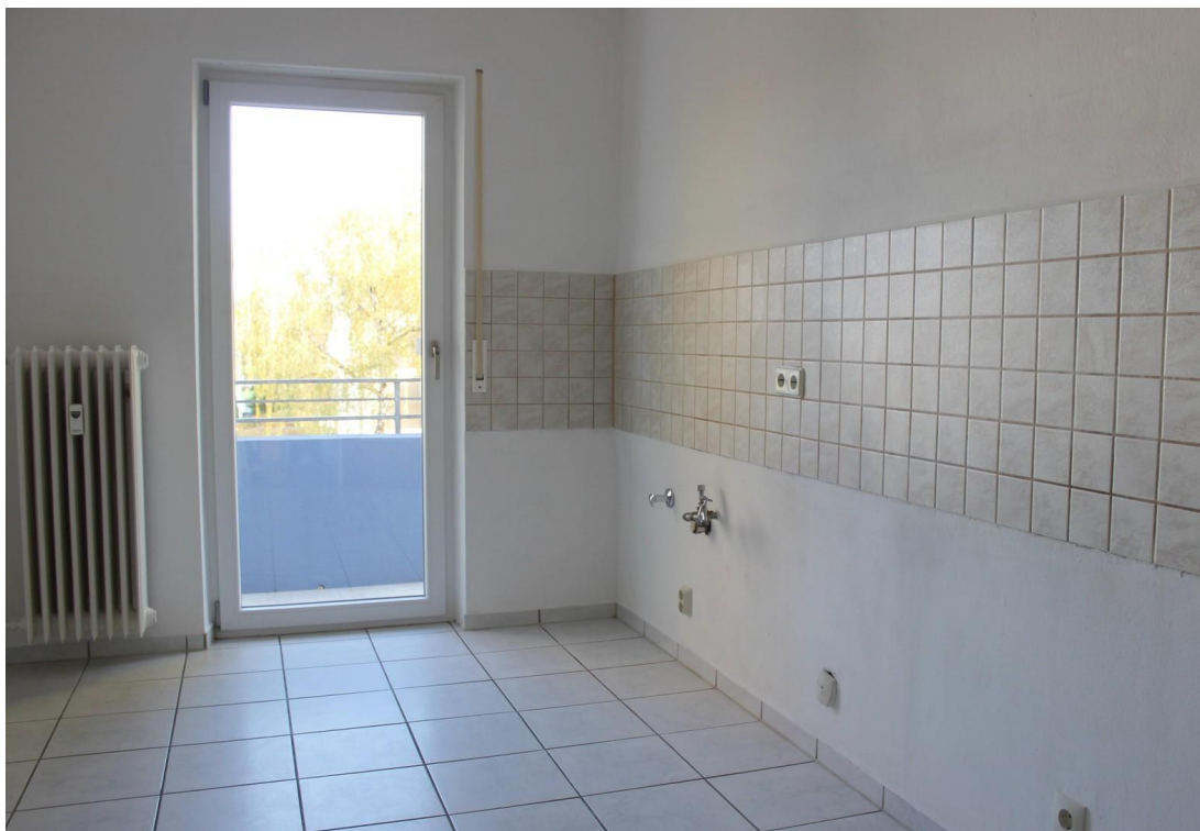
Küche mit Balkon