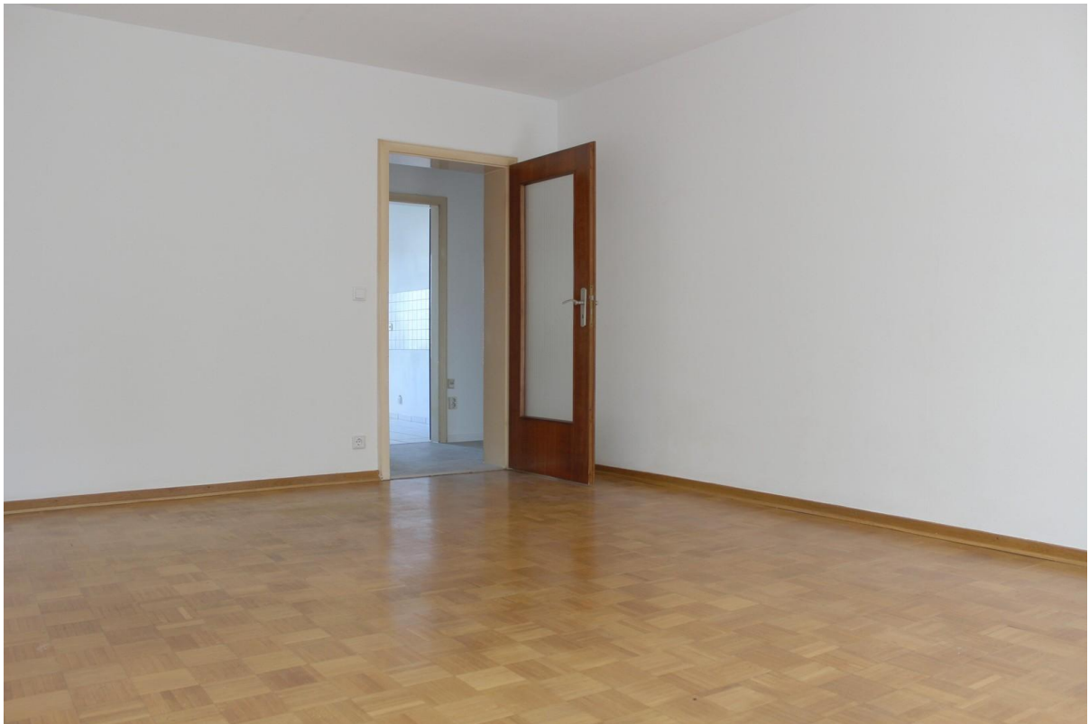
Blick Richtung Flur u. Küche