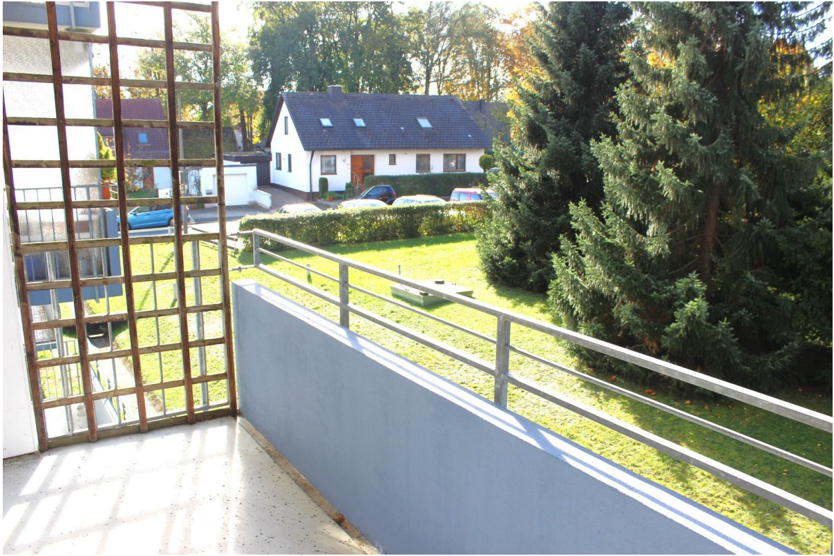
Blick vom Westbalkon