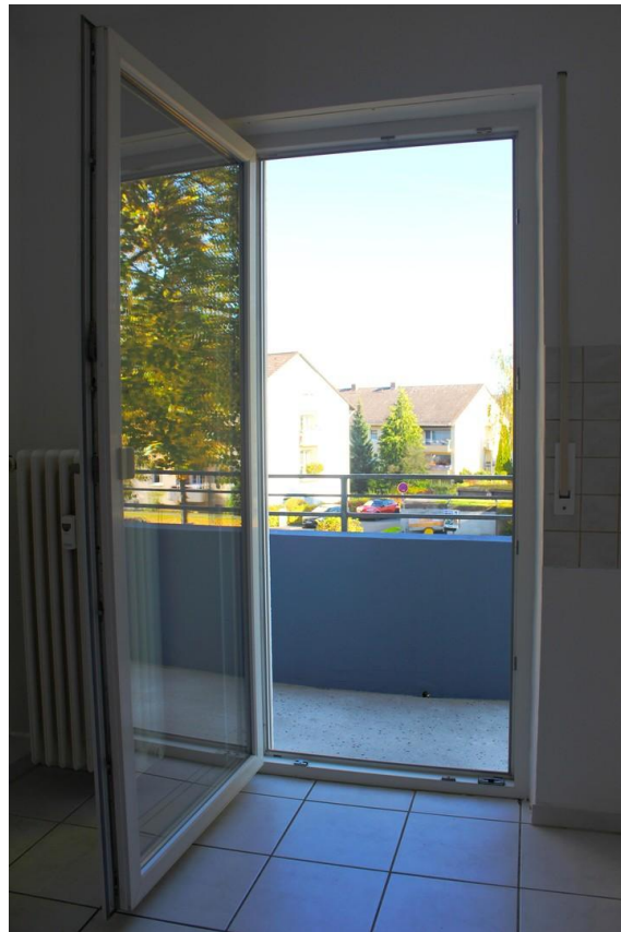
Zugang zum Balkon