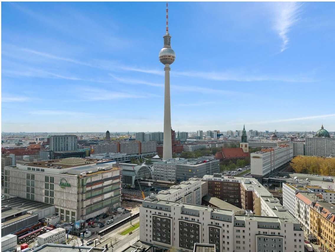
Blick auf Fernsehturm