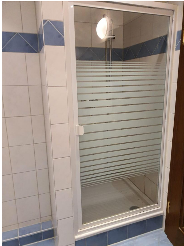
Dusche sep. im Bad