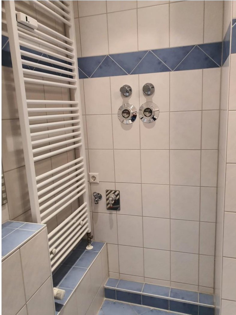
WM Stellplatz im Bad