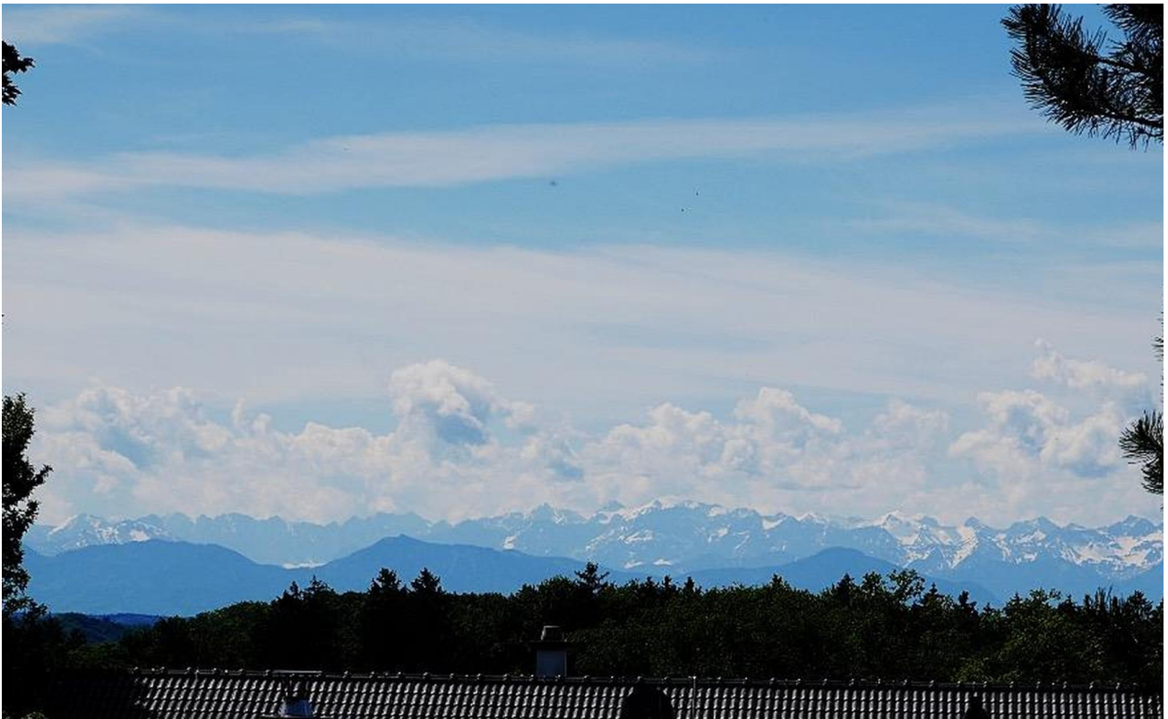
Blick nach SSO, Karwendel