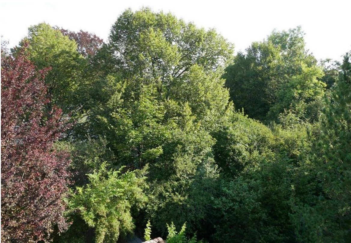
Blick nach Nordost