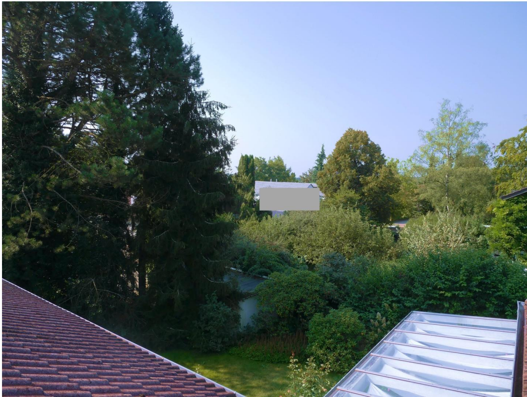
Blick nach Westen