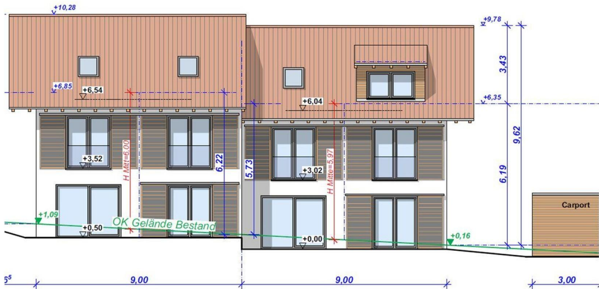
Vorplanung von Südwest