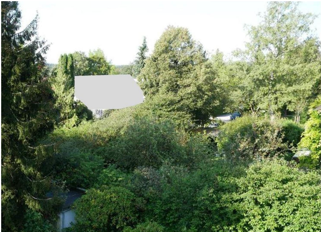
Blick nach SW