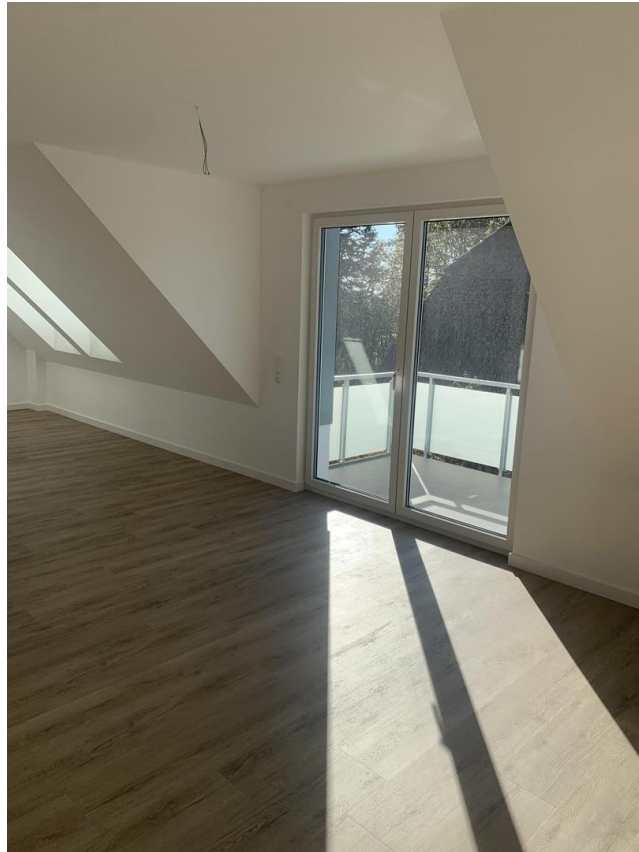
Wohn-Essbereich mit Balkontür