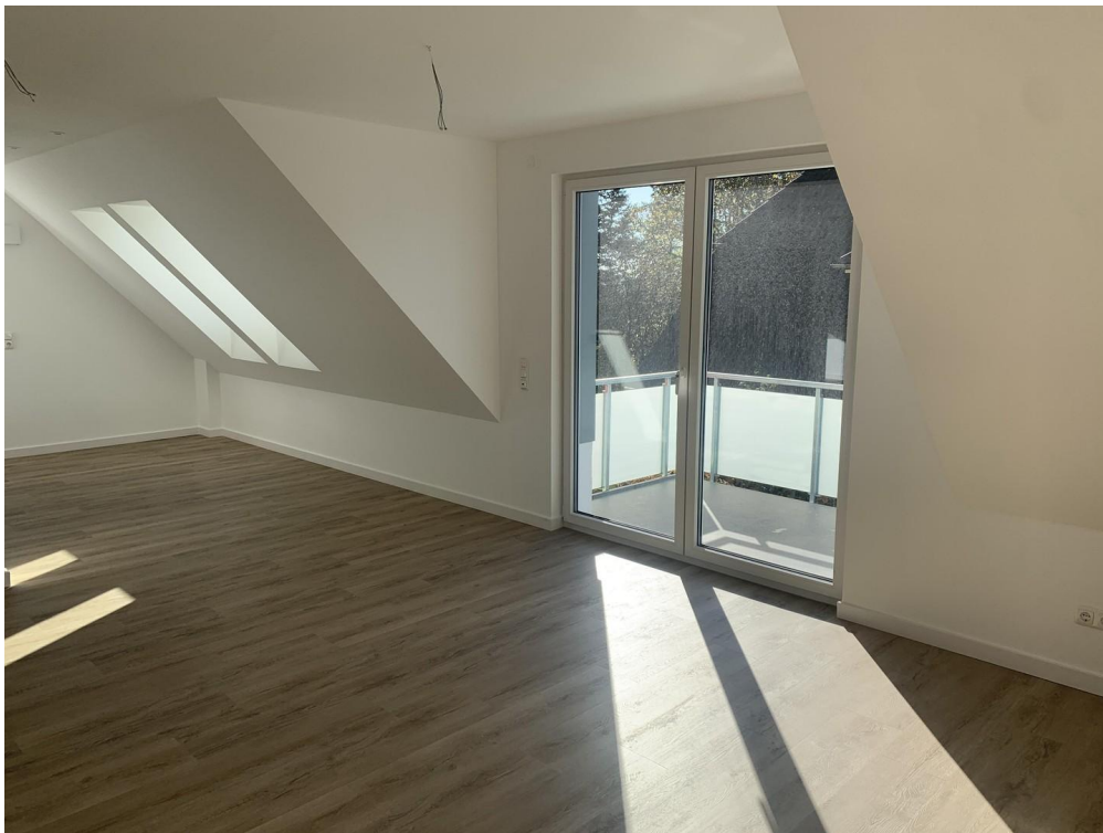
Wohn-Essbereich mit Balkontür