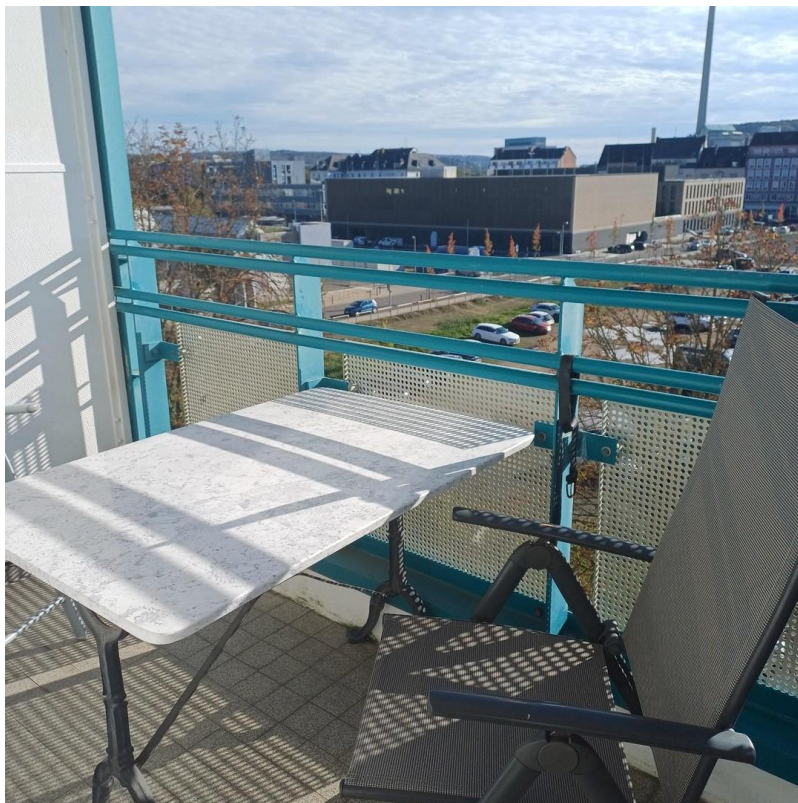
Balkon zur Süd Seite