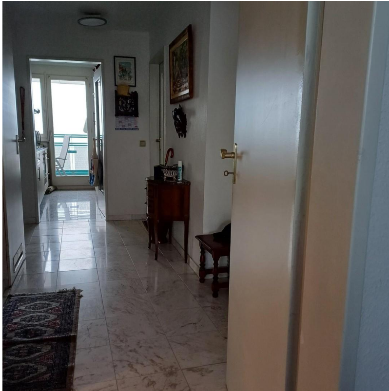
Flur, Küche, Balkon