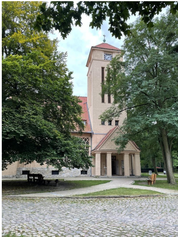
Die unmittelbare Umgebung