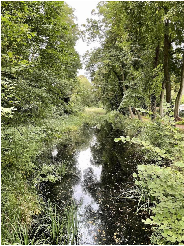
Die unmittelbare Umgebung