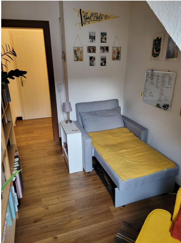
Kleines Zimmer (545 € warm)