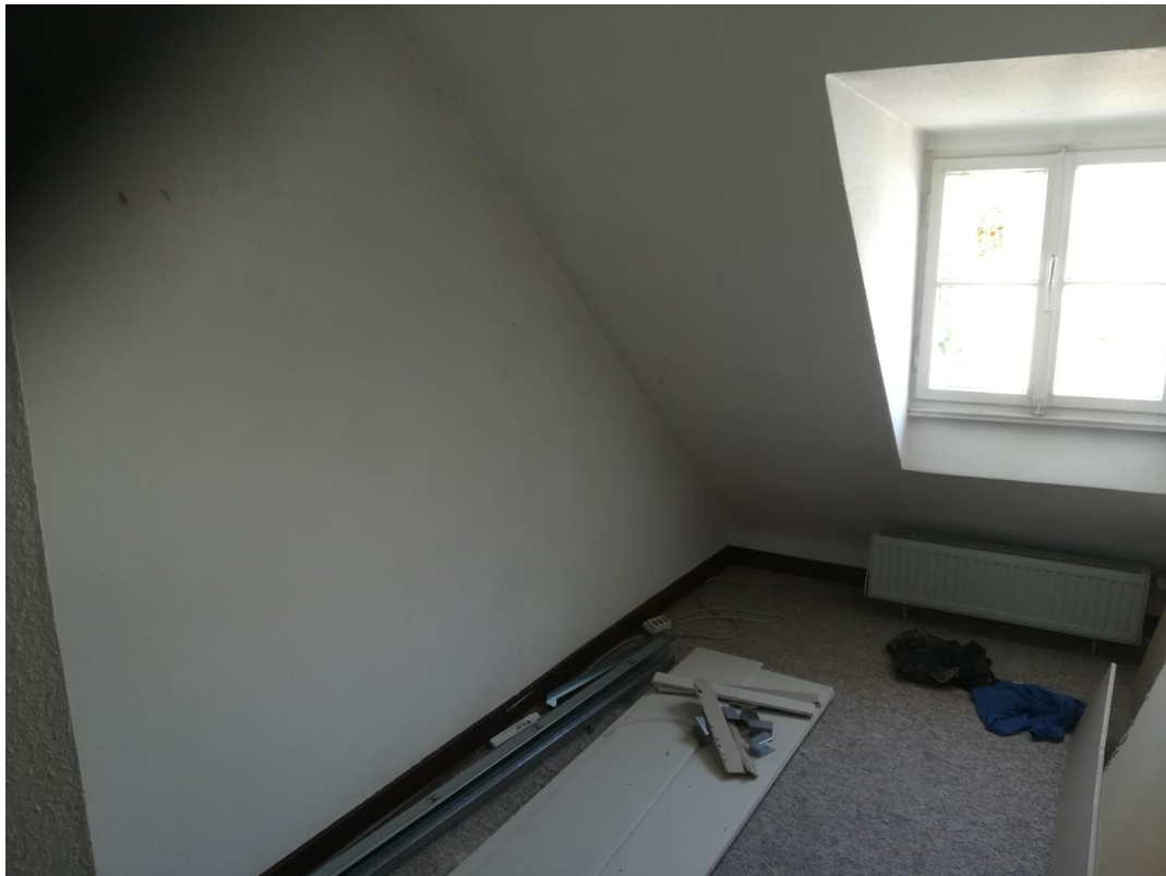
Kleines Zimmer vor Renovierung