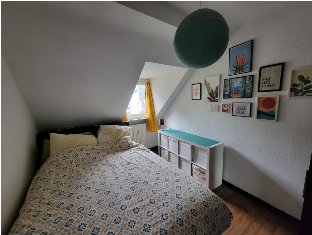
Großes Zimmer (582 € warm)