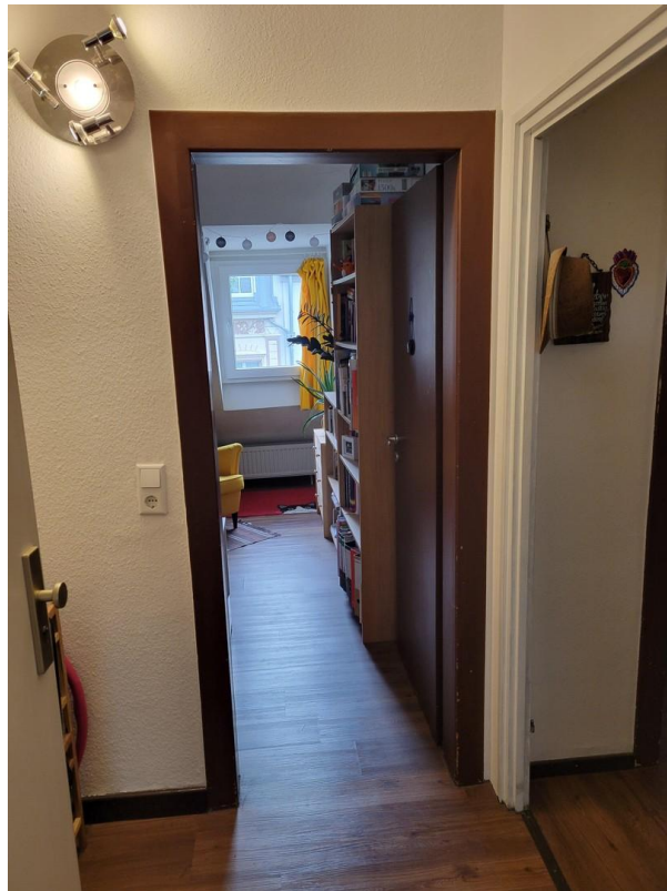
Blick durch die Wohnungstür