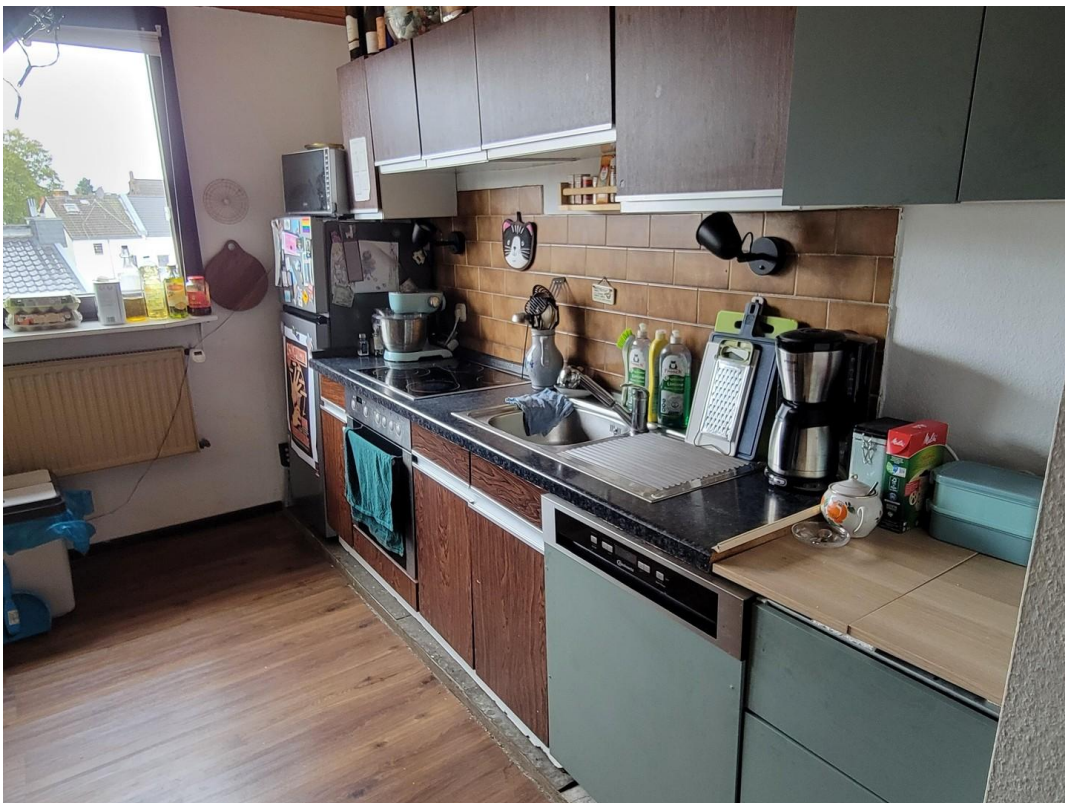
Küchenzeile in Wohnzimmer