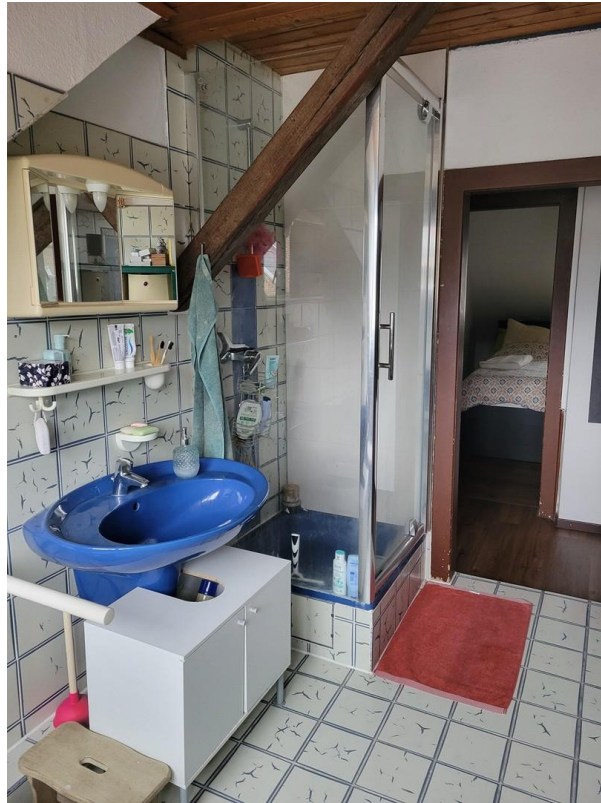
Bad mit Glasdusche