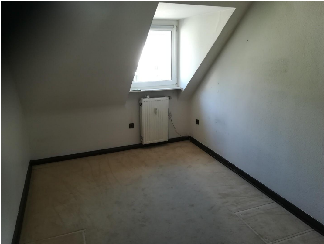
Großes Zimmer vor Renovierung