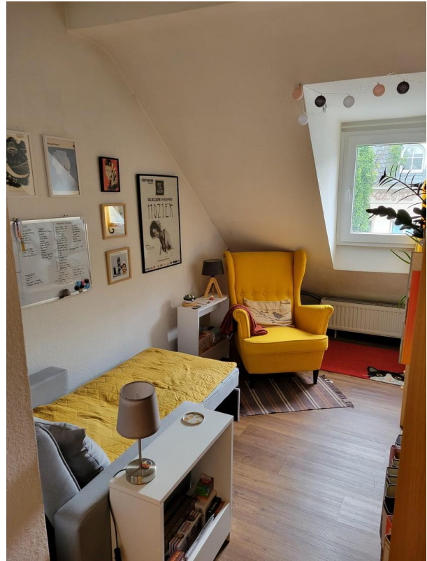
Kleines Zimmer (545 € warm)