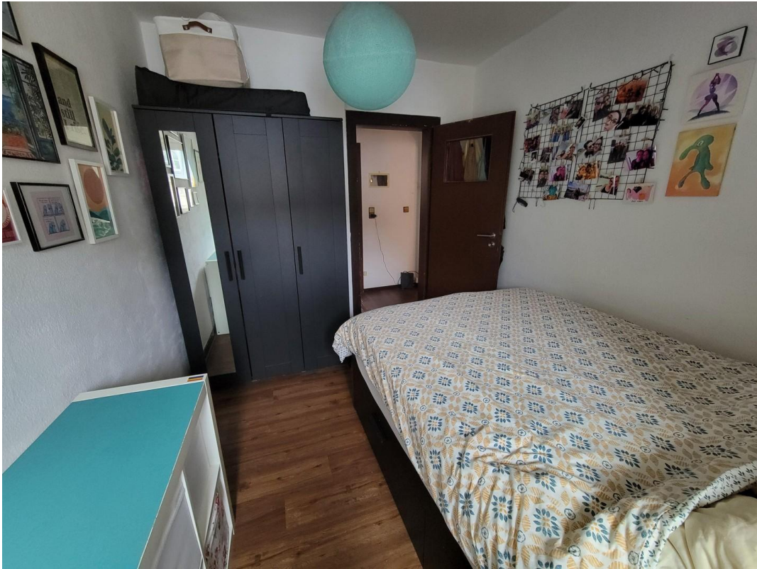
Großes Zimmer (582 € warm)