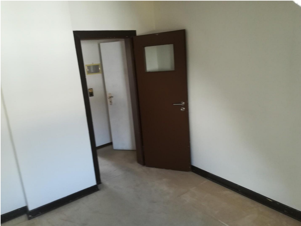
Großes Zimmer vor Renovierung