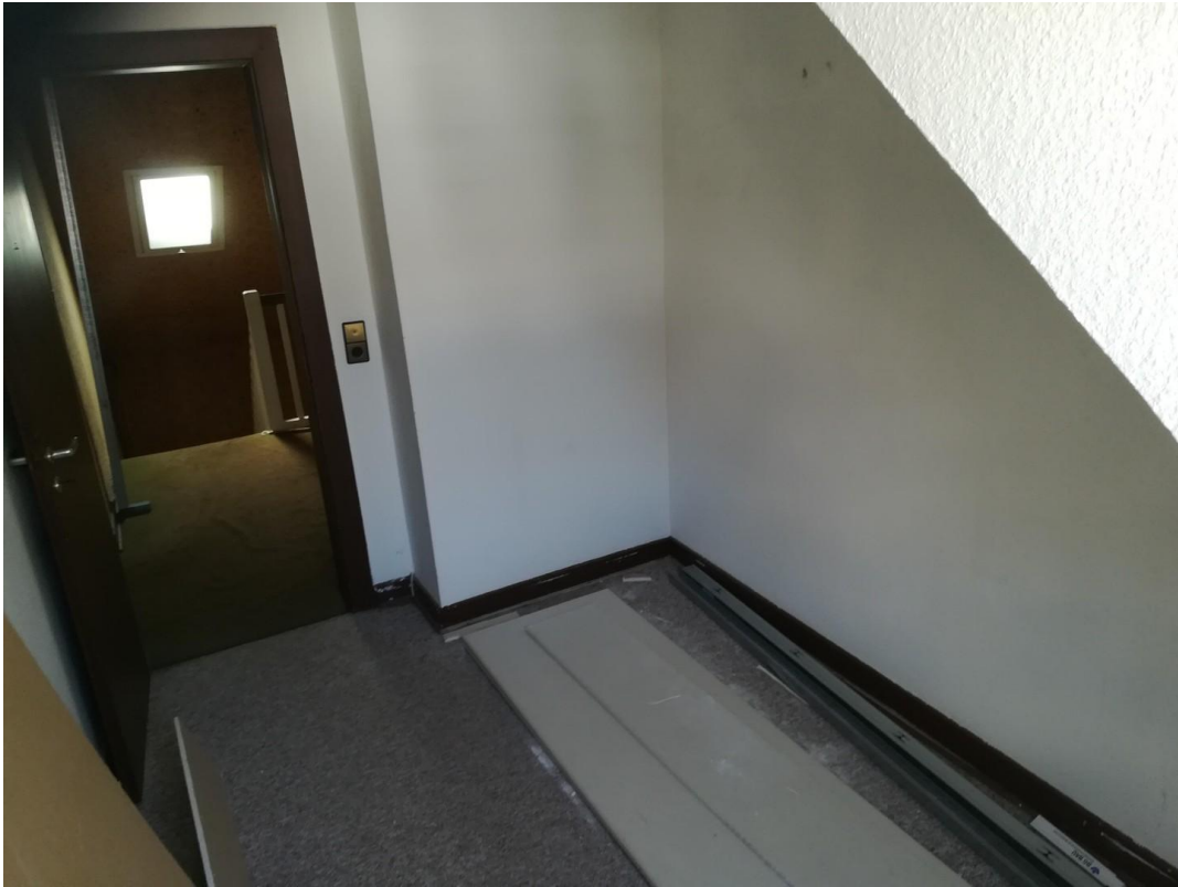
Kleines Zimmer vor Renovierung