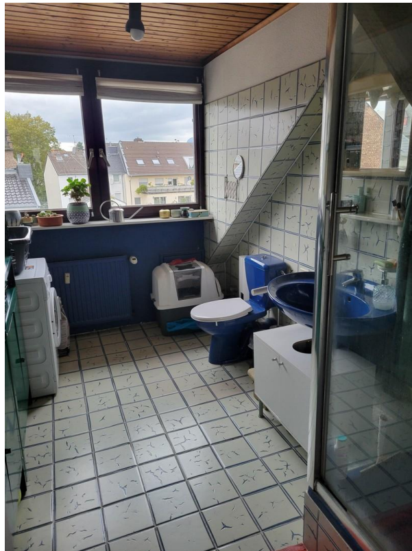
Bad mit Glasdusche