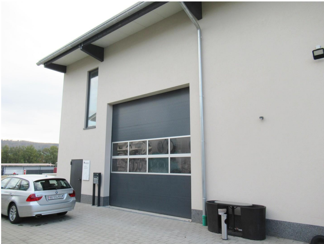
Hallen-Eingang von Osten