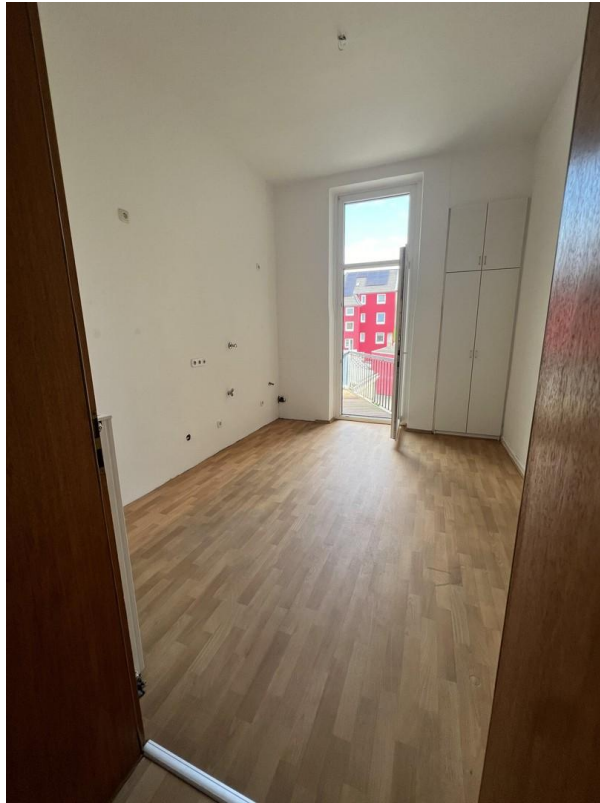
Küche vom Flur