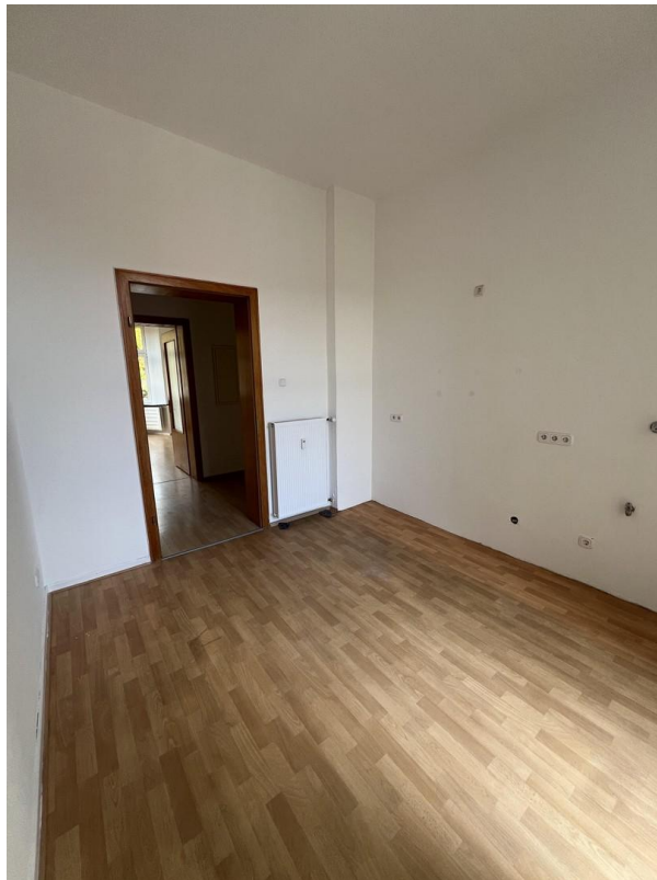
Küche von innen