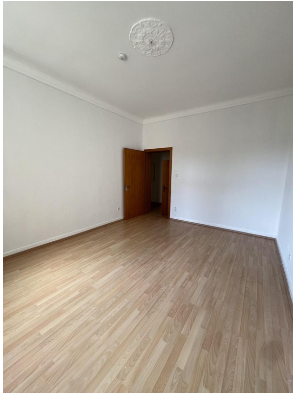
Büro / Kinderzimmer