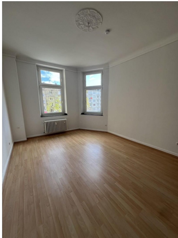
Büro / Kinderzimmer