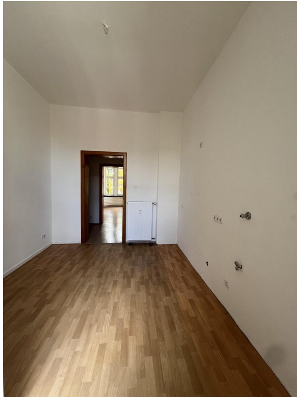
Küche vom Balkon