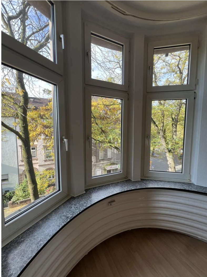
Ausblick vom Wohnzimmer