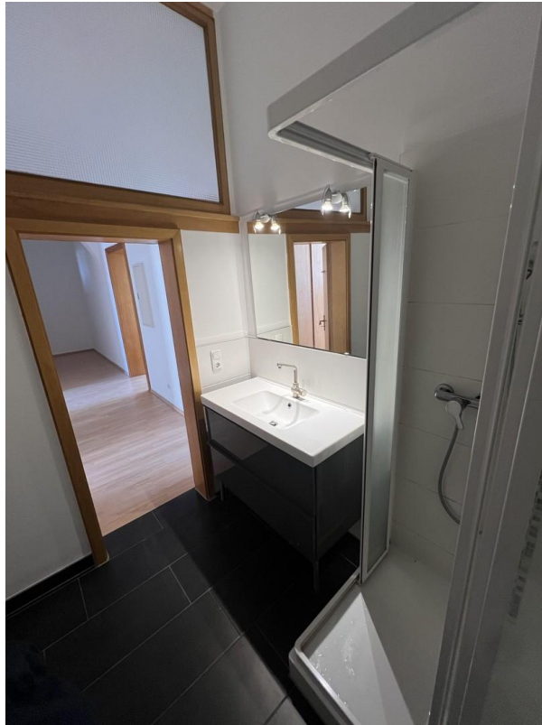
Duschbad Blick Richtung Flur