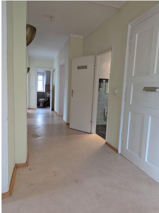
Platz für Schränke. Diele