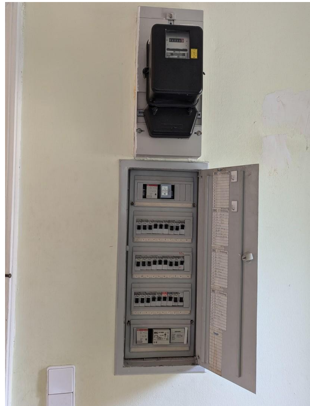
FI- Schalter verbaut.