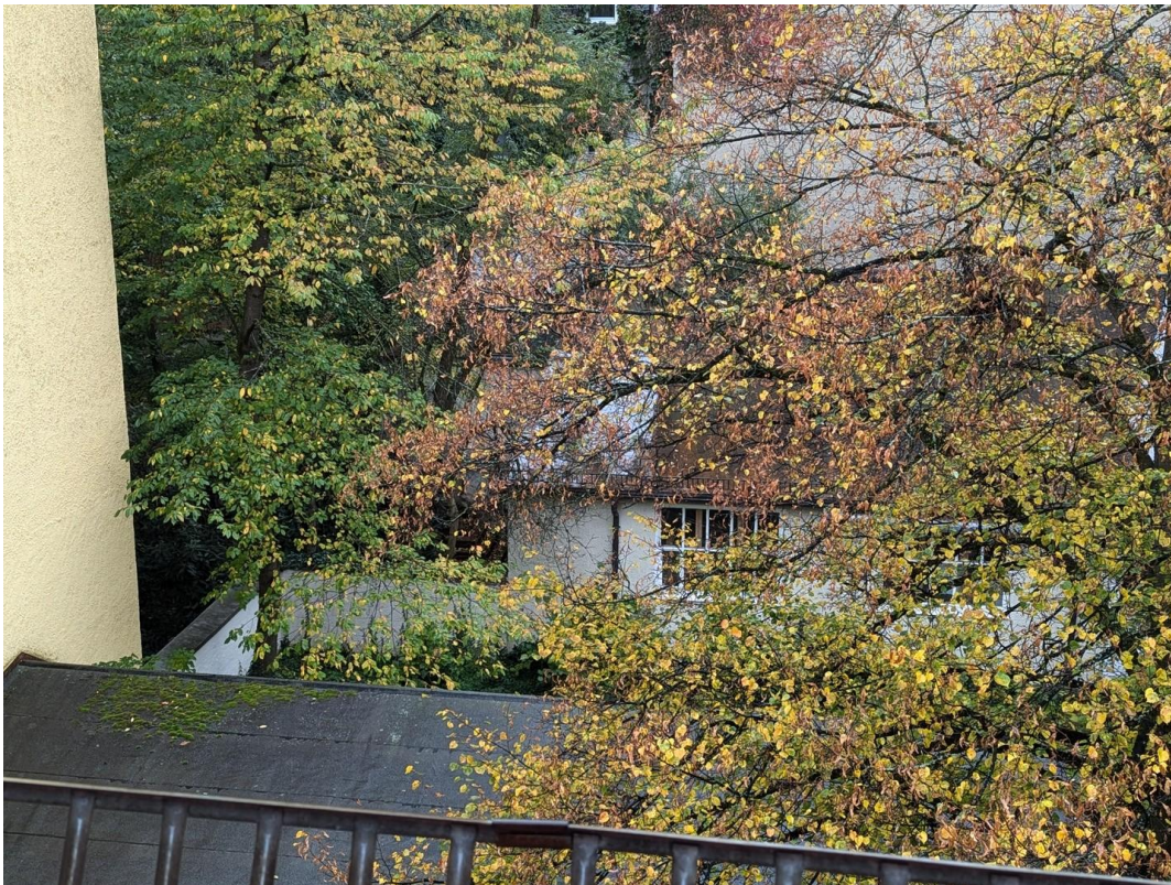
Blick in den Hinterhof