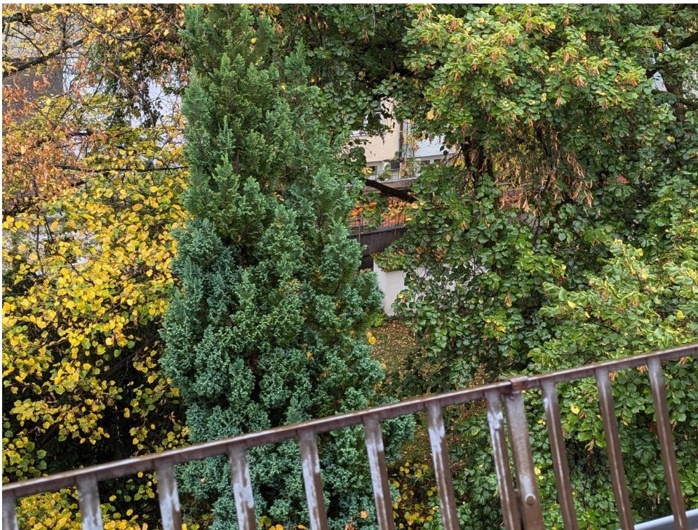
Blick aus dem Fenster