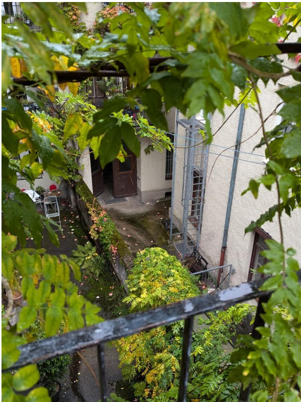
Blick in den ruhigen Innenhof