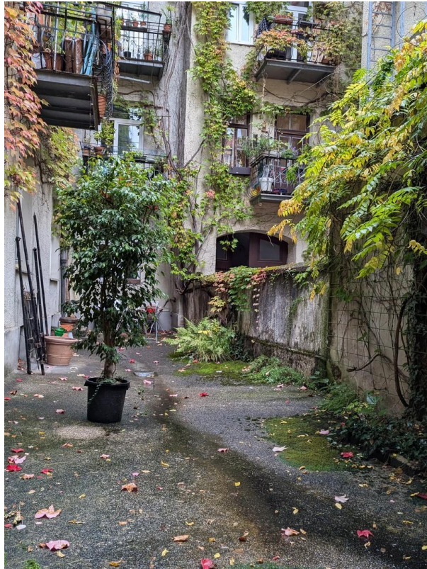
Innenhof zur Mitbenutzung