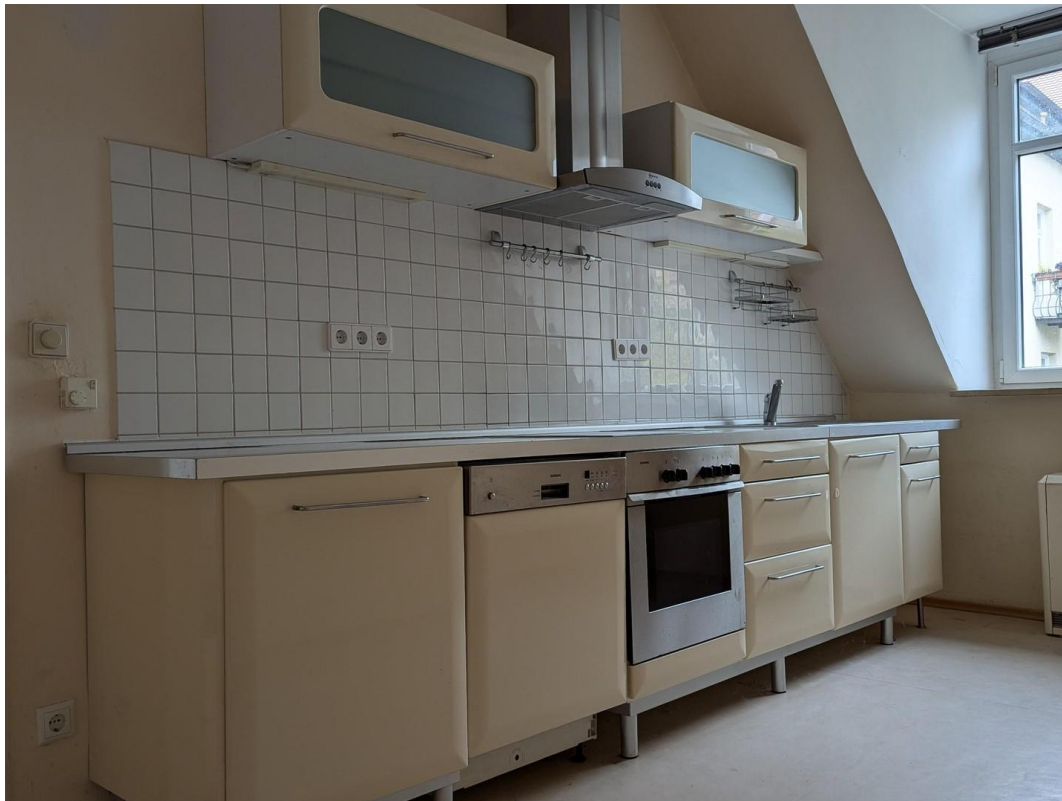
EBK mit Siemensgeräten -Ablöse