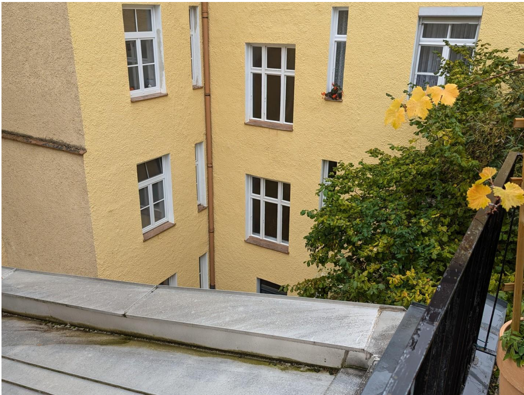
Blick in den Innenhof