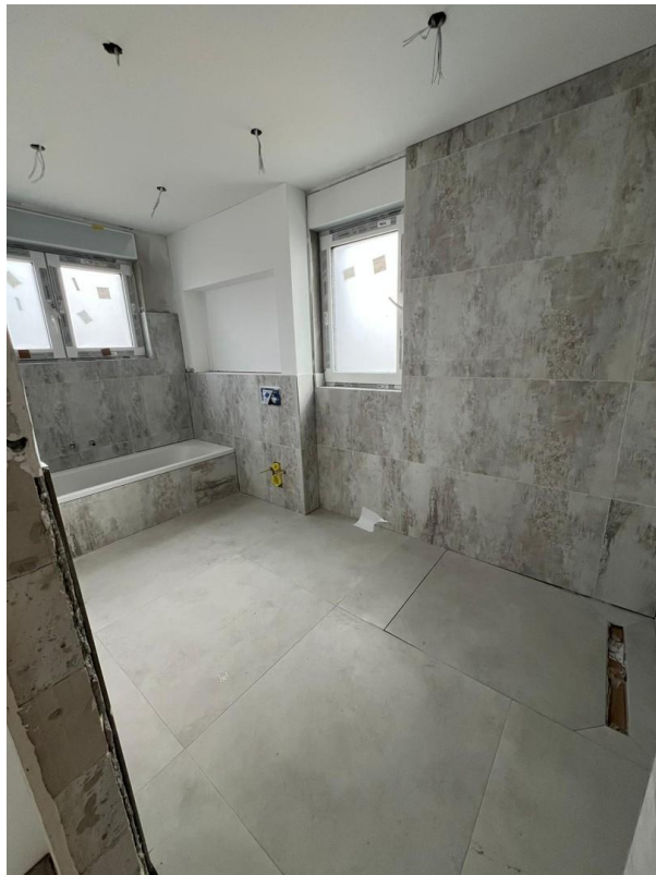
Bad / WC