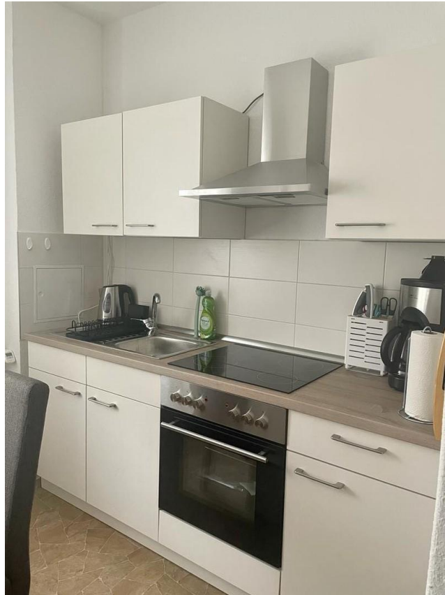
Küche (voll eingerichtet)