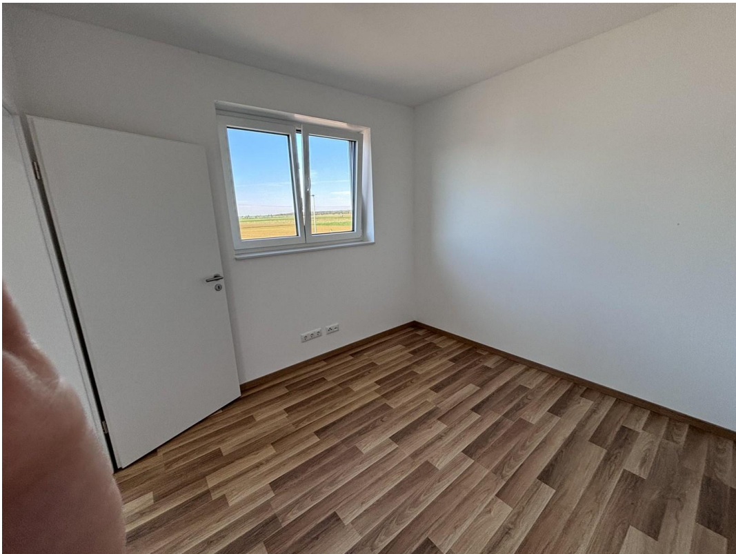
Zimmer 1 im IOG