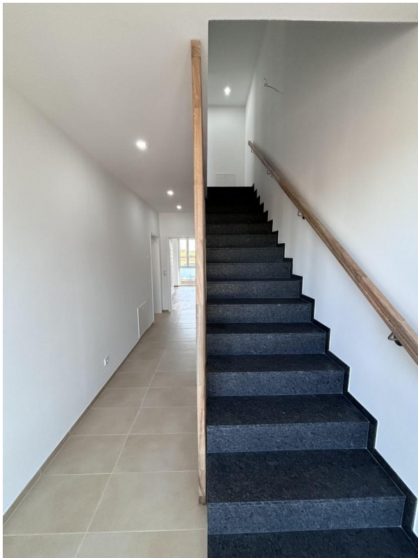
Treppe zum DG