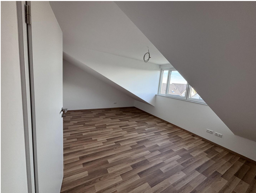
Zimmer 3 DG