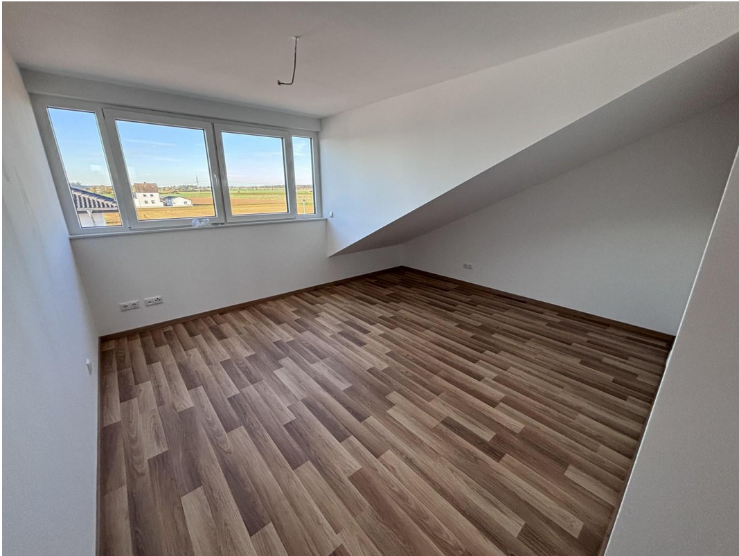
Zimmer 2 DG