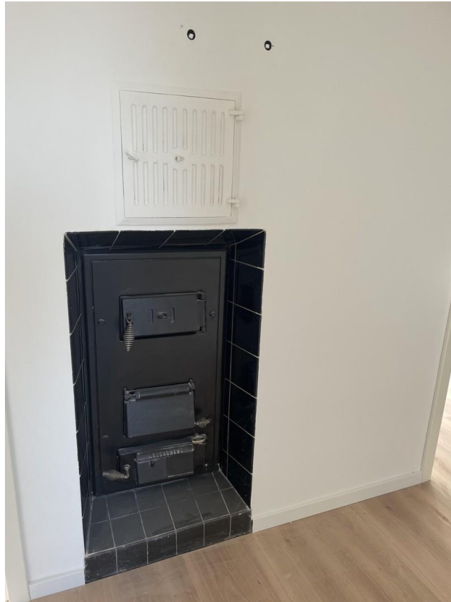
Kamin / Ofen