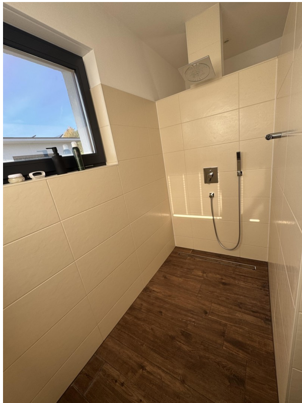
Walk In Dusche