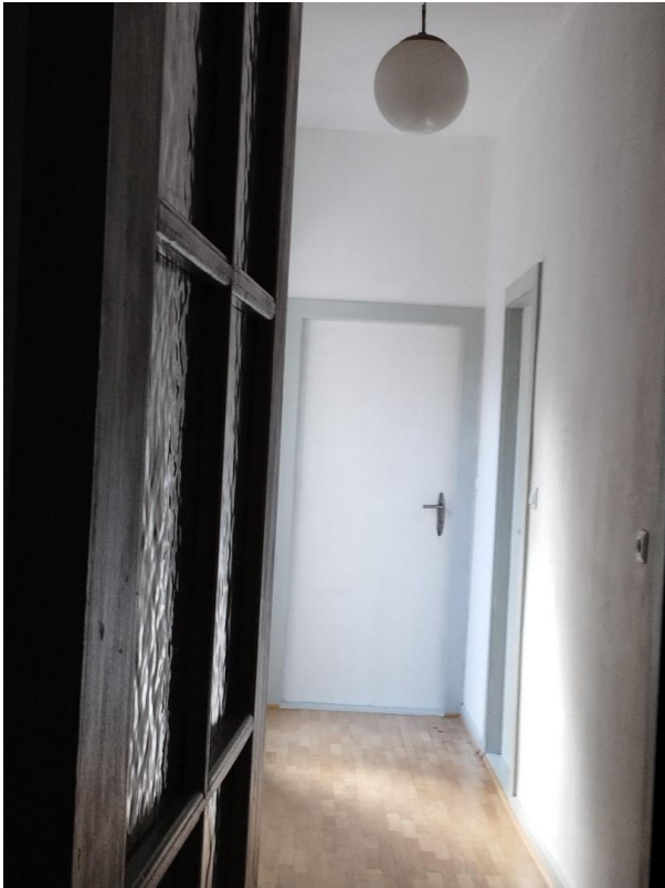
Flur des Apartments