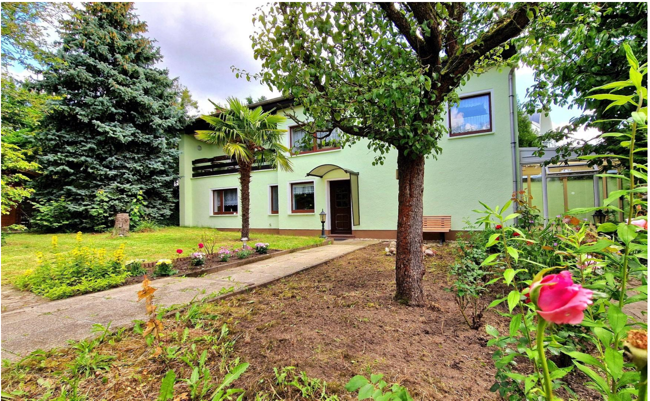
Hausansicht am Eingang