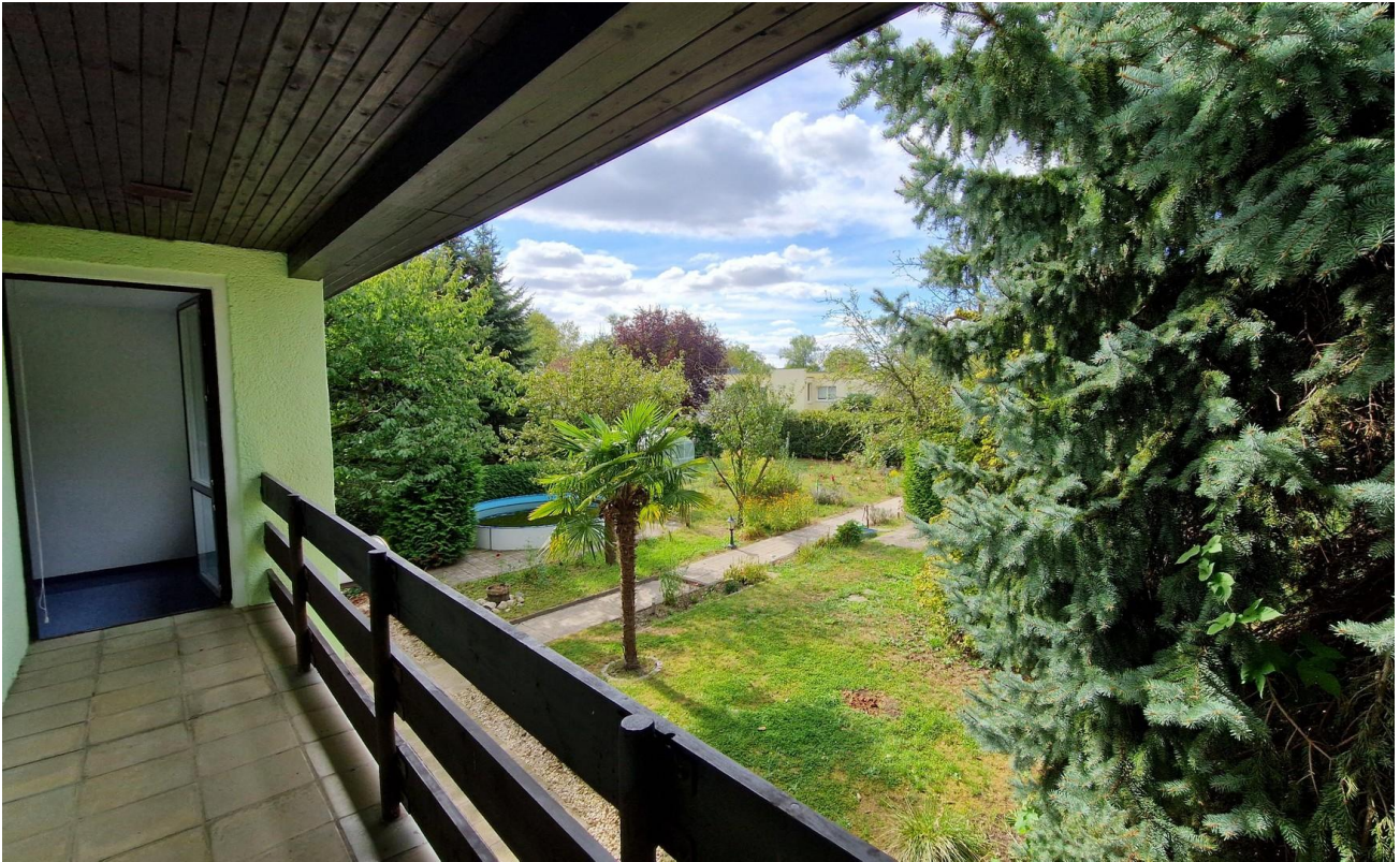
Balkon am Wohnzimmer 1. OG