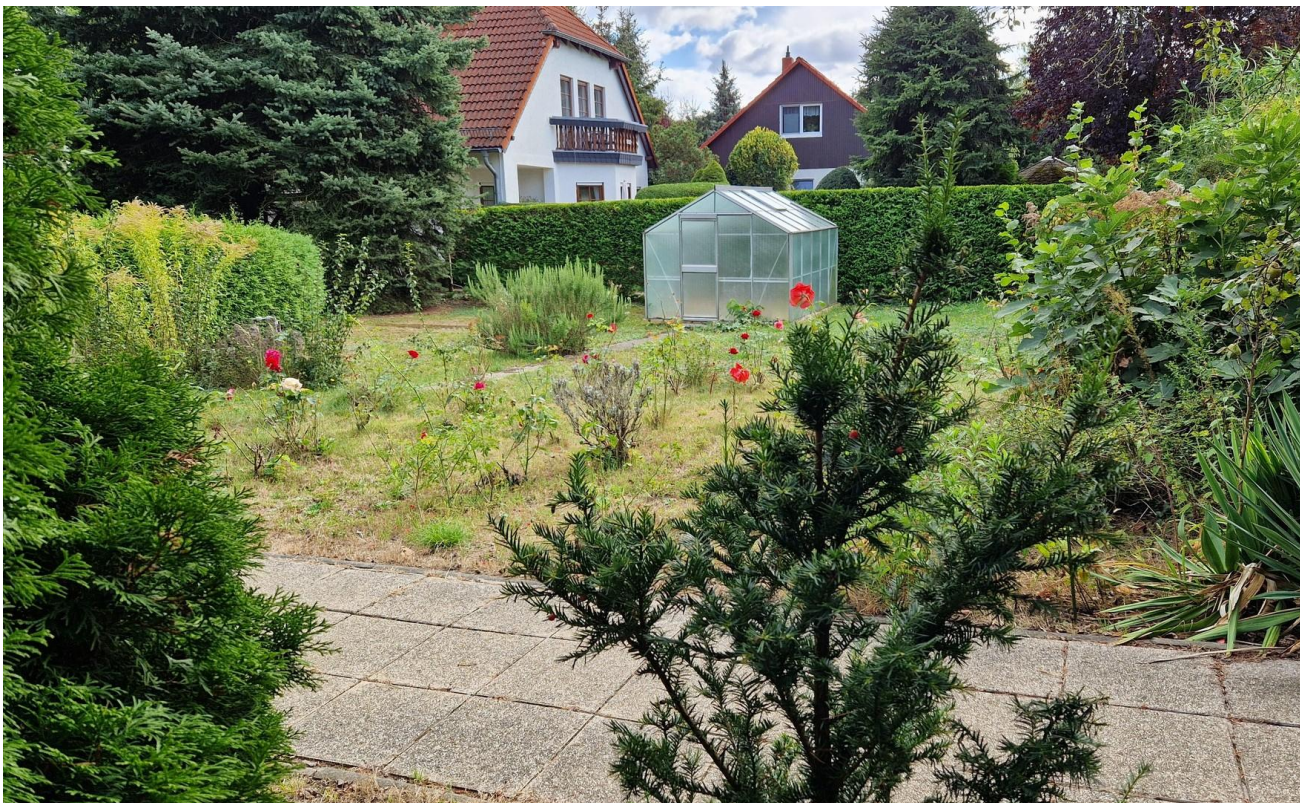
Garten mit Gewächshaus