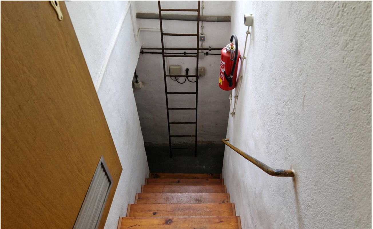
Treppe zum Keller