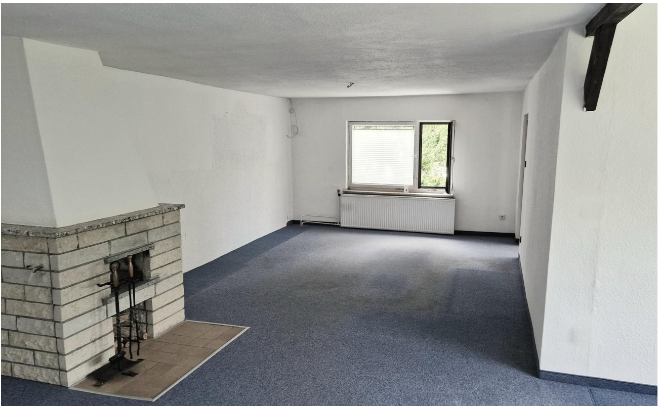
Wohnzimmer 1. OG