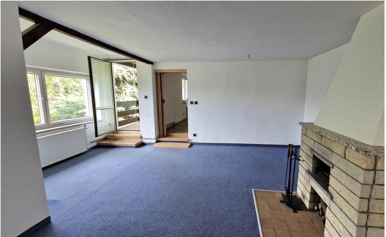
Wohnzimmer 1. OG