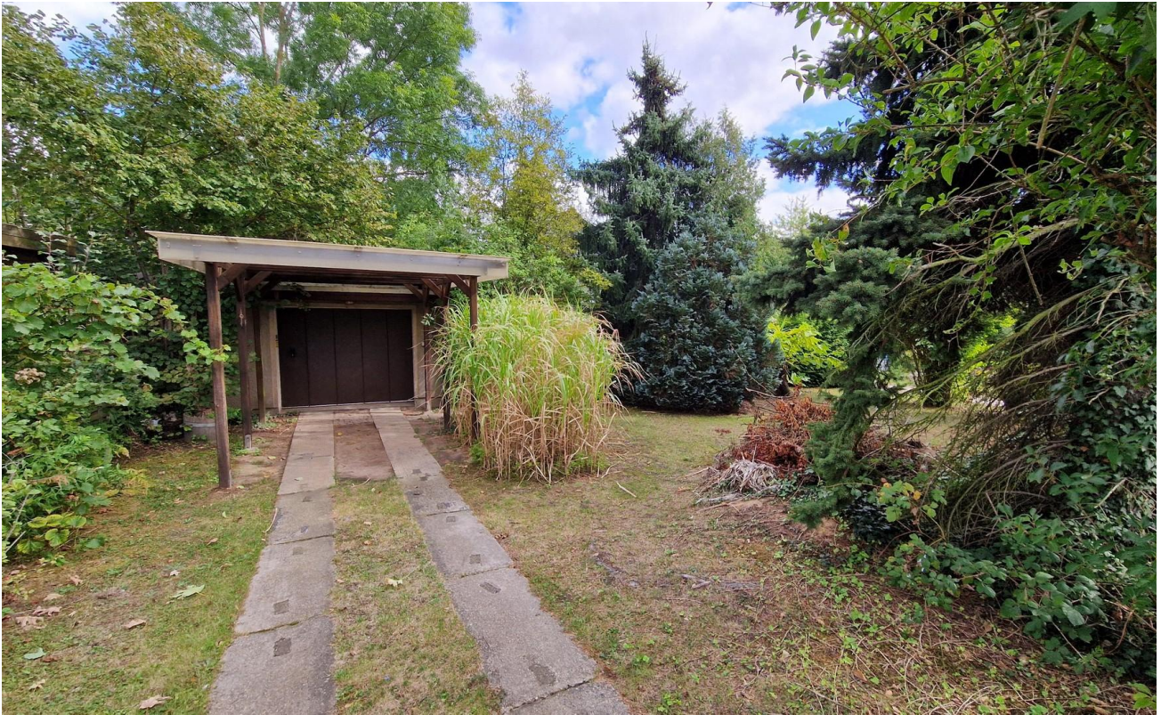
Einfahrt zur Garage