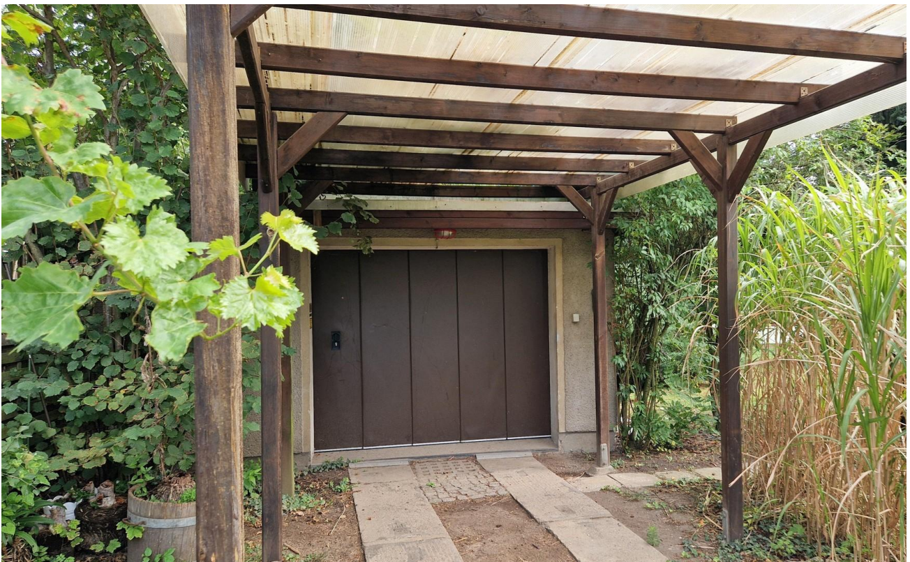
Carport vor Garage