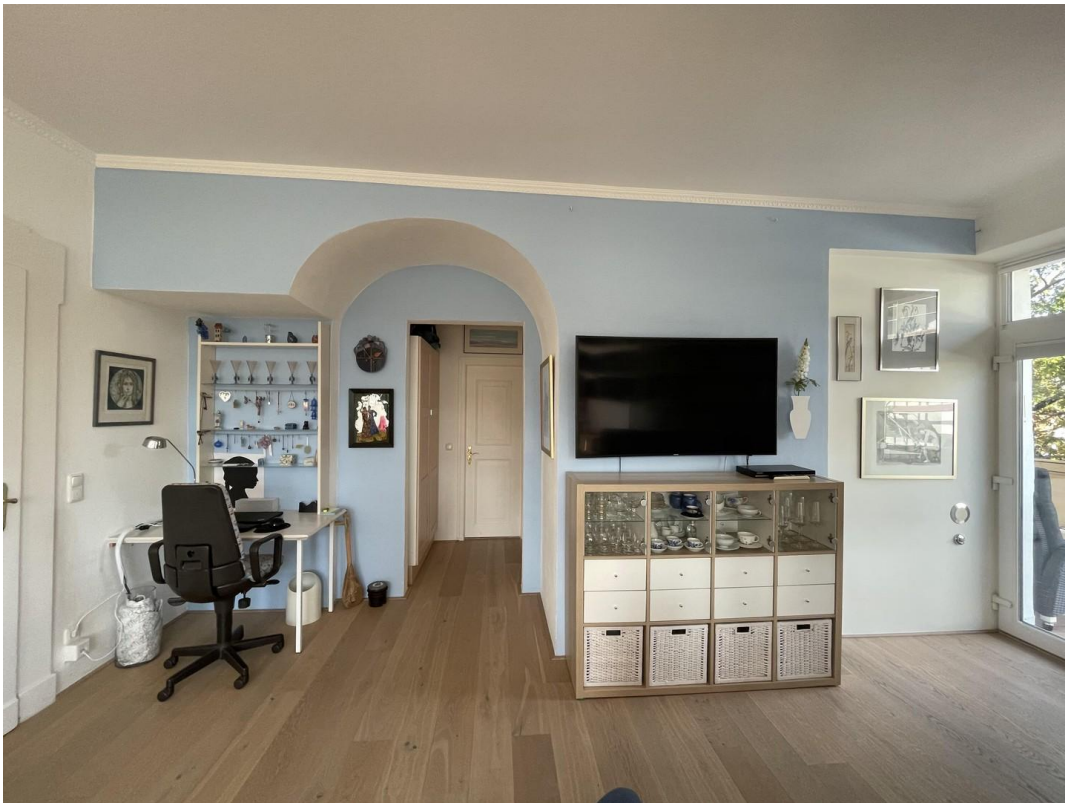
WZ Zugang Kind - Gästebad