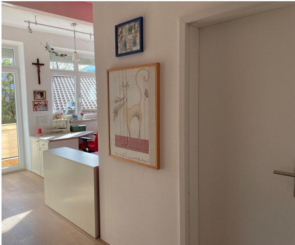
Zum Schlafzimmer-Bad 2