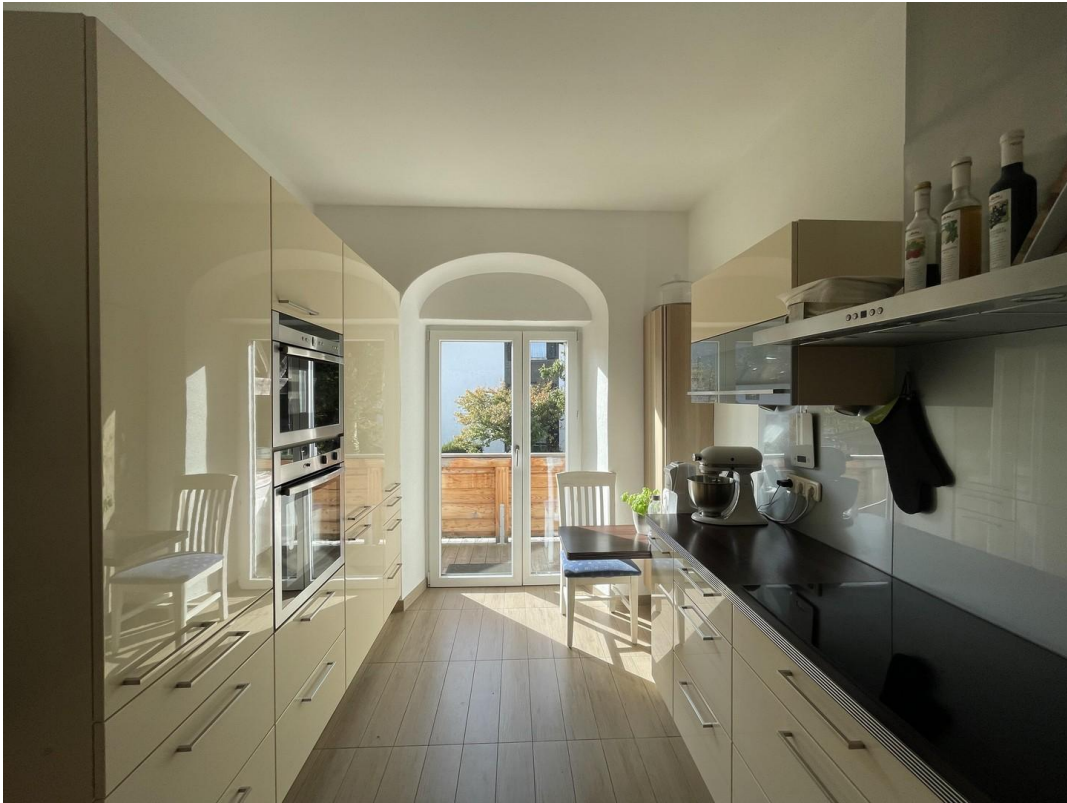
Küche mit Westbalkon