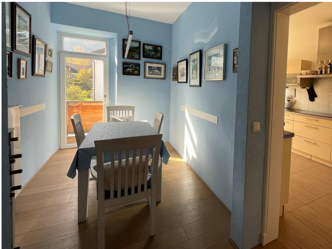
Offenes Esszimmer - Küche