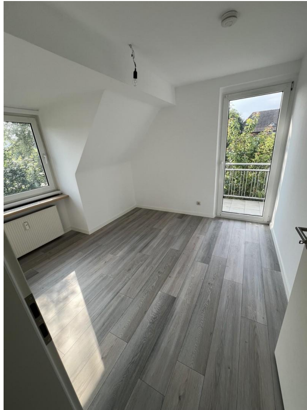
Schlafzimmer mit Balkon