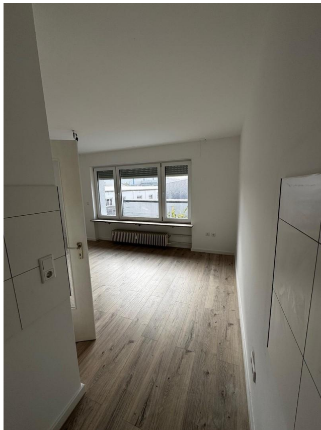
Blick aus Kochnische