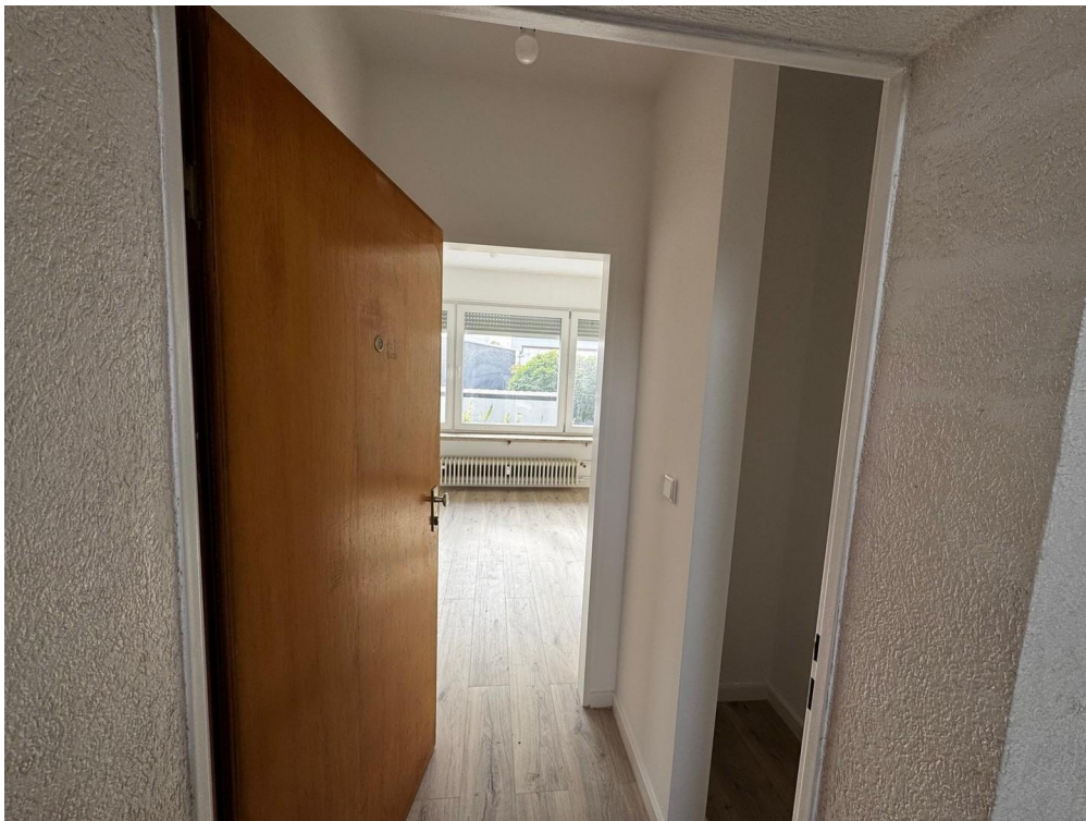
Zugang vom Treppenhaus