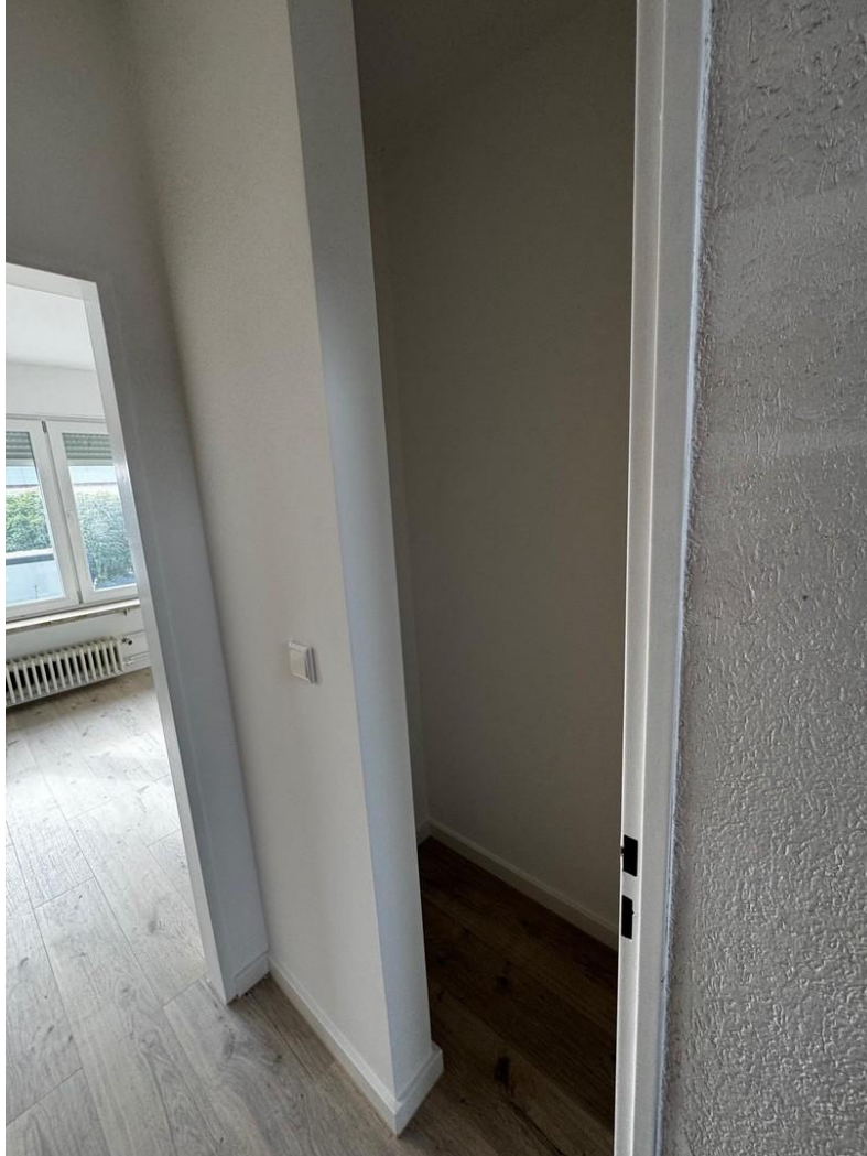
Abstellraum ggü. Bad