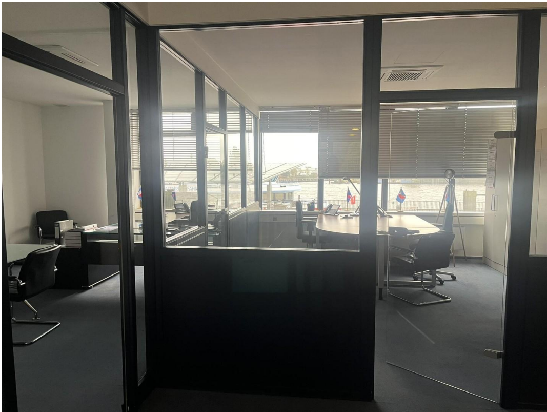
Blick in eines der Büros