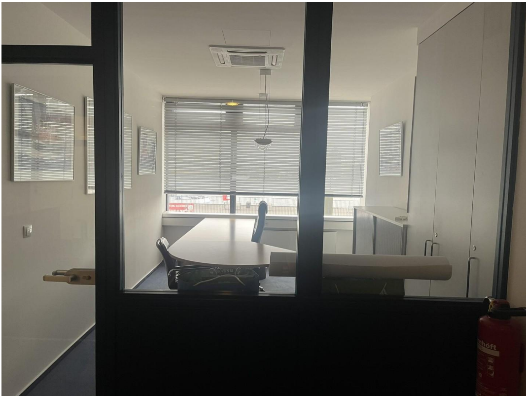
Büro ca. 17 qm