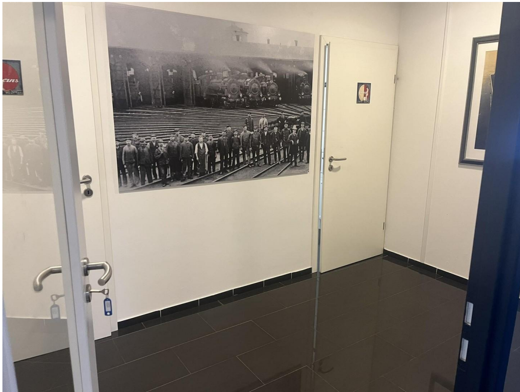
Vorraum der WC's