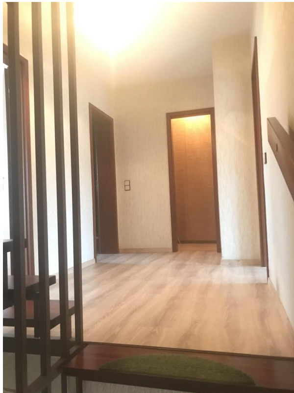
Flur 1. OG