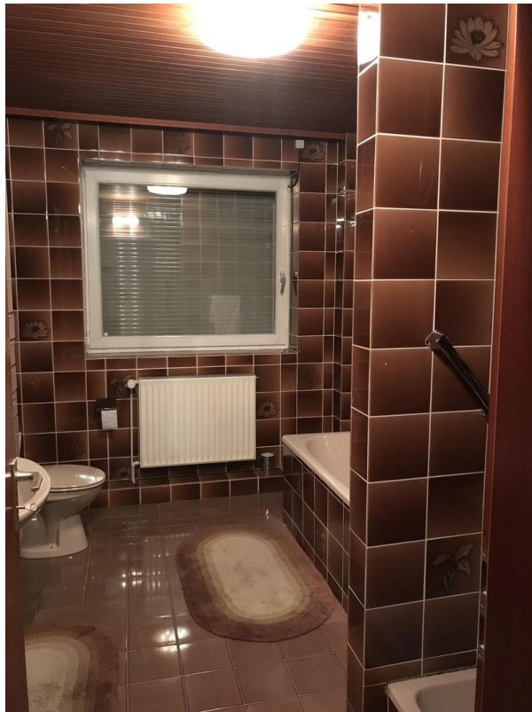
Bad-WC 1. OG