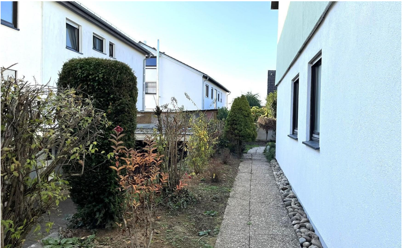
Weg vom Parkplatz zum Garten