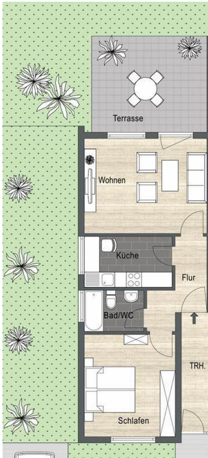
Grundriss EG links